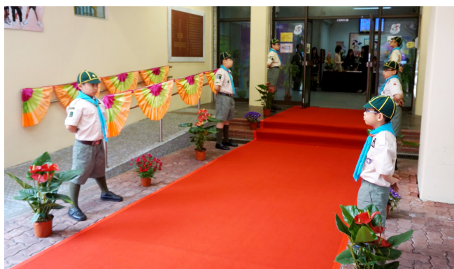
幼童軍站崗也是服務學習的機會