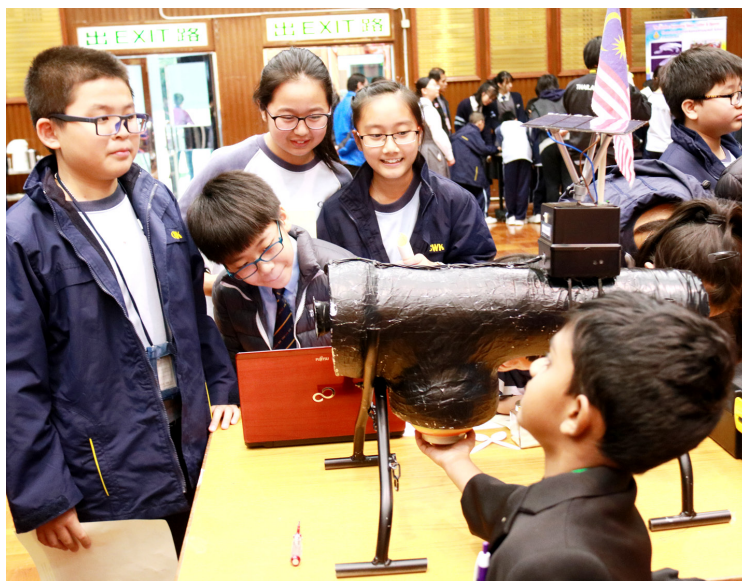
創新發明大賽為本港學生與來自不同國家/地區的學生提供學習交流平台

仁濟聯校合辦的香港國際學生創新發明大賽是學界一年一度盛事。「第四屆香港國際學生創新發明大賽」已於2016年12月17日圓滿舉行，逾百參賽者來自59間本地及不同國家/地區學校，參賽作品逾200件，均是歷屆之冠。當天頒發了多個獎項，包括初小及高小組的金獎；各組個人創新發明大獎、全場最高分之隊制發明品及全場最高分作品等。同場，來自印尼、澳門、台灣及泰國的領隊，更即場頒發「國際特別獎」，場面熱鬧。