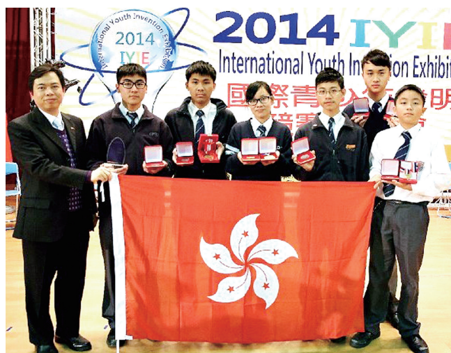
2014年國際青少年發明競賽博覽會