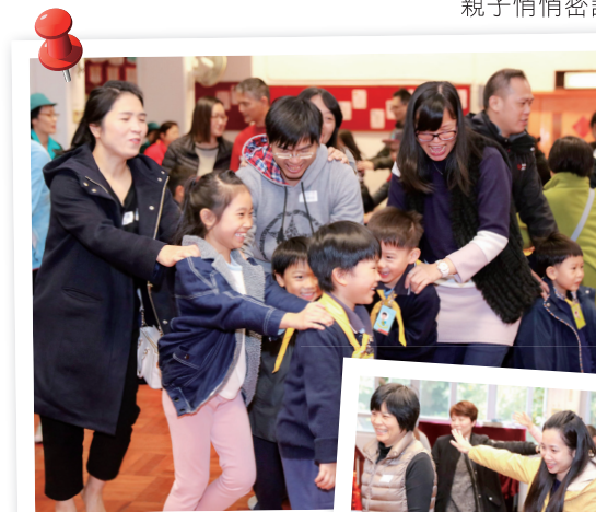
隨著導師說故事的內容，親子齊齊幻想成為小種子，透過形體互動，創意表達自己