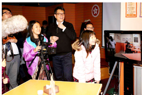
印尼隊師生在院屬董之英紀念中學的創藝大道廠景體驗拍攝