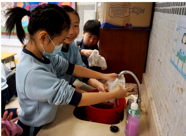
學生會自己清洗食具

為了協助剛剛升小的學生學會照顧自己及適應校園生活，趙小在2014/15年度銳意在一年級常識科加插自理能力的教學內容，而在2015/16年度，更推展至二年級，目標為：