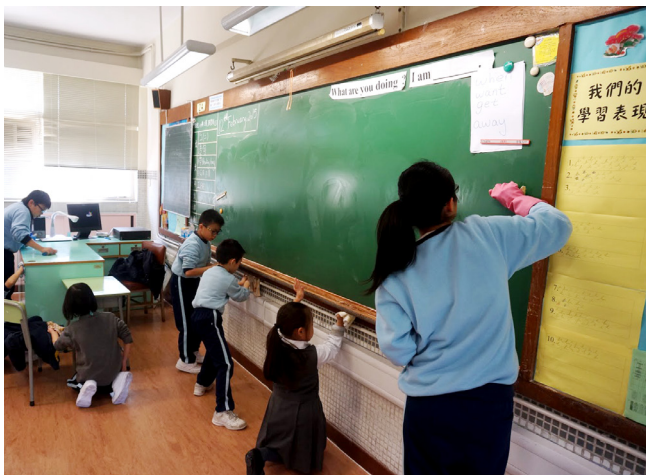
清潔班房，你我負責