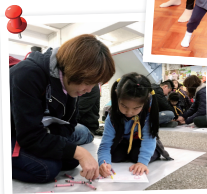
親子合作，你畫眼睛，我畫手腳，創作獨一無二「身體」骰子