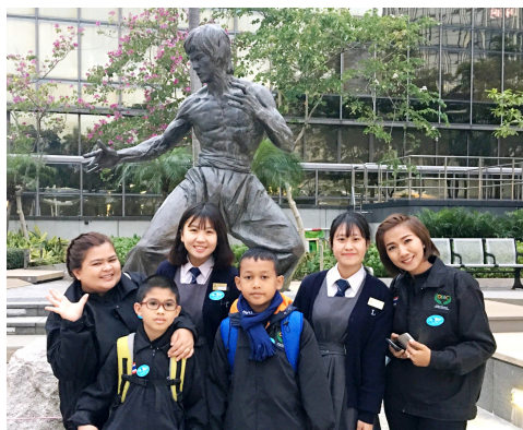
修讀旅遊與款待科的院屬林百欣中學學生擔任接待大使，帶領泰國師生遊覽尖沙咀名勝

比賽前夕，來港參賽的印尼隊、馬來西亞隊、泰國隊分別到訪仁濟院屬董之英紀念中學、靚次伯紀念中學及蔡衍濤小學，與仁濟師生進行學術文化交流活動。其後，他們前往仁濟醫院林百欣中學，了解本地創意發明教學概況及欣賞仁濟學生英詩獨誦，而外國隊師生更表演當地民族歌舞以及分享他們的參賽發明品等。