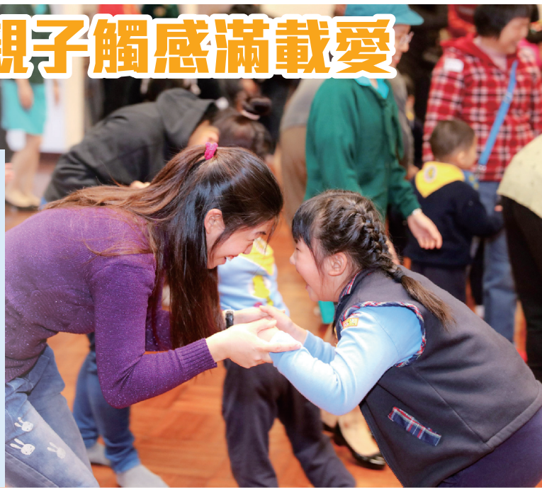
親子悄悄密語，化身成為愛的種子

日期：2017年1月14日 地點：仁濟醫院趙曾學韞小學 簡介：116名來自仁濟院屬友愛、永隆、林李婉冰及方江輝幼稚園/幼兒中心的幼兒，在香港女童軍總會助理區總監的監誓下，宣誓加入「快樂小蜜蜂隊」。宣誓典禮後，大會舉行「千蜂同樂日」親子活動，以「身體故事」主題，讓幼兒與家長一同用身體觸感去探索及參與有趣的遊戲，促進親子關係及鼓勵彼此珍惜和尊重生命。