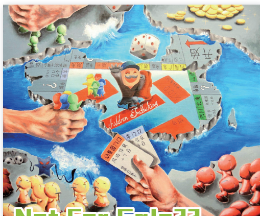
Not For Sale??

簡介：奴隸制度一詞仿佛早已在歷史中煙沒，奈何現實中仍有惡劣的人口販子將兒童的生命作為在金錢遊戲的注碼讓人髮指！作品反思人性之醜惡面。