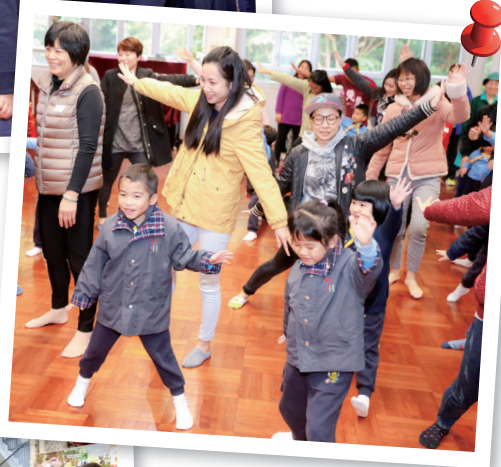
大家齊齊伸展肢體，摸索平衡感