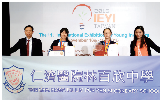
2015年第十一屆世界青少年發明展