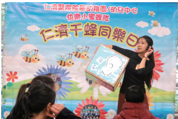
導師指導每組家庭創作屬於自己的「身體」骰子