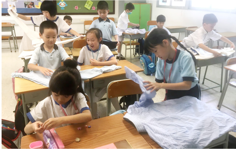
讓學生在成長過程中，學習自我照顧是十分重要，故仁濟醫院趙曾學韞小學特意在初小設校本自理課

現今的孩子是家長的寵兒和中心，但過份照顧，每每讓他們變得依賴，什麼事也不會或不願意去嘗試去做。仁濟醫院趙曾學韞小學（簡稱趙小）的教學團隊於2013年前往新加坡交流，發覺當地小學設有自理課，教導學生很多平日生活的技能，非常奏效。於是，趙小決定設計校本自理課程，並透過服務學習、制服團體及義工活動等，加強培訓學生紀律、生活技能及服務精神。