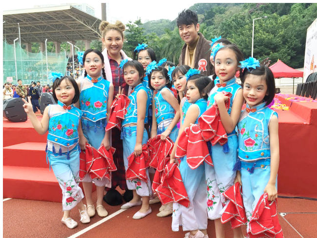
趙小舞蹈組為仁濟步行籌款演出

家長是子女最重要的模範，家長應用社交媒體的態度和行為，都會影響子女的態度和行為。若能給予子女適當引導和監察，必能減少磨擦，增進彼此溝通和關係，適當應用社交媒體，絕對有助家長與子女之間的溝通。