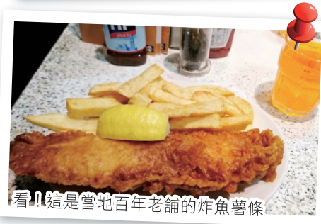
看！這是當地百年老舖的炸魚薯條