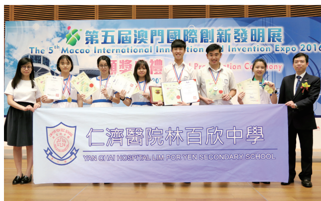
2016年第五屆澳門國際創新發明展