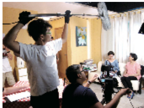
董中學生全程投入電影製作