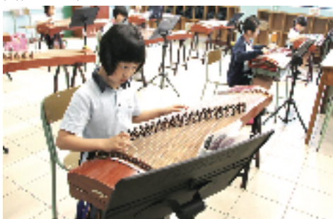
學生在「中華文化日」透過不同活動，如書法學習、中樂表演等，增加對中國傳統文化的認識