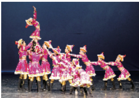
何小中國舞蹈隊榮獲「第51屆學校舞蹈節」團體總亞軍