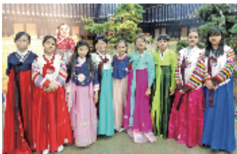
何小學生參與「南韓首爾文化境外交流團」，認識當地文化及學習科技教育