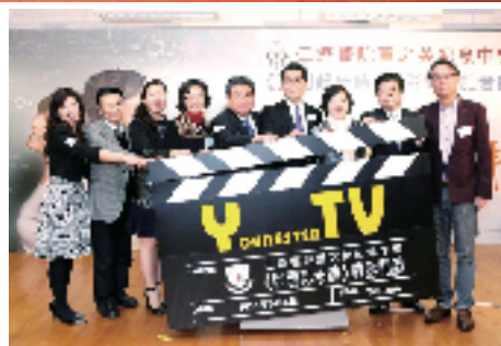
2015年3月6日，商務及經濟發展局蘇錦樑局長（左六）親臨《回到起步時》電影開鏡記者會，讚揚董中推動電影拍攝，讓學生可以有一個實踐的平台，發揮才能