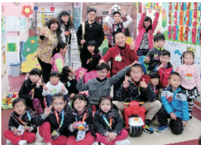
2015年3月永隆30周年校慶，一眾舊生重返母校，與校長恩師共話當年，隆情滿溢