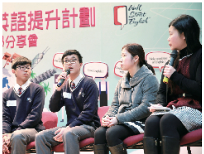
參與計劃的學生及導師，在2016年2月24日舉行「WSE-YCH中學生英語提升計劃」啟動禮暨教學分享會上分享學習歷程及得著