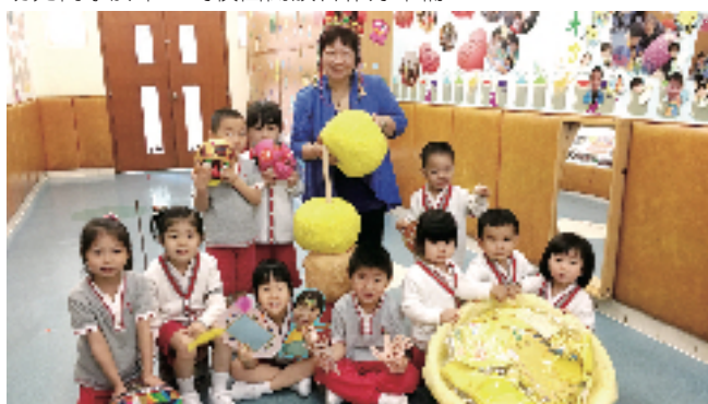
2016年4月29日永隆舉辦「小腳板遊世界開放日」，讓家長坊眾一同感受幼兒的創意與童真