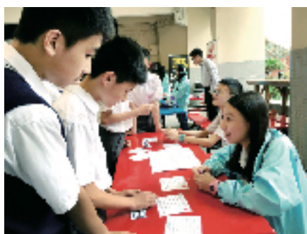
2016年5月中，院屬王華湘中學學生挑戰英語急口令，寓學於樂