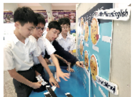
2016年5月下旬，院屬第二中學學生合力完成英語表情生詞配對遊戲