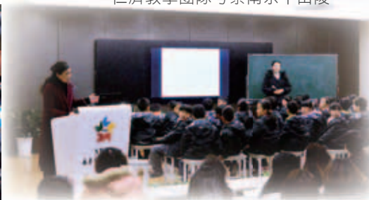
南京市五老村小學教師進行一節示範課