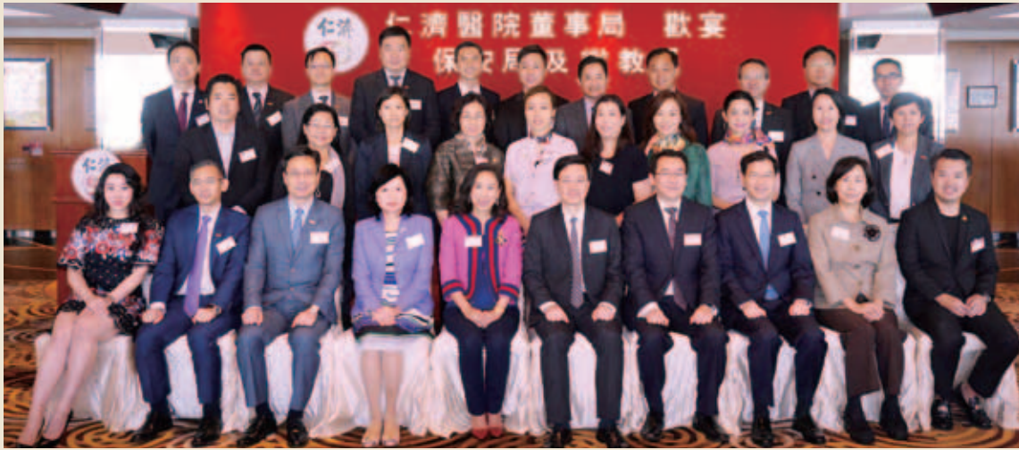
董事局與保安局李家超局長（前排右五）、黎陳芷娟常任秘書長（前排左四）、區志光副局長（前排右三）、李美美副秘書長（前排右二）、懲教署林國良署長（前排左三）、胡英明副署長（前排左二）及一眾官員合照留念