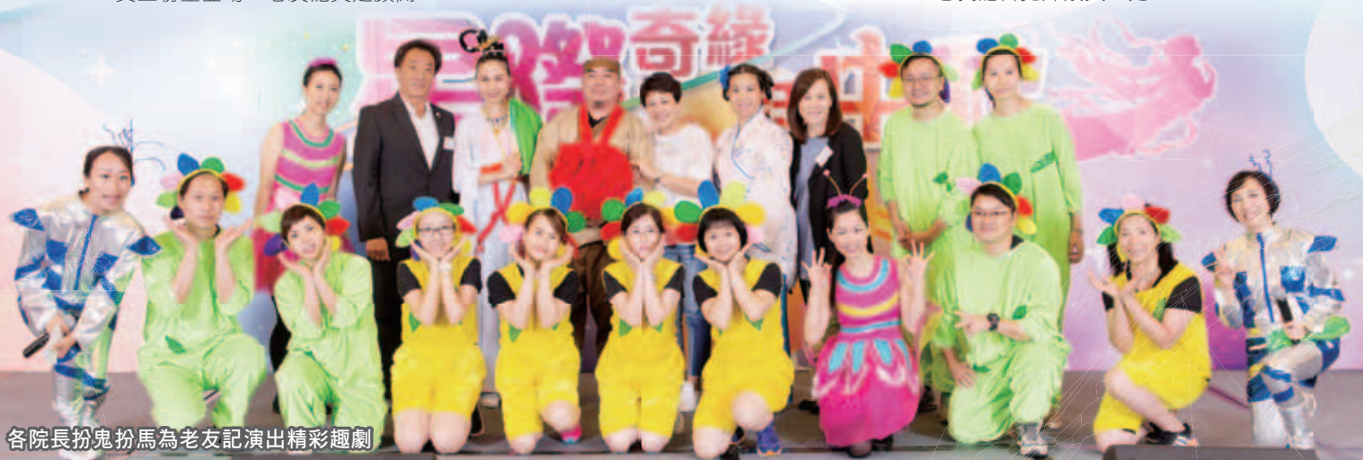
各院長扮鬼扮馬為老友記演出精彩趣劇