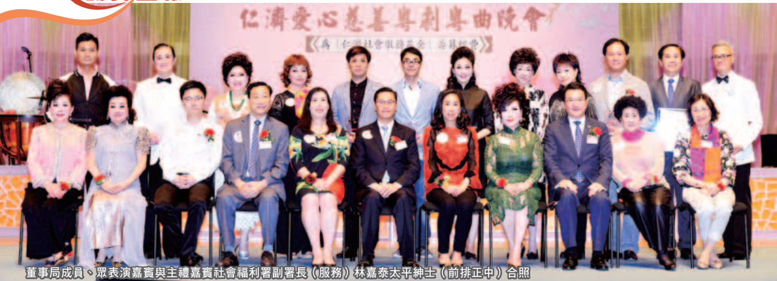
董事局成員、眾表演嘉賓與主禮嘉賓社會福利署副署長（服務）林嘉泰太平紳士（前排正中）合照