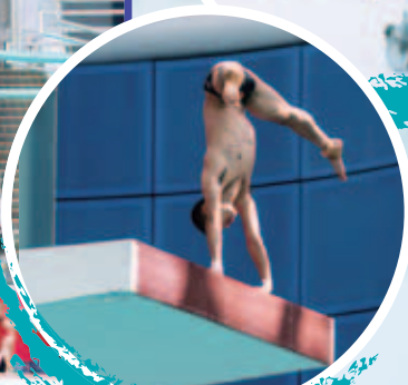
「夢之隊」施展真功夫，當中不乏於國際性賽事才能看到的高難度動作