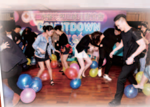
派對當晚設有多項互動遊戲，嘉賓玩得不亦樂乎