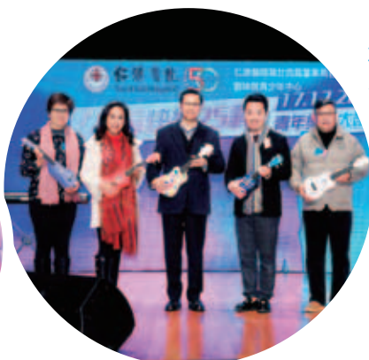
一眾嘉賓手持由中心青年親自製作的小結他

日期：2017年12月17日 地點：香港理工大學蔣震劇院 主禮嘉賓：社會福利署副署長（服務）林嘉泰太平紳士