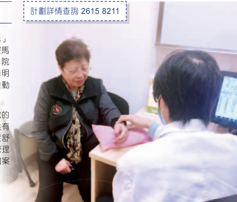
計劃惠及荃灣區65歲或以上受痛症困擾長者

計劃對象為荃灣區內65歲或以上受痛症困擾之長者，通過使用本院的中醫痛症服務及參與健康工作坊，讓長者能重塑愉快心靈，名額共有200個。每位合資格長者可以獲資助以港幣50元正享用5次中醫痛症舒緩治療、3次保健知識講座、1次長者友善社區工作坊或/及6節痛症管理小組（需由註冊社工推薦）。計劃由專業醫社人員負責推行和擔任個案管理員，專責處理及協調計劃內所有查詢、服務安排及跟進。