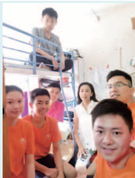
學生們送贈日用品及電視機予受助家庭，以表心意