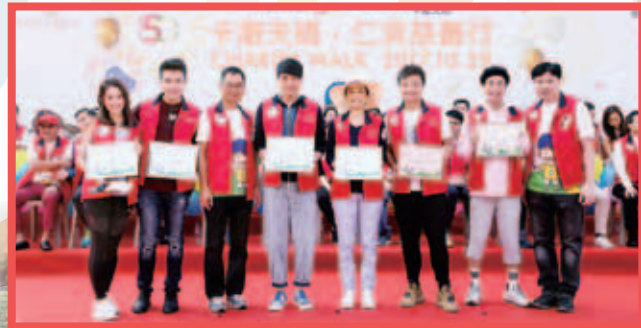
當日不少藝人一早到現場為參加者加氣