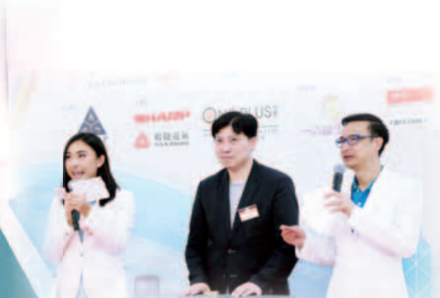
節目尾聲時加插抽獎環節，送出運動員親筆簽名T恤