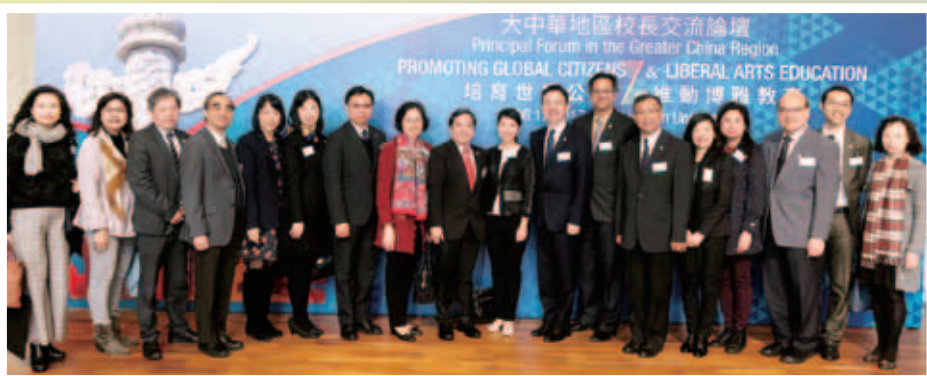
本院董事局成員及院屬校長與嶺南大學副校長兼慶祝復校50周年籌備委員會主席莫家豪教授（左九）濟濟一堂

本院連同香港校長專業發展促進會、香港中學校長會、香港小學教育領導學會，與嶺南大學合辦「大中華地區校長交流論壇」。2017年度主題是「培育世界公民與推動博雅教育」，吸引逾180名來自內地、台灣、澳門及本地的中小學校長及學者參與。大家就兩岸四地博雅教育/全人教育的實踐進行分享及交流。