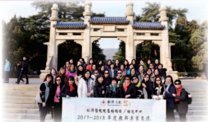
仁濟教學團隊考察南京中山陵

2017年12月26至29日，46名院屬幼稚園校長、主任及教師前往了南京進行境外交流活動，以考察當地「幼小銜接」的進程，並彼此作學術交流。在中聯辦、江蘇省教育廳、南京市教育局及南京師範大學的悉心安排下，教學團隊考察了南京市太平巷幼兒園、南京市鶴琴幼兒園及南京市五老村小學，深入了解內地幼兒園和小學在幼小銜接方面的措施及發展。此外，團隊亦到南京市師範大學參加「兒童權利與學前特殊兒童融合教育」講座，了解內地融合教育的推行模式及情況。團隊亦遊覽當地著名景區，如南京中山陵、科學博物館、南京博物館等，了解南京市的歷史及發展。