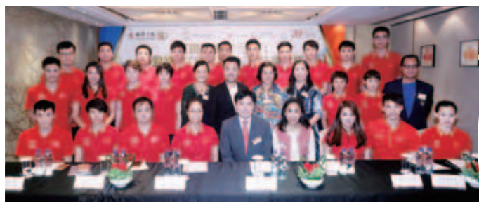
中國跳水隊與出席董事局成員合照

「夢之隊」到港後便馬不停蹄出席記者會，與一眾傳媒會面，預告訪港行程。一眾運動員亦於記者會上分享訪港感受。