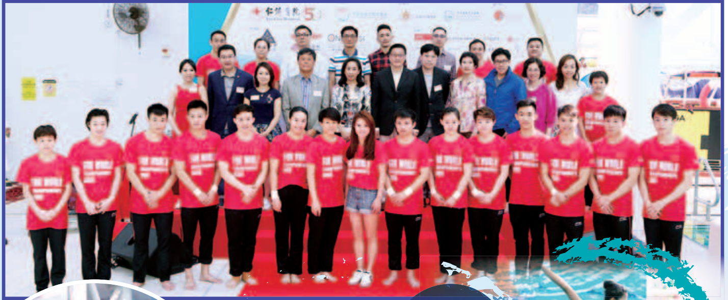
一眾主禮團與訪港運動員於匯演前合照

萬眾期待的示範表演於行程的第二天假九龍公園室內游泳池舉行，吸引了1,700名觀眾入場欣賞。為了讓全港市民一同欣賞中國跳水運動員的英姿，慈善大匯演由無綫電視翡翠台現場直播，節目由時捷集團冠名贊助。國家跳水隊聯同香港跳水隊代表示範池邊跳水、三米彈板及十米高台跳水，當中更加插香港韻律泳代表隊之表演，促進中、港兩地之間的運動員交流。