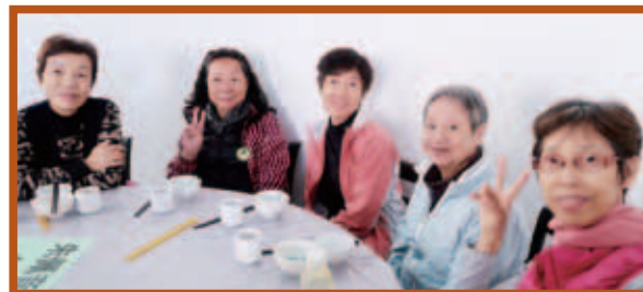
參與活動的長者享受美味齋宴