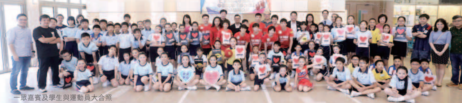
一眾嘉賓及學生與運動員大合照