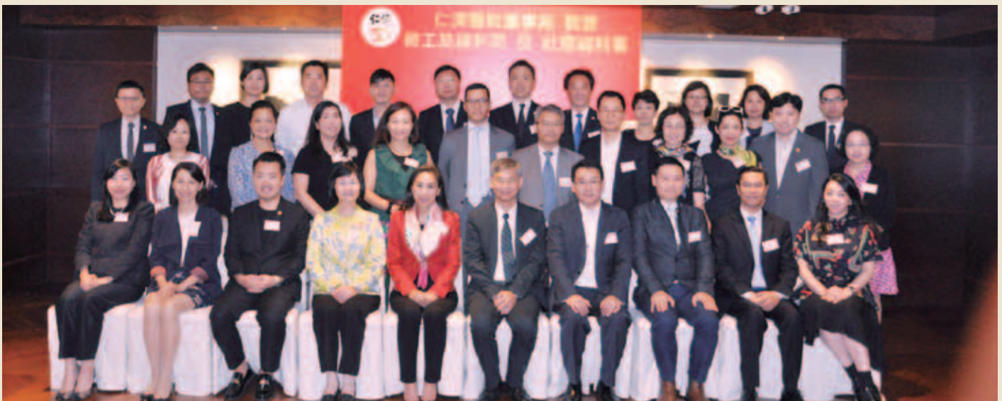
董事局與勞工及福利局羅致光局長（前排右五）、張琼瑤常任秘書長（前排左四）、徐英偉副局長（前排右三）、社會福利署葉文娟署長（前排左二）及一眾官員合照留念