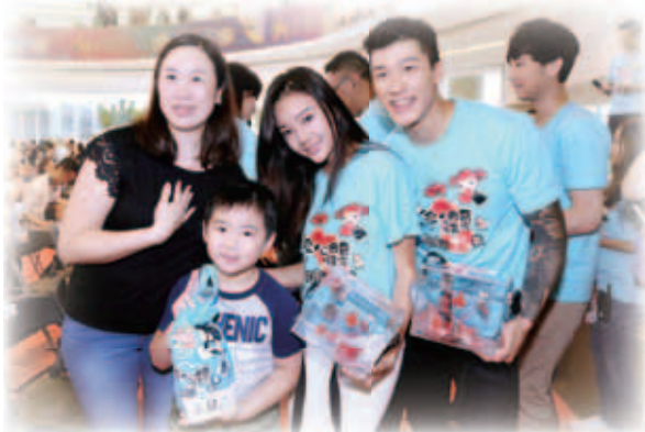
藝人落力呼籲市民購買愛心曲奇