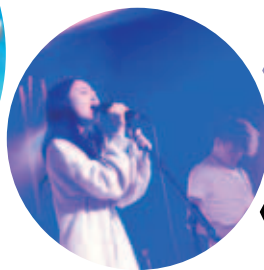
樂隊1301及樂隊StirFry參與表演

日期：2017年12月17日 地點：香港理工大學蔣震劇院 主禮嘉賓：社會福利署副署長（服務）林嘉泰太平紳士