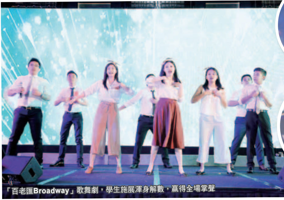
「百老匯Broadway」歌舞劇，學生施展渾身解數，贏得全場掌聲