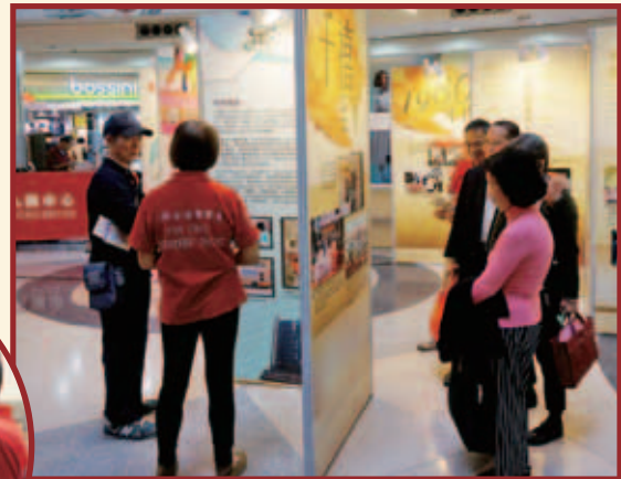
仁濟金禧導賞員細心向市民介紹仁濟歷史

為了讓公眾認識仁濟的歷史及發展，義診會場設有「仁濟50周年歷史展覽」，讓大家一起回顧仁濟過去半個世紀，由六十年代至千禧年代所經歷的五十年大事。展覽亦由經過培訓的「仁濟金禧導賞員」向公眾介紹仁濟歷史。