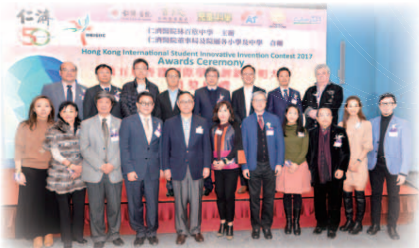
仁濟董事局代表及屬校校監、評審代表，與楊偉雄局長（前排左五）拍照留念