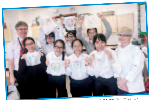
仁濟學生於Glenalmond College體驗藝術工作坊

是次蘇格蘭交流活動，由香港蘇格蘭教育聯盟（HKSEC）創辦人方志基先生全費贊助，透過一連串饒富意義的活動，例如到訪蘇格蘭Glenalmond College學習蘇格蘭傳統舞蹈，遊覽沉睡萬年的睡火山回眸愛丁堡全貌、寄住當地家庭了解不同文化、參加青年高峰會與前港督衛奕信爵士會面等，以英語作為溝通橋樑，體驗了不一樣的風情文化。