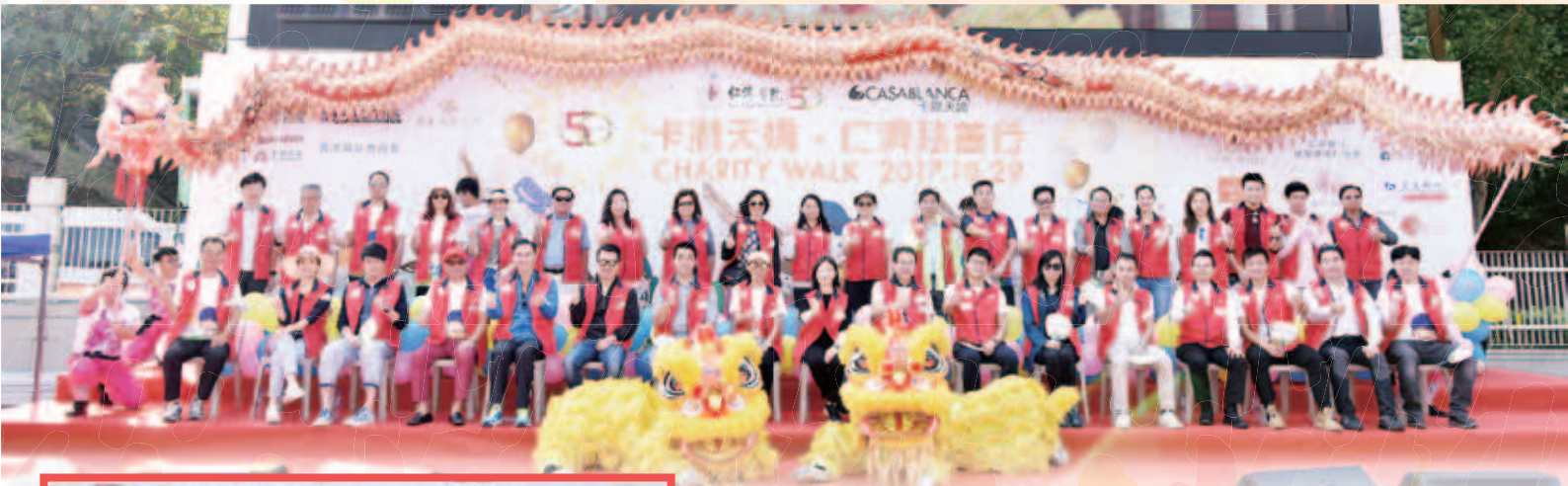
金龍及醒獅於台上與眾嘉賓合照

適逢今年仁濟50周年，為慶祝這個大日子，大會特別安排了龍獅共舞，為各參加者打氣之餘，亦祝願仁濟繼往開來，善款再創高峰，有更多光輝的50年！