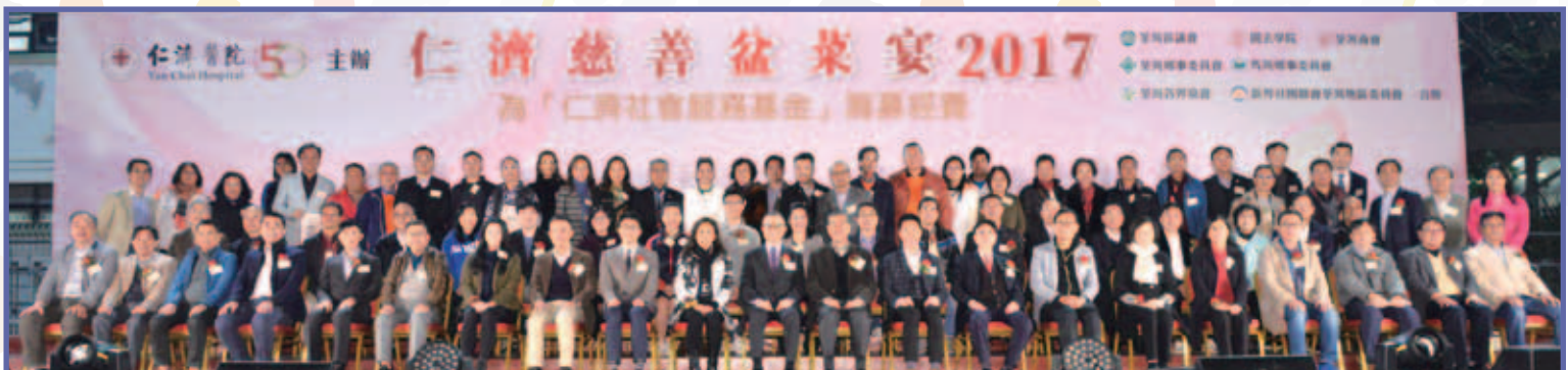
荃灣區各官員、盆菜籌委會成員及一眾合辦及贊助單位合照留念