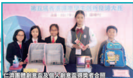
仁濟團體創意盃及個人創意盃得獎者合照