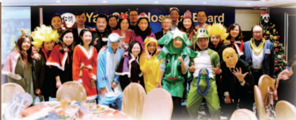
同事們悉心打扮競逐「最佳造型獎」