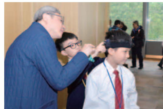
總評期間，小發明家即場向總評評判團主席葉豪盛教授介紹作品及解答提問