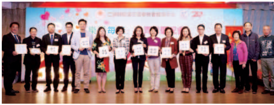
一眾嘉賓手持長者作品並合照留念