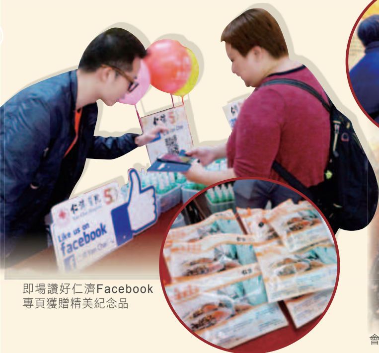
即場讚好仁濟Facebook專頁獲贈精美紀念品