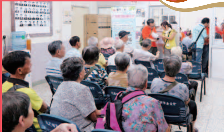
「仁濟緊急援助基金」於大澳鄉事委員會向大澳災民發放緊急援助金

去年8月颱風「天鴿」吹襲本港，造成大澳嚴重水浸，數百戶大澳居民受災，不少長者居民因未能將大型電器及傢具移至高處而損壞。董事局即時從「仁濟緊急援助基金」撥款60萬元支援受影響的大澳居民，向合資格及已登記的年滿65歲以上獨居或兩老同住長者，每戶發放2,000元緊急援助金或全新雪櫃一個。基金共向239戶大澳災民共發放港幣37萬6千元援助金及51部全新雪櫃。本院於去年9月9日舉行「送暖到大澳」行動，當天天氣晴時雨，是次援助工作能夠順利完成，實有賴多個單位及地區團體的協助。