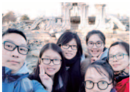
北京名勝古蹟處處，仁濟師生參觀世界遺產天壇、國家重點文物園明園，以及重要地標天安門廣場、國家大劇院等