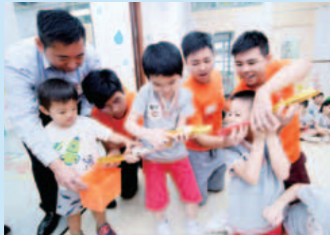
大小朋友都全神貫注參與競技遊戲