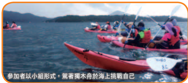
參加者以小組形式，駕著獨木舟於海上挑戰自己