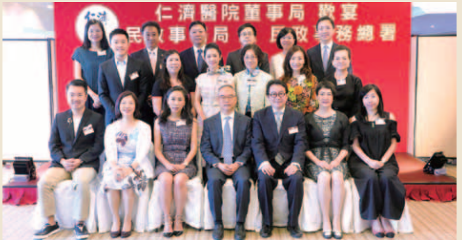
董事局與民政事務局劉江華局長（前排中）、民政事務總署謝小華署長（前排左二）及荃灣民政事務處葉錦菁專員（前排右二）及一眾官員合照留念