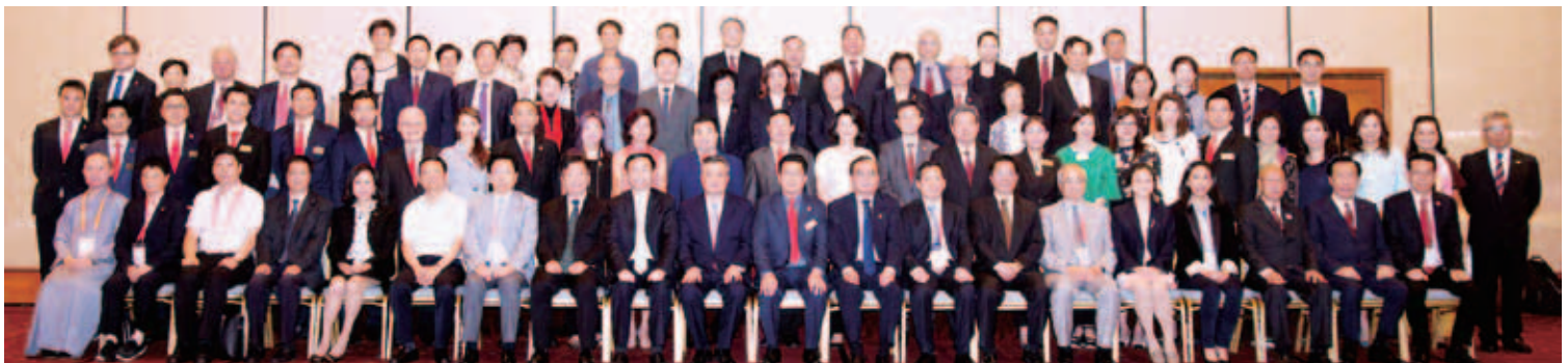
訪蘇團全體成員與江蘇省王江副省長(前排左十)大合照留念

訪問團四天行程豐富，亦藉此了解南京這個「一帶一路」重要交匯點城市。行程包括參觀侵華日軍南京大屠殺遇難同胞紀念館、參加「中國抗日戰爭歷史」專題講座、會見江蘇省領導、參觀中車南京浦鎮車輛有限公司及與愛德基金會作公益慈善分享交流。訪問團並向愛德基金會「智愛家園長者綜合照顧項目」捐款共人民幣80萬元，以幫助基金會設立失智症長者照顧專區、日間照料中心及資源中心、提升服務水平及加強社會倡導。