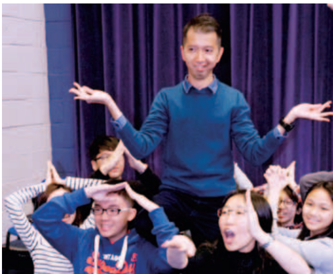
師生一起學習肢體動作表演的方式

我很感謝老師，因為她為了我們，每天都十分辛苦，在這次的交流中我的自信增加了。我明白到原來之前自己不敢說英文只是膽怯，當把一直收起的勇氣拿出來，才知道自己其實做得到，自己也在交流中學會更多的課外知識，我還要感謝陪我一起面對困難的同學，如果沒有他們，可能我連踏出第一步的勇氣都沒有。