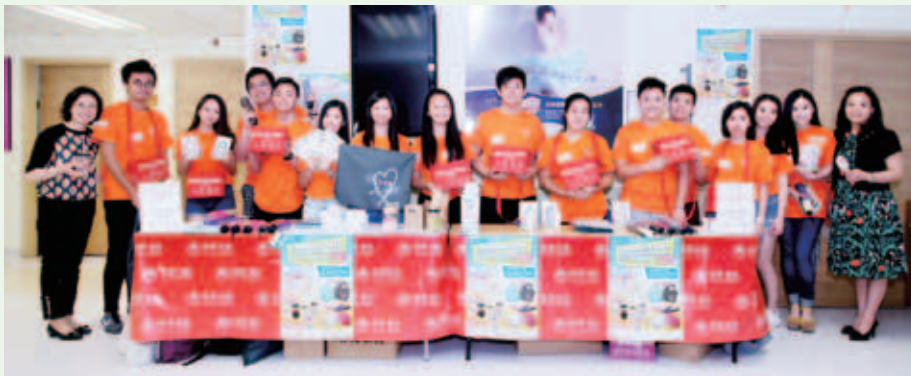
董事局成員與學生會成員一起落力勸銷