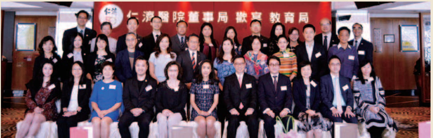
董事局與教育局楊潤雄局長（前排右五）、楊何蓓茵常任秘書長（前排左五）、蔡若蓮副局長（前排右三）及一眾官員合照留念