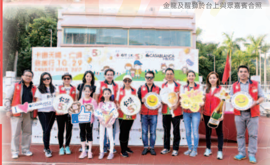
今年是仁濟50周年，眾嘉賓各手持慶祝的標語合照