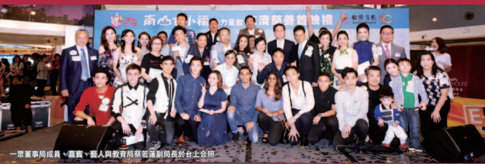
一眾董事局成員、嘉賓、藝人與教育局蔡若蓮副局長於台上合照