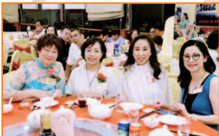
悅聲金曲愛心曲藝社