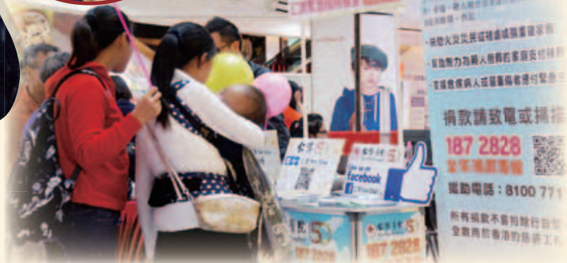
會場設有「仁濟緊急援助基金」月捐計劃宣傳攤位