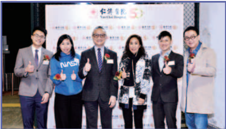
主禮嘉賓食物及衛生局徐德義副局長（左三）及眾嘉賓均對活動讚好