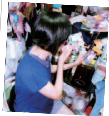
何女士望著亡夫舊照，憶起往事如煙，難免覺得傷感