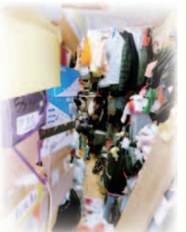
何女士的居所佈滿別人贈送或自己拾回來的二手舊物

當她決定要辦好丈夫身後事時，又因經濟拮据而難以支付殮葬費用。她在徬徨無助之際找社工求助，經轉介申請「仁濟緊急援助基金」。她感激仁濟施以援手，「在我為殮葬費而惆悵的時候，基金助我送別丈夫最後一程。」