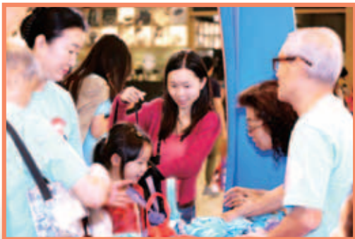
義工們積極地向市民介紹愛心曲奇