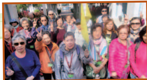
秋高氣爽，長者到屯門妙法寺一日遊