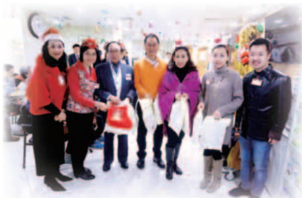
董事局成員及當年顧問帶同聖誕禮物送予病人，為他們送上節日祝福

適逢冬至，一眾董事局成員及當年顧問在去年12月22日為仁濟醫院住院病人送上溫暖祝福。其後更與董事局員工一起參與聖誕聯歡會。大會今年特設最佳服裝獎，同事們悉心打扮，競逐獎項，為聖誕聯歡增添不少氣氛。遊戲環節中，當中考驗同事的敏捷身手及準確的判斷力，當中「一手定重量」環節由兩名中藥配藥員勝出遊戲。