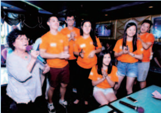
「你問我愛你有多深…」，學生們與老友記合唱懷舊金曲

「老吾老以及人之老，幼吾幼以及人之幼」，學生會及董事局成員分別到訪仁濟轄下的裘錦秋幼兒中心/幼稚園與及與方若愚長者鄰舍中心的老友記茶聚。在幼兒中心/幼稚園，哥哥姐姐們與一眾小朋友玩遊戲、做做小手工，唱唱歌；另外，他們更別開生面地陪伴一眾老友記到卡拉OK茶聚，歡樂的歌聲令小小的房間亦洋溢著一股快樂及和諧的氣氛。透過溫馨的接觸，為長幼們送上真摯的關愛。