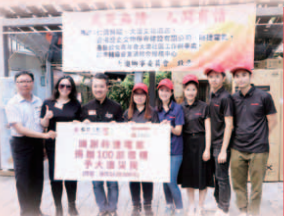
董事局鳴謝時捷電氣捐贈100部雪櫃予大澳災民