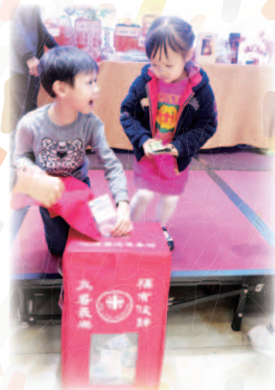
小朋友年紀小小已懂得盡其所能為仁濟籌款