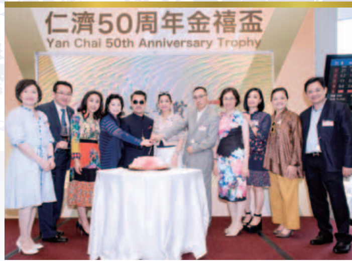
活動為一眾生辰之總理及顧問慶祝生日