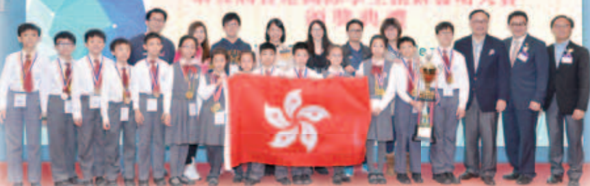
馮卓能副主席（右二）伴同楊偉雄局長（右三）頒發「仁濟金禧盃」予得獎學校仁濟醫院蔡衍濤小學