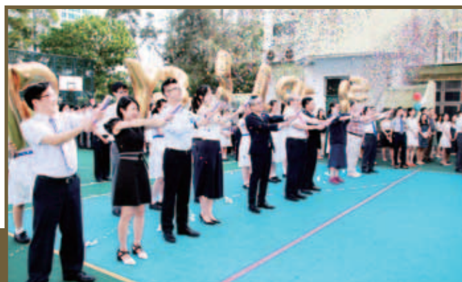
眾嘉賓參與氣球升空及拉花炮儀式

院屬林百欣中學校慶活動精彩紛呈，日後尚有開放日、校慶典禮、校慶晚會、友校學科及體育比賽等，歡迎各界蒞臨參與，詳情可留意學校網頁： www.ychlpyss.edu.hk/~lpy