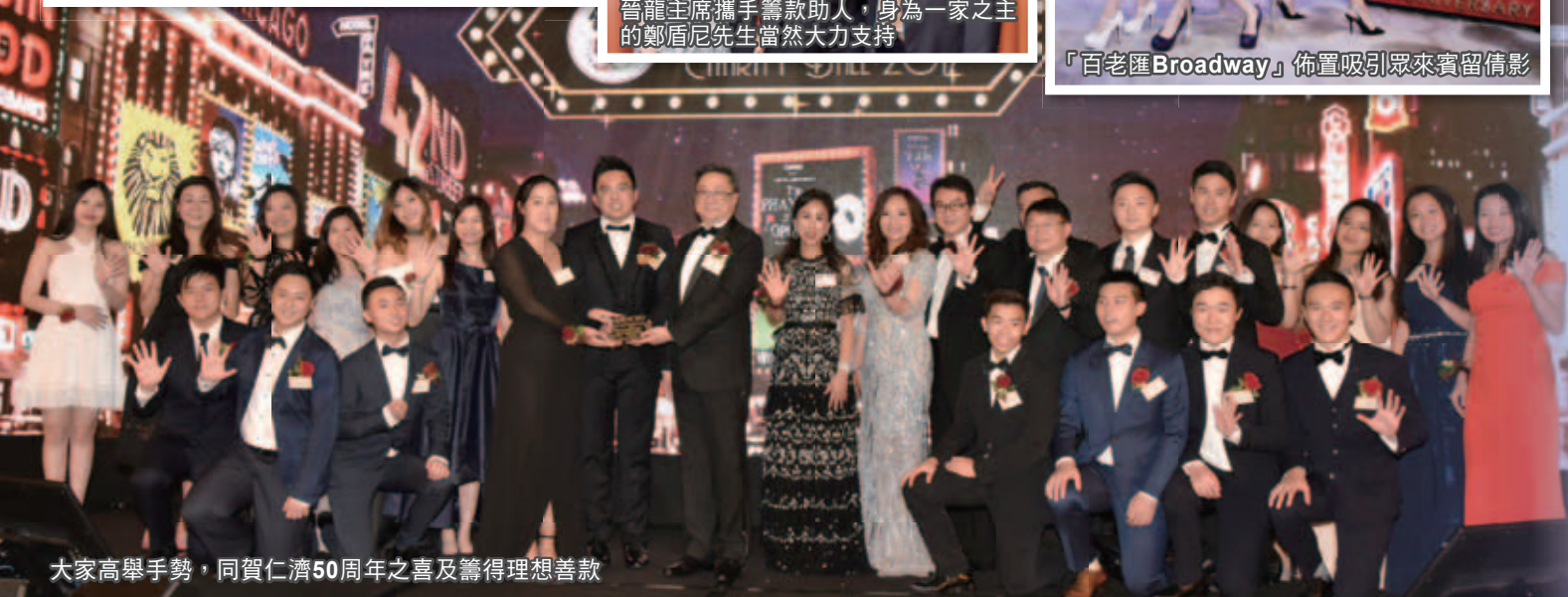
大家高舉手勢，同賀仁濟50周年之喜及籌得理想善款