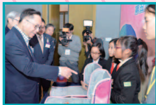
楊偉雄局長參觀創新發明賽展覽，並讚揚小發明家觀察力強及富創意

大賽總評、頒獎典禮暨展覽當天，吸引逾300師生、家長及嘉賓到場。大會頒發了多個獎項，包括初小及高小組的金、銀、銅及優異獎；各組個人創新發明大獎。此外，2017年欣逢仁濟董事局金禧紀念，大會特設「仁濟金禧盃」，頒發予參與最多發明品同時獲獎最多又最高級別獎項的學校。同場，大會還頒發了「傑出創新發明指導老師大獎」及「優秀創新發明學校大獎」；而來自馬來西亞、印尼等國家領隊，更即場頒發「國際特別獎」，場面熱鬧，參加者亦滿載而歸。