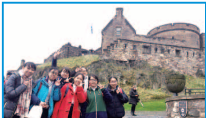
參觀遊覽愛丁堡城堡