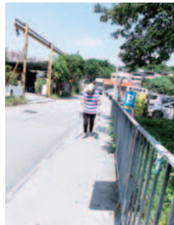
右腳傷後，每行一步，皆感到傷口發痛與腳軟