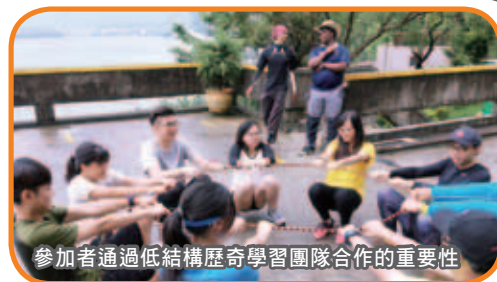
參加者通過低結構歷奇學習團隊合作的重要性

一濟醫院學校社工及支援服務獲荃灣區議會撥款舉行「荃灣區青少年Outward Bound領袖訓練計劃2017」，活動於去年9月30日至10月1日舉行，透過兩日一夜的外展訓練營，讓26位青年領袖通過獨木舟、高空繩網及露營等活動學習互相合作以及彼此尊重，並結合「觀察學習」及「經驗學習」的方法，鞏固他們對「領袖素質」的認識。完成活動後，參加者紛紛表示活動讓他們更勇於面對困難，克服自我恐懼，挑戰自己，並學習到團隊精神的重要性。