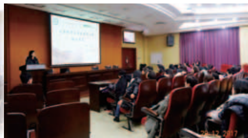
交流團隊參與南京師範大學鄭荔博士的講座