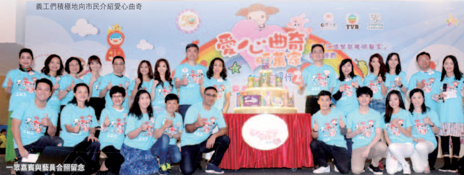
一眾嘉賓與藝員合照留念