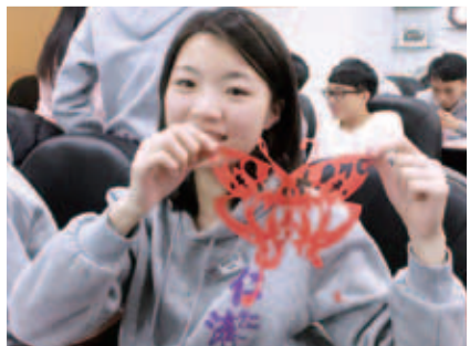
除知識類的文化及歷史講座外，亦有剪紙及篆刻的體驗課程，讓學生親自完成並擁有相關作品