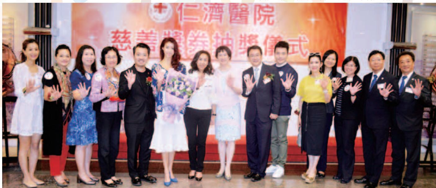
眾嘉賓於儀式後合照留念，並舉起代表仁濟醫院董事局金禧的五字手勢