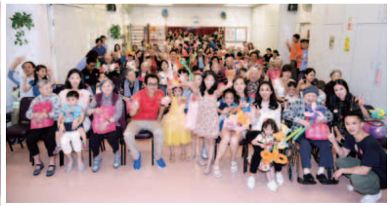
多位董事局成員響應活動，以身作則，帶領一眾小天使行善助人