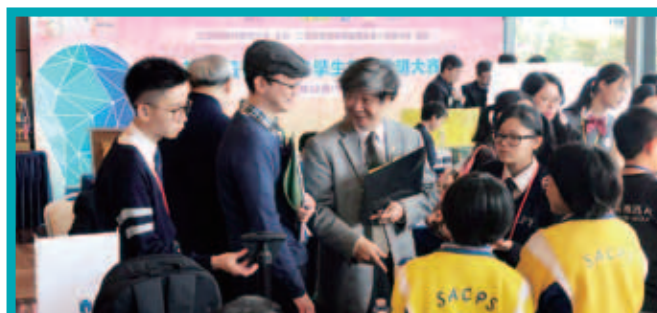
大會獲香港數碼港管理有限公司贊助場地，舉行大賽總評、頒獎典禮暨展覽，場面熱鬧