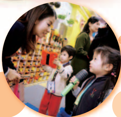
院屬永隆幼稚園/幼兒中心的小記者訪問考察團隊成員