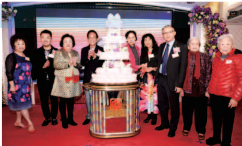
主禮嘉賓聯同一眾出席嘉賓進行切蛋糕儀式，為周年晚宴活動揭開序幕