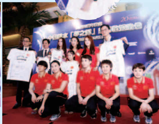
多位董事局成員從訪港運動員手中接過親筆簽名T恤