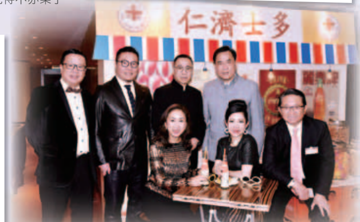
備受歡迎的仁濟士多為賓客提供各式各樣的懷舊小食