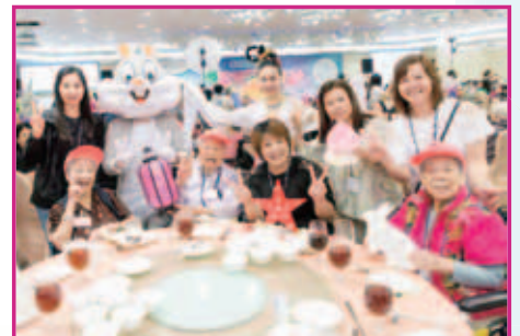
老友記喜見嫦娥與玉兔

是次聯院聚餐集合了九間院舍的老友記濟濟一堂，享用豐富午餐，同時欣賞大會為各位老友記預備的精彩節目。表演節目莊諧並重，包括中樂演奏及肚皮舞表演等，但令人最難忘的就是各位院長一同參與趣劇表演，載歌載舞，扮鬼扮馬，令人捧腹大笑。