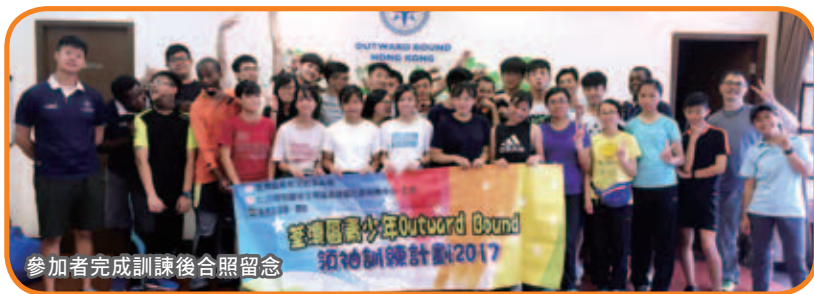
參加者完成訓練後合照留念