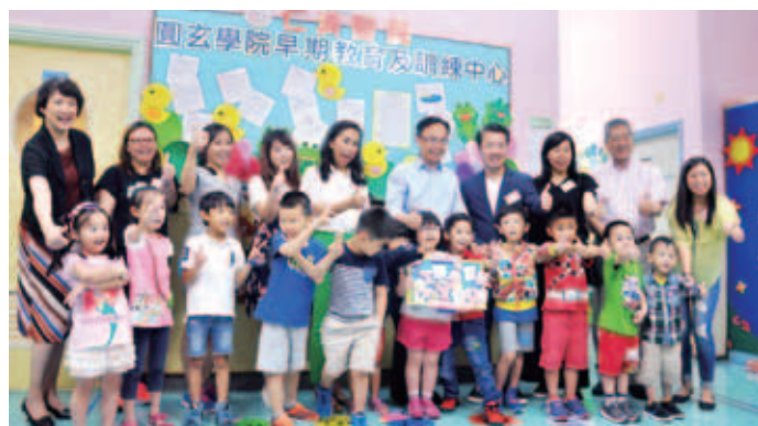
中心小朋友親手製作紀念品以感謝聶局長的到訪