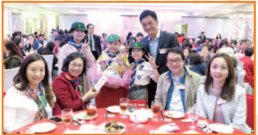
小童軍們於籌款晚宴落地義賣