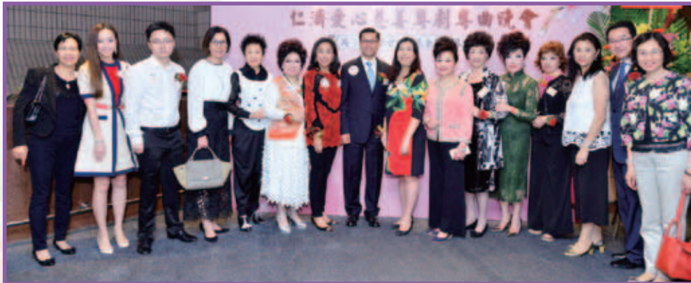
董事局成員與眾嘉賓合照

粵劇粵曲乃中國文化藝術的精粹，在中國有著廣泛的群眾基礎，而且還流傳到海外各地。是次晚會可以讓更多市民加深對中國傳統文化的了解，並為「仁濟社會服務基金」籌得超過145萬元善款，以支持仁濟屬下非政府資助單位及服務計劃的運作，同時亦會善用捐款舉辦不同類型活動予本院的服務對象。當晚本院更撥出部份座位免費招待老友記一同欣賞，弘揚敬老尊長的美德。