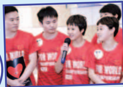
運動員們亦樂意地分享他們訓練生活的點滴