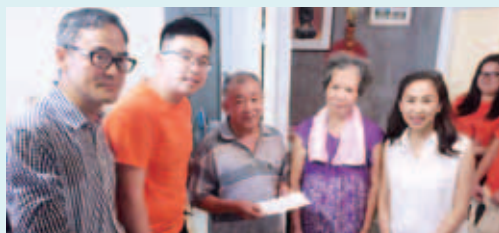
海外學生會一同前往汀角村向受水災影響的長者送上慰問，並向他們發放緊急援助金，助他們渡過難關