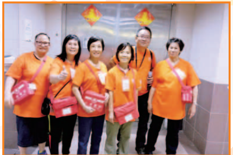
大窩口邨上樓籌款