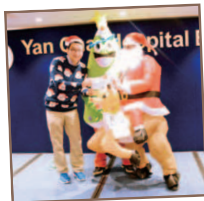
「最佳造型獎」由中醫教研中心（西九龍）同事奪得

適逢冬至，一眾董事局成員及當年顧問在去年12月22日為仁濟醫院住院病人送上溫暖祝福。其後更與董事局員工一起參與聖誕聯歡會。大會今年特設最佳服裝獎，同事們悉心打扮，競逐獎項，為聖誕聯歡增添不少氣氛。遊戲環節中，當中考驗同事的敏捷身手及準確的判斷力，當中「一手定重量」環節由兩名中藥配藥員勝出遊戲。