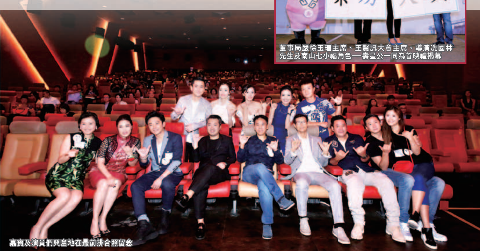
嘉賓及演員們興奮地在最前排合照留念