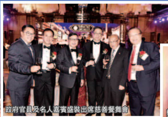
政府官員及名人嘉賓盛裝出席慈善餐舞會