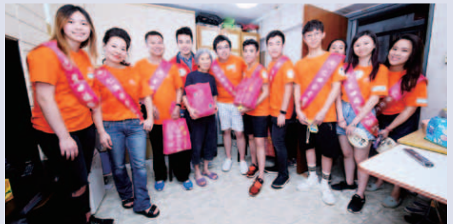
獨居婆婆得到一眾年青人探訪，開心不已