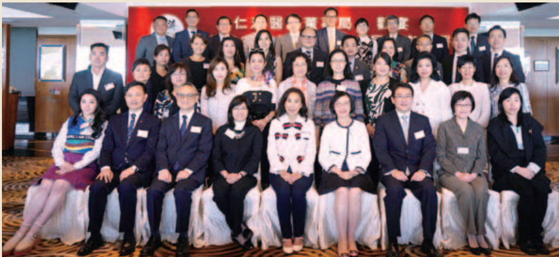
董事局與食物及衛生局陳肇始局長（前排右四）、謝曼怡常任秘書長（前排左四）、徐德義副局長（前排左三）、衛生署陳漢儀署長（前排右二）、醫院管理局梁栢賢行政總裁（前排左二）及一眾官員合照留念