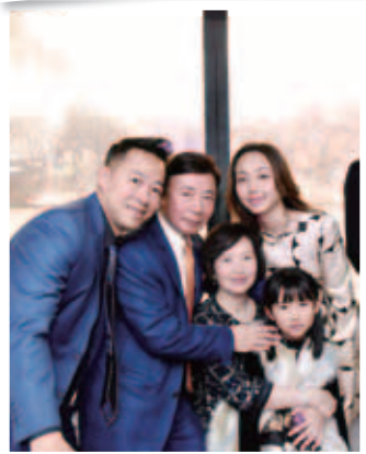
會員與親友於煙火盛放下迎接2018年