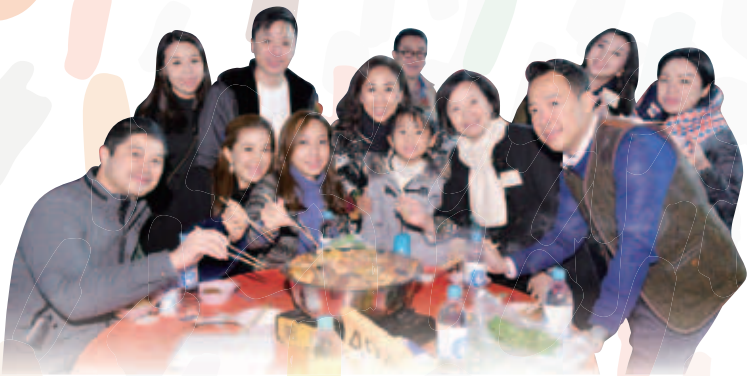
董事局成員與家人共享熱騰騰的盆菜

由仁濟醫院主辦，荃灣區議會、圓玄學院、荃灣商會、荃灣鄉事委員會、馬灣鄉事委員會、荃灣各界協會及新界社團聯會荃灣地區委員會合辦的「仁濟慈善盆菜宴」已是第8年成功舉辦。今年活動筵開接近600席，招待約6,000名善長，全場座無虛設，場面壯觀。當晚大會邀請多位表演嘉賓，並於現場義賣多款別緻福品，街坊們紛紛慷慨解囊，熱烈支持！而活動舉辦8年來已累積為仁濟籌得過千萬港元善款，成績斐然！