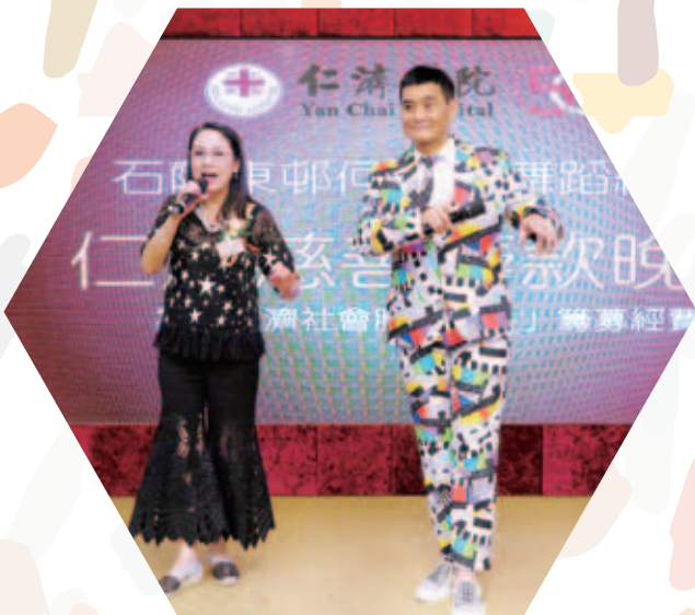
歌星王俊棠與賓客合唱