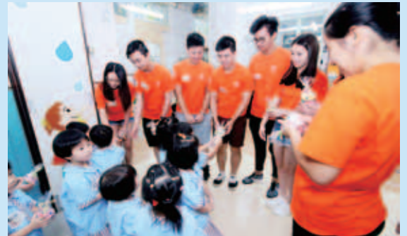
小跳豆們親手送上小禮物以表達對哥哥姐姐們的謝意