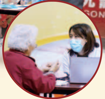
中醫師細心向求診市民問診

為慶祝仁濟五十周年紀念及推廣中醫保健養生健康訊息，本院董事局及仁濟醫院—香港浸會大學中醫教研中心（西九龍）特別舉辦上述活動，是次活動除了推廣仁濟的中醫服務之外，亦旨在宣揚中華民族幾千年來的健康養生理念，藉此提高大眾對中醫藥的認識。一連三天的活動合共為超過300名市民進行義診，反應非常踴躍。