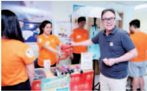
途人以行動支持善舉

無懼酷熱與汗水的海外學生會成員，聯同各董事局成員穿梭各區街頭、港鐵及商場，落力向各途人勸銷慈善義賣物品，市民都被他們的誠意打動，紛紛慷慨解囊。