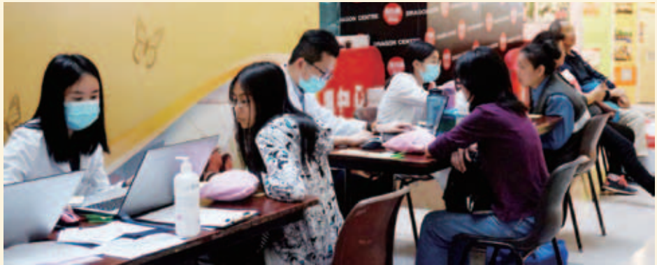
註冊中醫師為市民進行義診