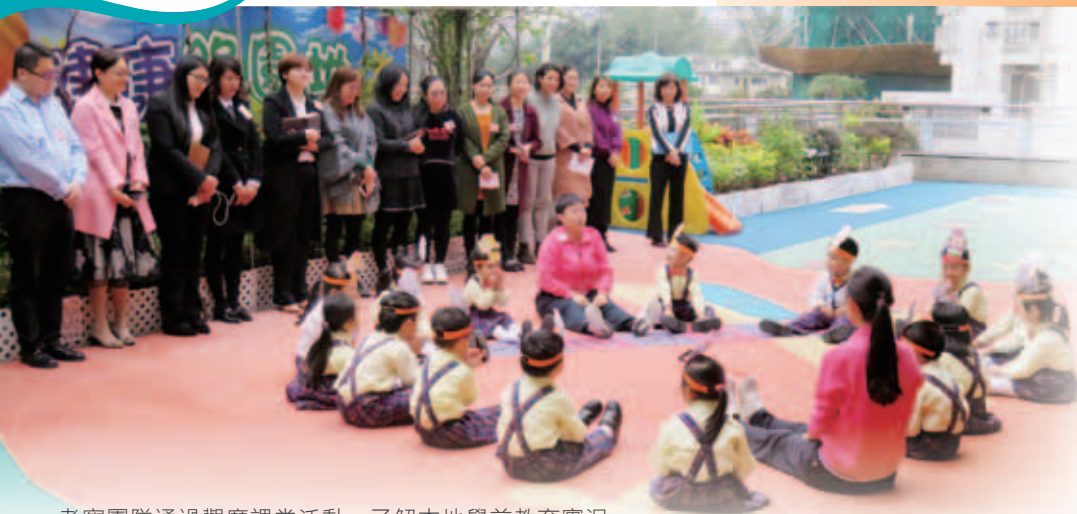
考察團隊通過觀摩課堂活動，了解本地學前教育實況