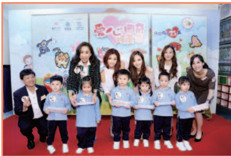
眾嘉賓到仁濟醫院董伯英幼稚園/幼兒中心作慈善探訪，與小朋友大玩遊戲