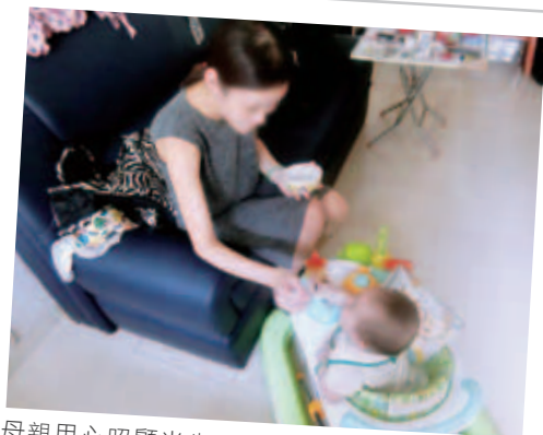
母親用心照顧半歲的兒子，靜候父親早日釋放回家團聚

基金致力於減輕在囚者孩子的經濟困難，以紓緩配偶與家人的壓力。香港懲教署稱，過去五年來，平均每宗罪行成本約使用公帑24萬元，作為犯罪衍生的社會成本。無論對社會或對於在囚人士的家庭來說，社會犯罪的代價實在太大了。