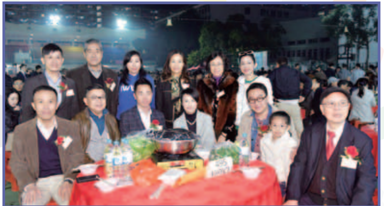
總理與嘉賓們於「開餐」前大合照