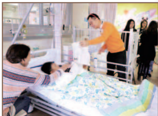
鄭斯堅總理為住院病童送上聖誕禮物