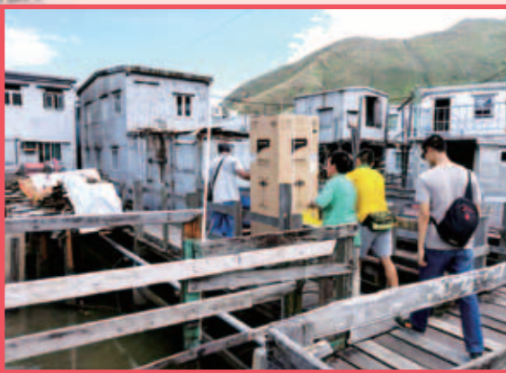
義工將全新雪櫃運送到災民家中，以解其燃眉之急