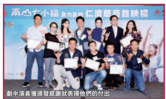
劇中演員獲頒發感謝狀表揚他們的付出

當晚星光雲集，多位名人及藝人均到場親身支持。大家對電影都讚不絕口，非常認同影片所傳達的正面訊息。