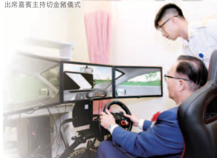
物理治療部同事指導嘉賓使用新添置的互動復康器材