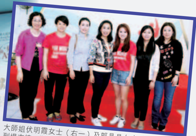
大師姐伏明霞女士（右一）及郭晶晶女士（左三）均有到場支持，為師弟師妹打氣