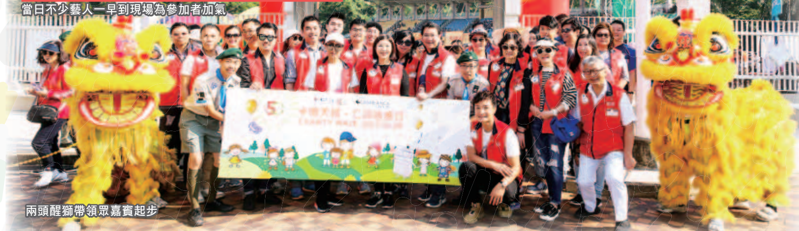
兩頭醒獅帶領眾嘉賓起步