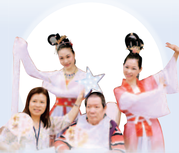
員工粉墨登場，老友記笑逐顏開