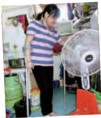
阿蘭右腳扭傷後需包紮綑帶，走路也需拐杖輔行。

假如遇上不幸遭遇的是閣下，你是否會感到徬徨無助，驚惶失措呢？又或者你對這些不幸的朋友或事件有否感動，會否伸出援手呢？「仁濟緊急援助基金」設有〈月捐計劃〉，現誠邀你一起參加，為社會上身處困境的一群人士帶來曙光和關懷。