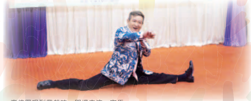
麥德羅唱到興起時，即場表演一字馬