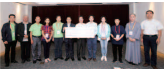
訪蘇團捐款人民幣80萬元予愛德基金會