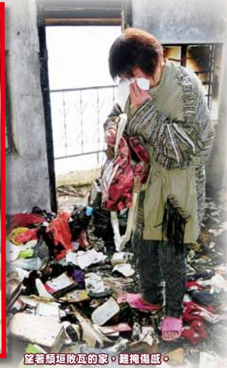
望著頹垣敗瓦的家，難掩傷感。