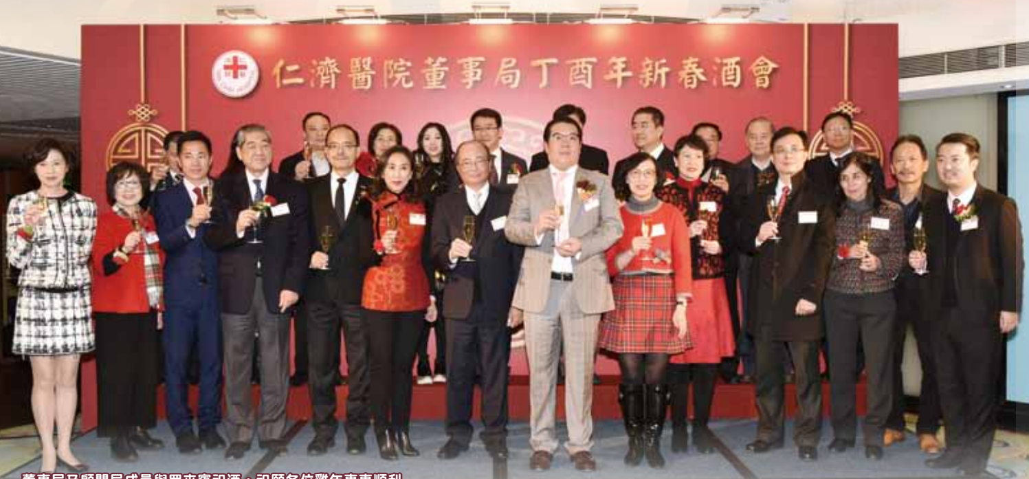
董事局及顧問局成員與眾來賓祝酒，祝願各位雞年事事順利

本院亦藉此佳節頒發長期服務獎予接近900位服務醫院、學校及社會服務單位滿10至30年的同事，以及多位榮休員工，以表揚他們對社會及本院多年來的貢獻。