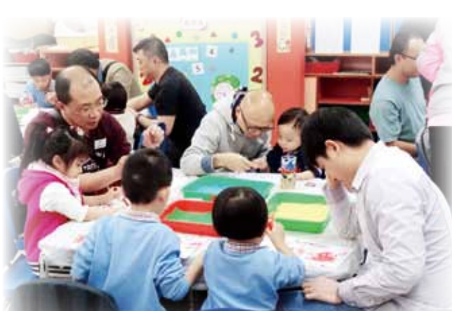
院屬蔡百泰幼稚園/幼兒中心的幼兒與一眾爸爸齊齊做手作，有助增進關係及彼此了解

2017年2月11日及18日，推廣父親親職文化的組織DADs Network分別到訪院屬董伯英幼稚園/幼兒中心，以及蔡百泰幼稚園/幼兒中心，舉辦「與爸爸有個約會」活動，內容包括專題講座及親子工作坊。兩次活動共吸引逾數十個家庭參與，一眾爸爸更認為活動能讓他們進一步了解子女，獲益良多。