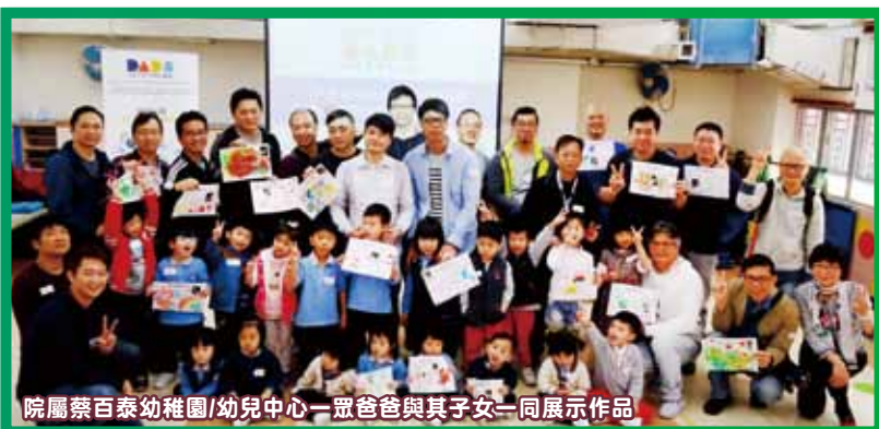
院屬蔡百泰幼稚園/幼兒中心一眾爸爸與其子女一同展示作品