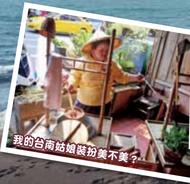
我的台南姑娘裝扮美不美？