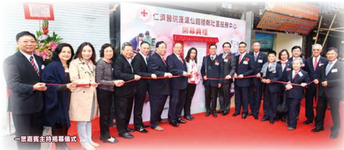
一眾嘉賓主持揭幕儀式