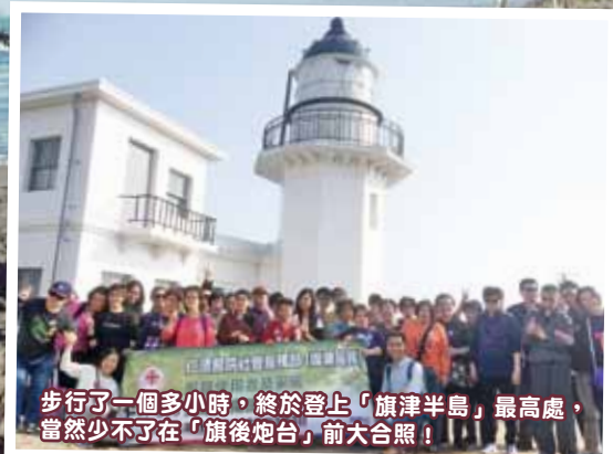
步行了一個多小時，終於登上「旗津半島」最高處，當然少不了在「旗後砲台」前大合照！