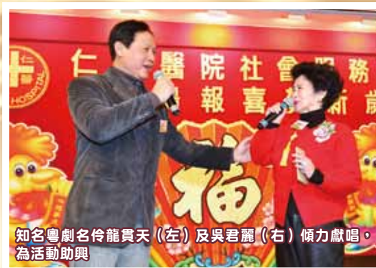
知名粵劇名伶龍貫天（左）及吳君麗（右）傾力獻唱，為活動助興

仁濟醫院董事局及安老服務部承傳每年的善舉舉辦「金雞報喜賀新歲」敬老齋宴活動，筵開百席，特別向千餘名的長者獻上祝福及敬意，歡渡新春佳節，當日更得到多位知名粵劇大老倌及粵曲唱家班朋友擔任表演嘉賓，到場傾力獻唱粵曲，宣揚敬老精神。