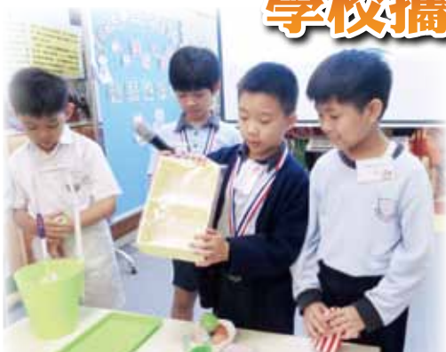
院屬蔡衍濤小學學生除了向幼兒介紹著名的發明家外，還展示及講解個人發明品

本院鼓勵屬校加強協作，豐富學生閱歷，以提升學與教質素。早前，院屬永隆幼稚園/幼兒中心推行「小小發明大聯盟」計劃，邀請了院屬林百欣中學及蔡衍濤小學的學生發明家到校，與幼兒分享個人發明作品及創作意念，讓他們思考創意科學如何改善生活，師生均獲益不淺。