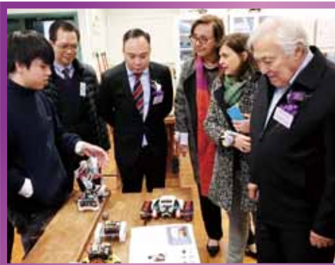
學生向嘉賓展示及講解機械人教學成品