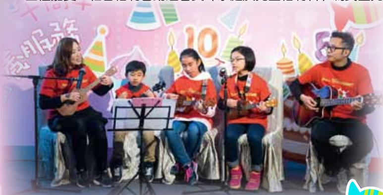
「夏威夷小結他隊」為典禮演奏愛回家

本院衷心感謝寄養姨姨、叔叔以及社區保姆姨姨，感謝各位付出寶貴的時間、愛心及耐心，為有需要的家庭以及兒童提供支援，本院青幼服務全人會繼續與大家同心同行，以愛互相連繫，令兒童在滿有愛與關懷的環境中成長。