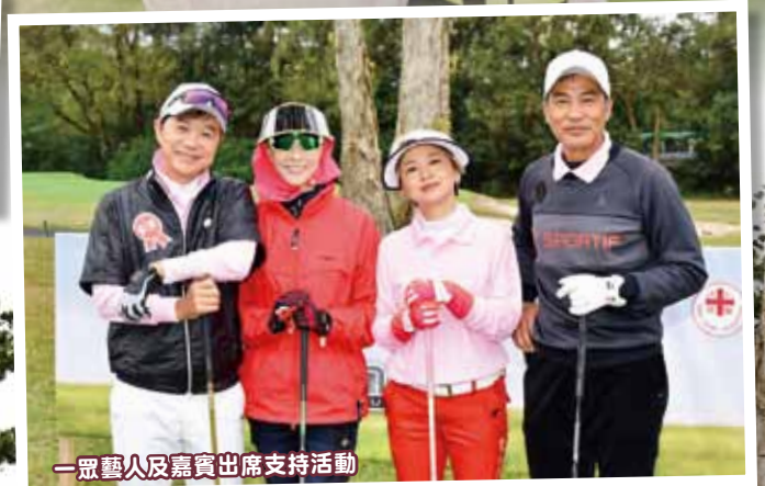
一眾藝人及嘉賓出席支持活動