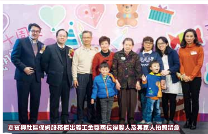
嘉賓與社區保姆服務傑出義工金獎兩位得獎人及其家人拍照留念