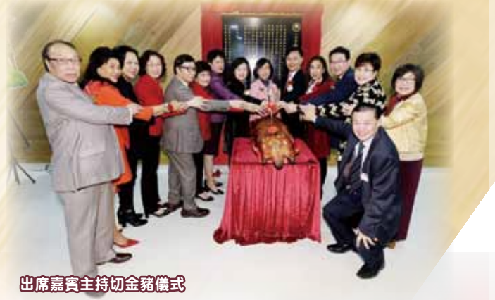
出席嘉賓主持切金豬儀式