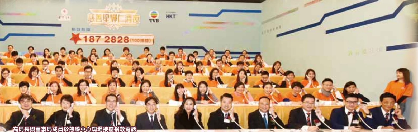
高局長與董事局成員於熱線中心現場接聽捐款電話