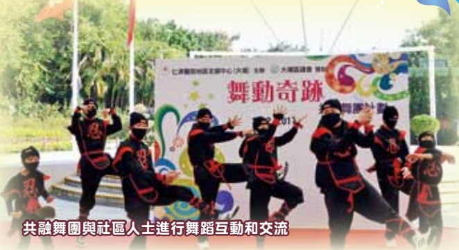
共融舞團與社區人士進行舞蹈互動和交流