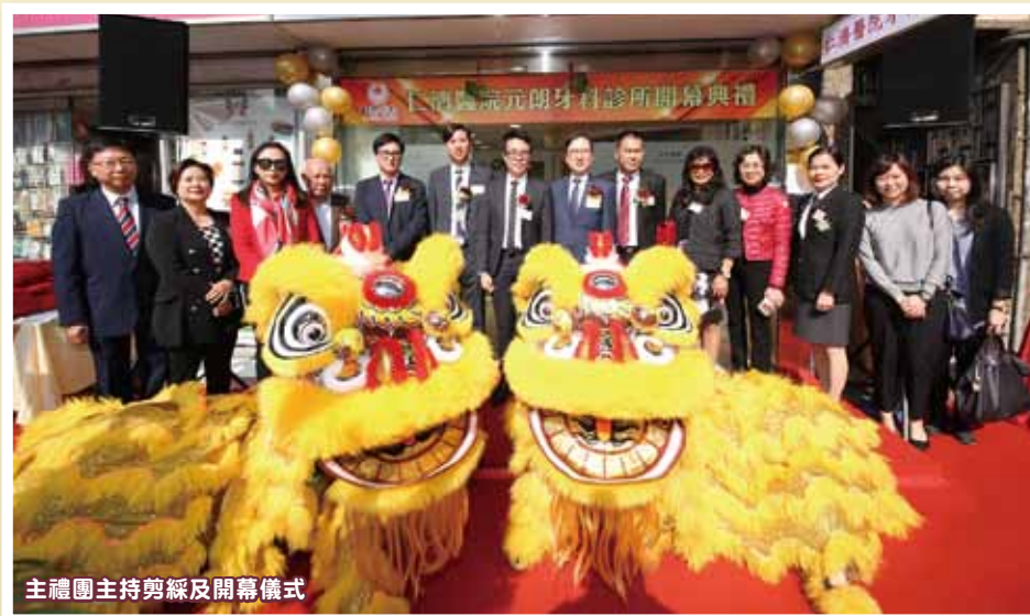
主禮團主持剪綵及開幕儀式

仁濟醫院牙科診所（元朗）已於去年9月正式投入服務，並為本院第十間牙科診所，標誌著本院牙科服務發展的一個新的里程碑。診所配置了先進的醫療設備如數碼全景掃描系統，為區內居民提供更完善的牙科護理服務。