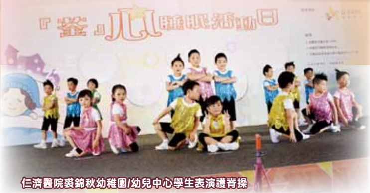
仁濟醫院裘錦秋幼稚園/幼兒中心學生表演護脊操