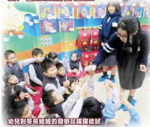
幼兒對哥哥姐姐的發明品躍躍欲試

此外，13名來自林百欣中學中四至中六學生亦在院屬永隆幼稚園/幼兒中心體驗幼兒教育工作。學生在聆聽簡介後，便進入各級課室，協助教師進行教學工作。由於大家皆是「仁濟人」，交流過程幼兒對哥哥姐姐的關愛，甚感親切和溫暖。