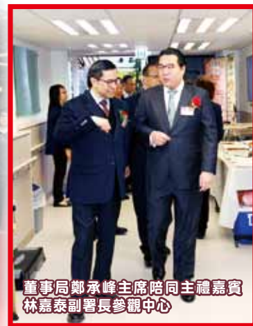
董事局鄭承峰主席陪同主禮嘉賓林嘉泰副署長參觀中心