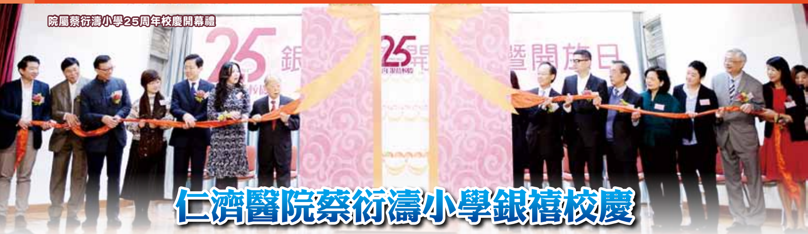
院屬蔡衍濤小學25周年校慶開幕禮