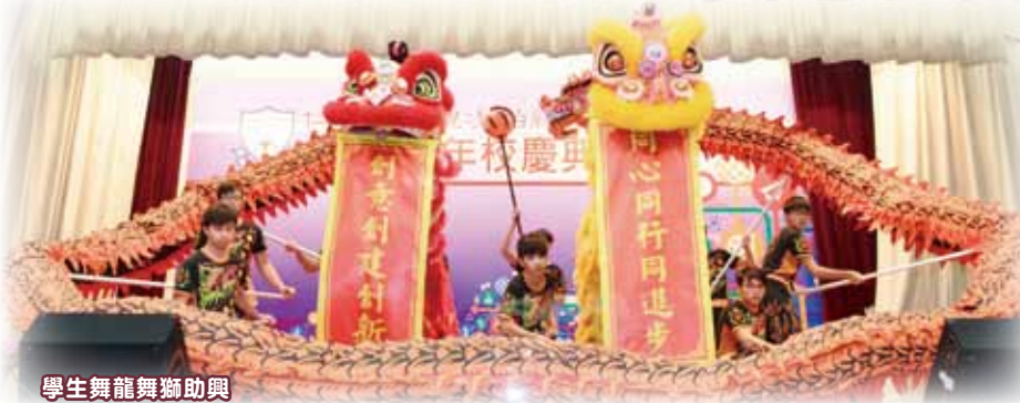
學生舞龍舞獅助興

同日，學校亦為「靚中Maker Space」機械人教學活動室舉行開幕儀式。學生表演舞龍舞獅、昔日校友隊獻出花式跳繩等為母校助興。典禮完結後，學校更舉行盆菜晚宴，筵開50席招待一眾嘉賓友好、師生校友。當晚更舉行大抽獎活動，送出過百份獎品，眾人樂也融融，滿載而歸。