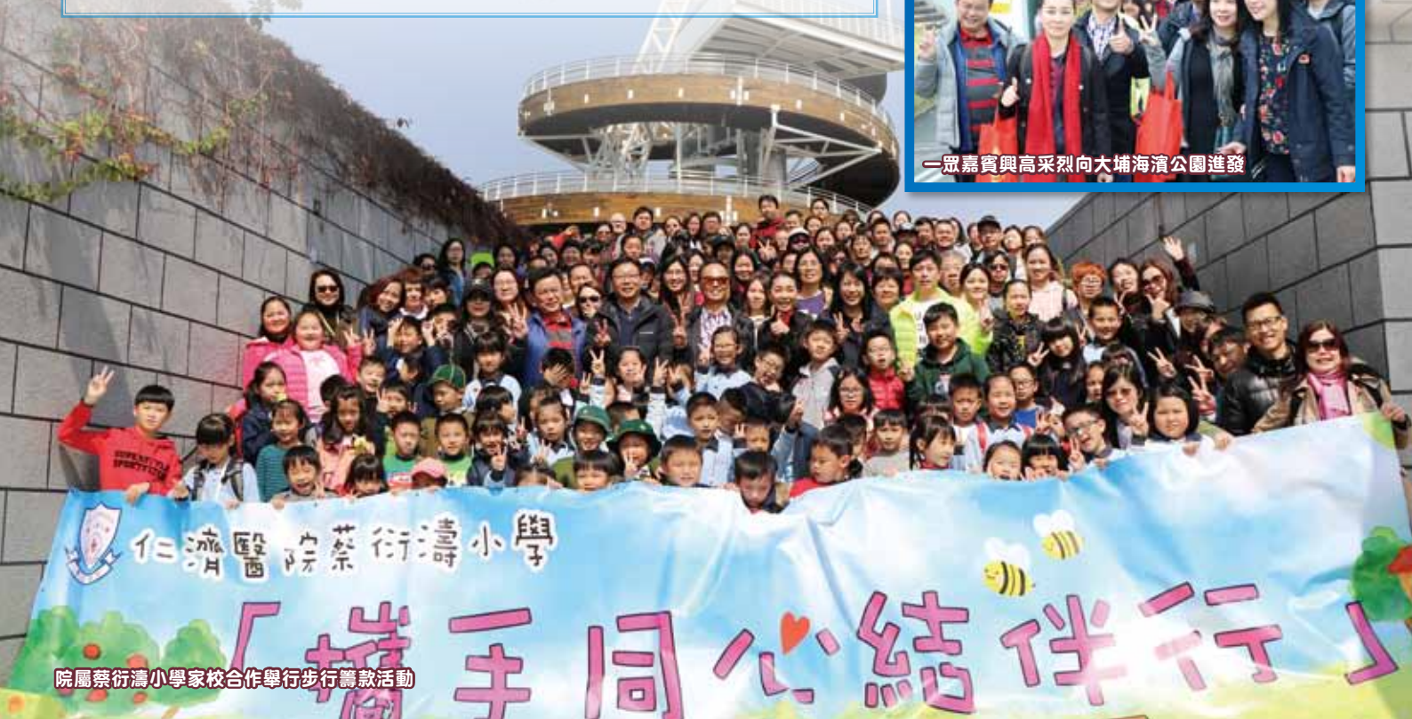
院屬蔡衍濤小學學校合作舉行步行籌款活動