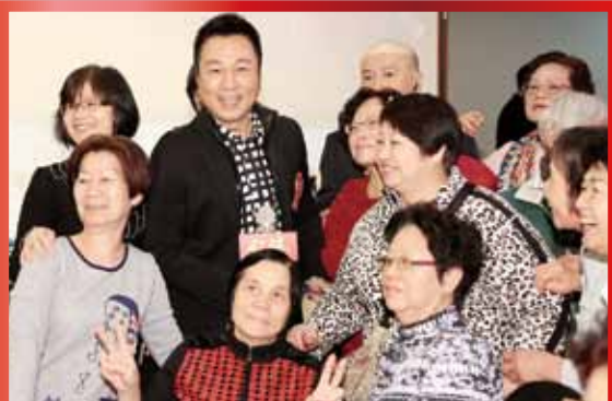
當晚星光熠熠，「仁濟慈善大使」黎耀祥及薛家燕極受義工們的歡迎，爭相與他們合照