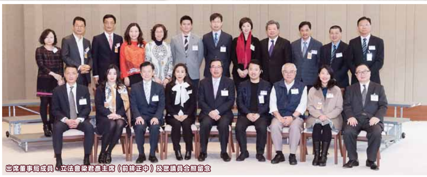
出席董事局成員、立法會梁君彥主席（前排正中）及眾議員合照留念

立法會為加強與各慈善團體的聯繫及加深了解其運作，特別舉行周年茶聚，並邀請各大善團出席，藉此相聚聯誼。立法會梁君彥主席與出席議員均表示，茶聚讓議員與各慈善機構在輕鬆愉快的氣氛下會面，並就共同關注的事項交換意見，有助建立更緊密的合作關係。