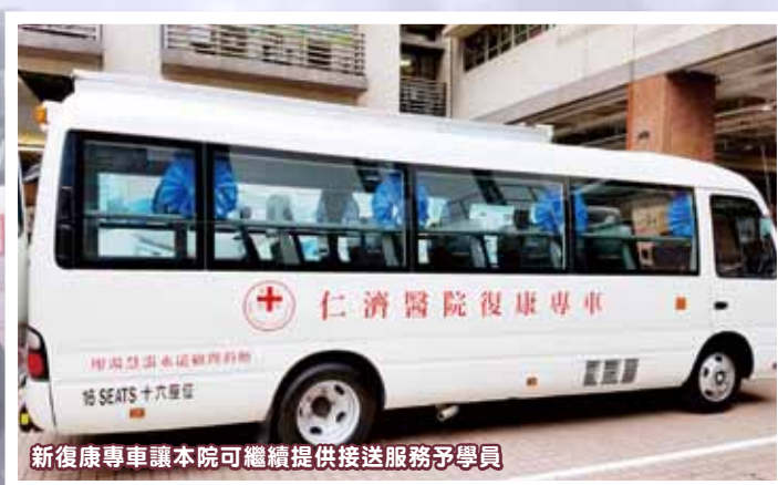
新復康專車讓本院可繼續提供接送服務予學員