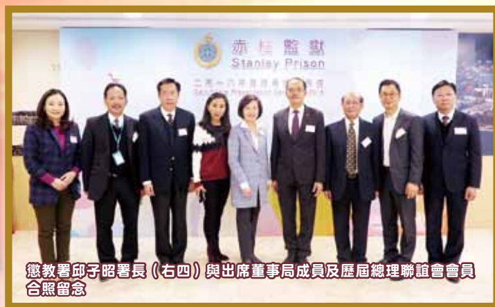
懲教署邱子昭署長（右四）與出席董事局成員及歷屆總理聯誼會會員合照留念