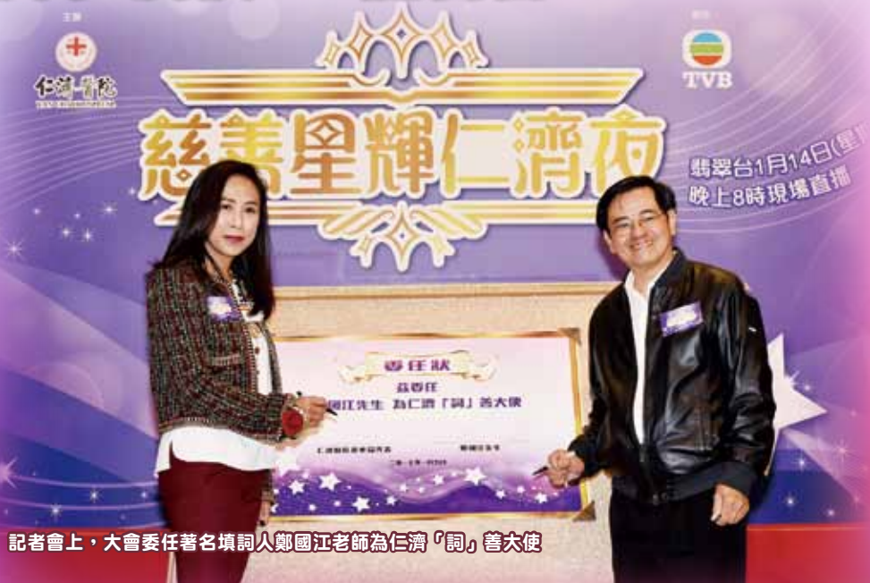
記者會上，大會委任著名填詞人鄭國江老師為仁濟「詞」善大使

為隆重其事，仁濟與無綫電視假荃灣廣場舉行記者會公佈晚會詳情。會上，仁濟醫院董事局籌募委員會主席嚴徐玉珊女士委任詞壇大師鄭國江老師為仁濟「詞」善大使，寓意透過其歌詞彰顯愛心。有見及此，鄭國江老師更為邁向仁濟50周年的盛事，重新填上以「仁」為大綱的歌詞，藉以呼籲廣大善長為善最樂、共襄善舉，為仁濟出一分力。