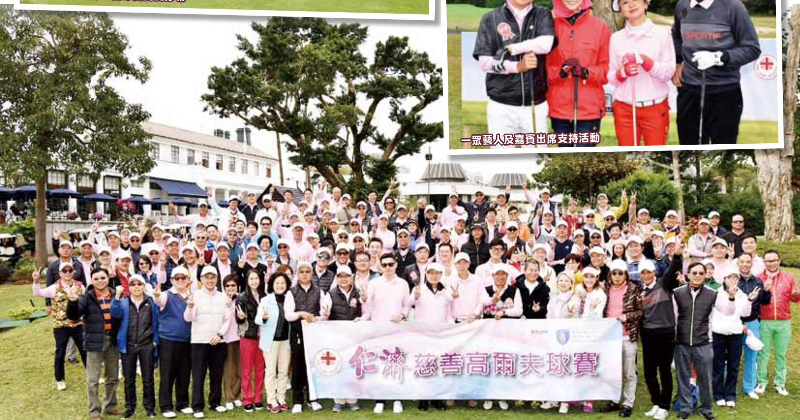
全體嘉賓及一眾高球愛好者於開球禮後合照留念