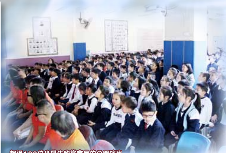
超過100位小學生欣賞會員的公開演出

此計劃共舉辦30節沙畫訓練班，分別與三間青少年中心或學校一起合作，包括香港基督教女青年會西環綜合社會服務處、新會商會學校及宣道會陳瑞芝紀念中學，並舉辦了兩場交流體驗工作坊及三場公開演出，超過300位青少年及公眾人士欣賞其演出。