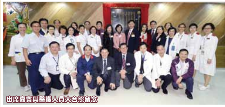
出席嘉賓與醫護人員大合照留念

(左起) 荃灣民政事務葉錦善專員、捐建人蘇陳偉香永遠顧問、主禮嘉賓食物及衛生局陳肇始副局長、醫院管理局梁栢賢行政總裁、嚴徐玉珊副主席及馮卓能副主席一同主持揭幕儀式