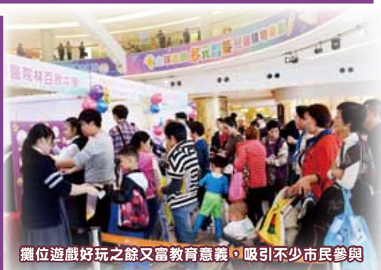
攤位遊戲好玩之餘又富教育意義，吸引不少市民參與