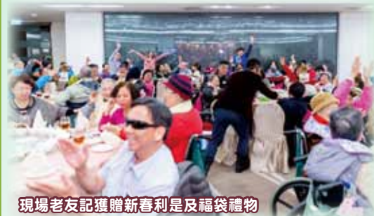
現場老友記獲贈新春利是及福袋禮物