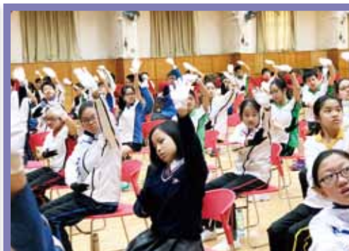
院屬王華湘中學學生為坐式太極操大匯演環節進行特訓。