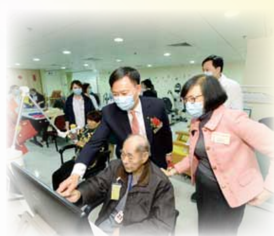
陳肇始副局長及梁栢賢行政總裁於儀式後參觀日間醫院，了解復康照顧服務及設施

醫院有一隊專業的團隊專責提供服務，團隊成員包括老人科醫生、護士、物理治療師、職業治療師及醫務社工等，分別提供專業護理及照顧技巧、活動能力評估及家居運動建議、自理及認知評估、家居評估等服務，為長者提供良好的社區延續支援醫療服務。