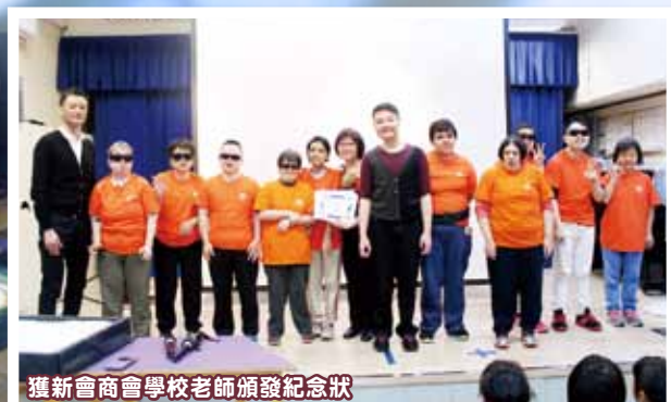
獲新會商會學校老師頒發紀念狀