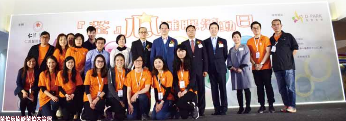
主辦單位及協辦單位大合照