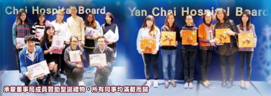
承蒙董事局成員贊助聖誕禮物，所有同事均滿載而歸