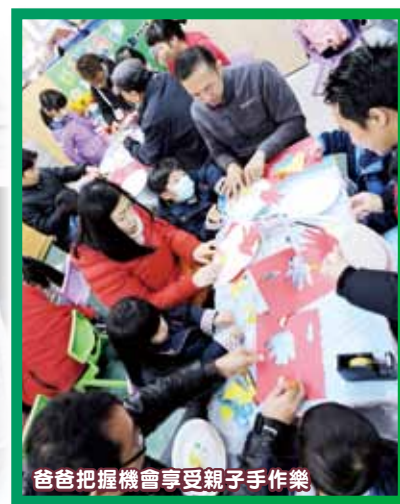
爸爸把握機會享受親子手作樂