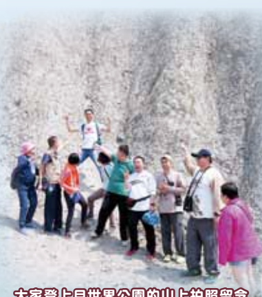
大家登上月世界公園的山上拍照留念