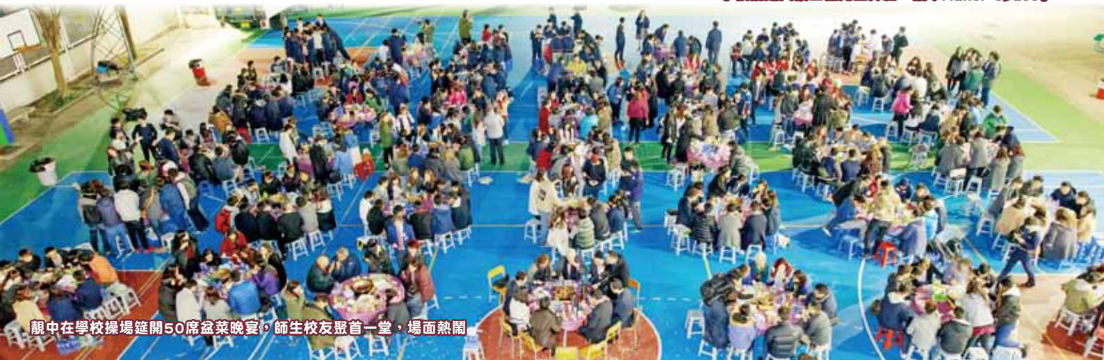
靚中在學校操場筵開50席盆菜晚宴，師生校友聚首一堂，場面熱鬧