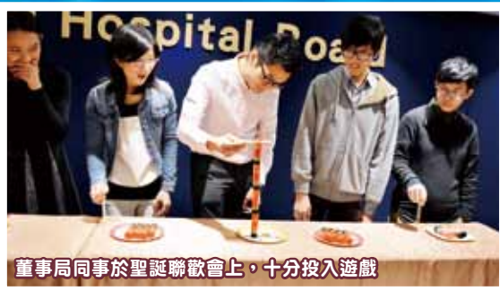
董事局同事於聖誕聯歡會上，十分投入遊戲