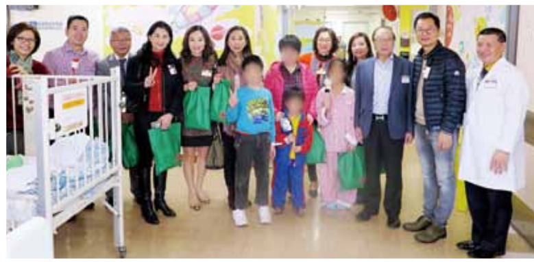
董事局成員帶同禮物到仁濟醫院進行探訪，為病人及當值同事加油打氣

眾董事局成員在聖誕佳節為住院病人送上溫暖及關懷，安排了親善探訪，送上聖誕禮物，讓他們一同感受節日氣氛。在隨後的董事局聖誕聯歡會上，董事局成員與員工一起聚餐及玩遊戲，共度歡樂聖誕。