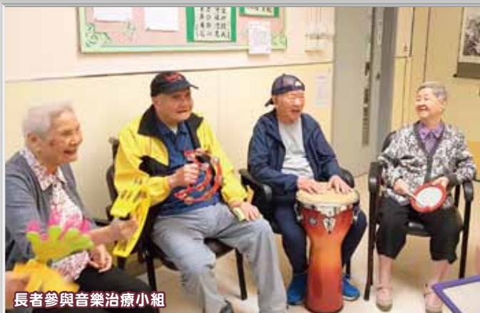
長者參與音樂治療小組