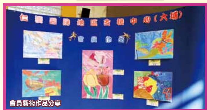
會員藝術作品分享