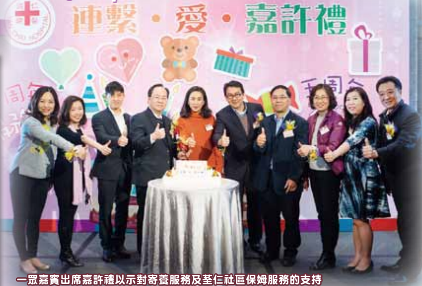
一眾嘉賓出席嘉許禮以示對寄養服務及荃仁社區保姆服務的支持