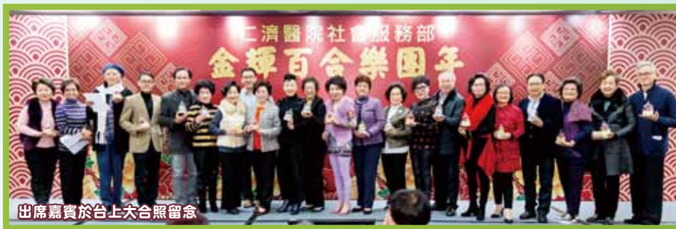
出席嘉賓於台上大合照留念