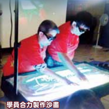
學員合力製作沙畫