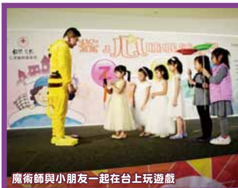
魔術師與小朋友一起在台上玩遊戲