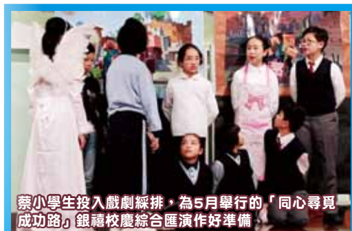
蔡小學生投入戲劇綵排，為5月舉行的「同心尋覓成功路」銀禧校慶綜合匯演作好準備