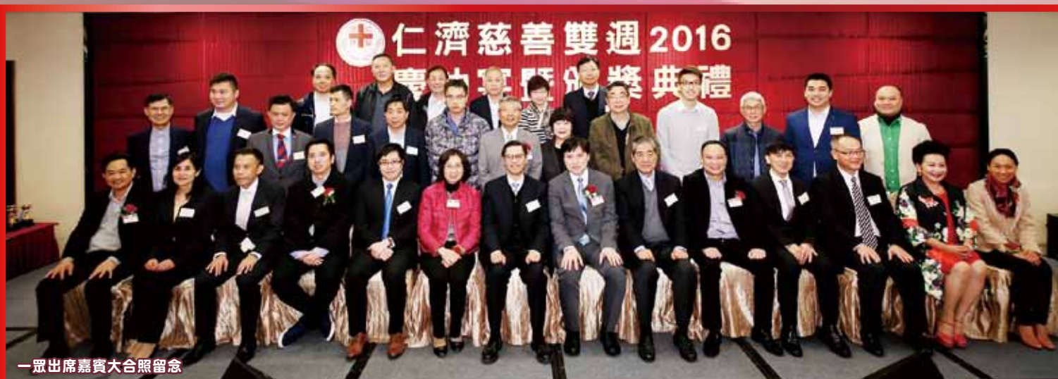
一眾出席嘉賓大合照留念