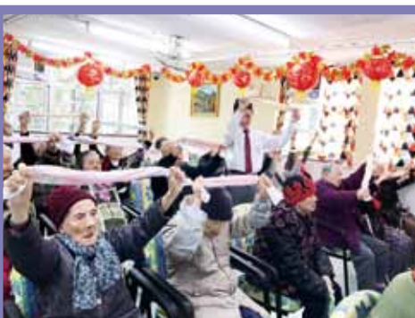
院屬董之英紀念中學學生探訪仁濟醫院李衛少琦安老院，與長者齊齊做毛巾操。