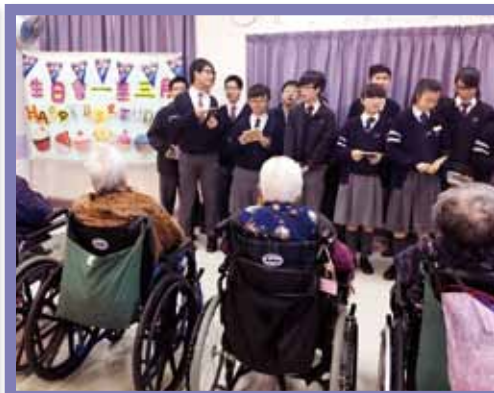
院屬林百欣中學學生為仁濟護養院 (荃灣) 長者舉行生日會。