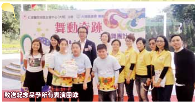
致送紀念品予所有表演團隊