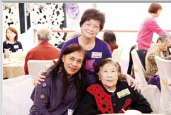
「關愛大使」義工陪同長者參加活動

卓智中心於2016年10月份起成為社會福利署「長者社區照顧服務券試驗計劃」的認可服務單位，以配合政府居家安老服務政策，讓更多服務使用者受惠。