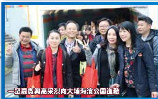
一眾嘉賓興高采烈向大埔海濱公園進發