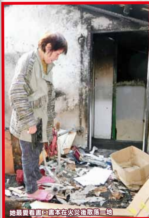
她最愛看書，書本在火災後散落一地

「仁濟緊急援助基金」助她添置基本家具，使其重建家園，對她而言，仁濟帶給她的不止是金錢，還有脈脈溫情。