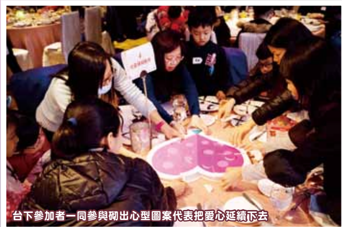
台下參加者一同參與砌出心型圖案代表把愛心延續下去