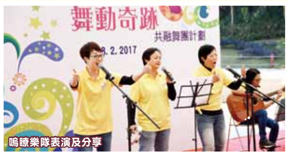
鳴瞭樂隊表演及分享

仁濟醫院地區支援中心（大埔）獲大埔區議會撥款於2016年7月份開始展開為期大半年的「舞動奇跡共融舞團」計劃。中心首先成立共融舞團，當中由18位會員或家屬組成，經過60小時的舞蹈訓練，發展他們在舞蹈律動方面的潛能與信心，更希望透過公開表演的機會，讓社區人士了解不同能力的殘疾人士的舞蹈才能，減少對他們的負面標籤，推動傷健共融。活動特別邀請了香港手語歌舞劇團及香港西區扶輪社匡晨輝學校映舞團，進行舞蹈互動和交流，令整個活動生色不少。