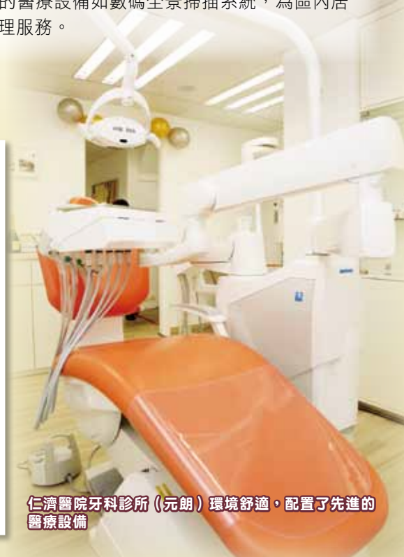
仁濟醫院牙科診所（元朗）環境舒適，配置了先進的醫療設備