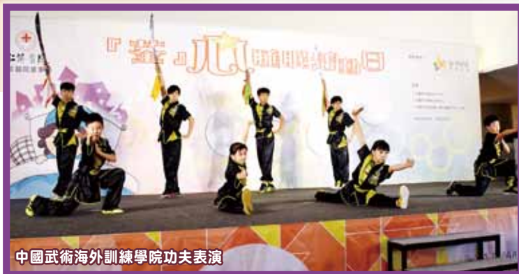
中國武術海外訓練學院功夫表演