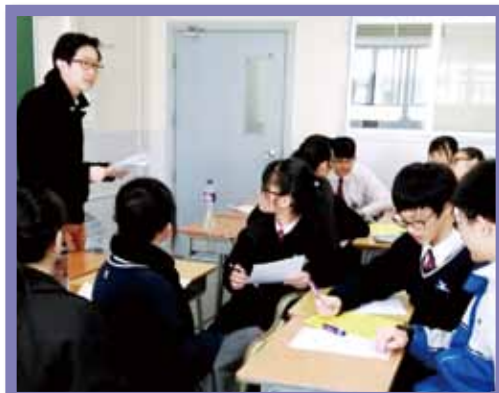
仁濟專業社工為學生舉行簡介會，讓他們了解長者需要及探訪注意事項。