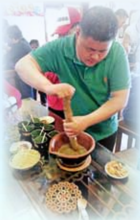
同心協力一起製作客家擂茶！

在四天三夜的行程中，參加者遊遍高雄及台南市多個景點，包括旗津半島、旗後砲台、六合夜市、十鼓文化村、七股鹽田、北門白色水晶教堂、月世界公園、美濃文化村、旗山車站、旗山老街、新崛江商場及國立科學工藝博物館等。活動讓殘疾會員能夠有機會與家人一起外遊，他們均希望本院能夠繼續再舉辦旅遊活動，讓他們可以增廣見聞及與家人相聚。