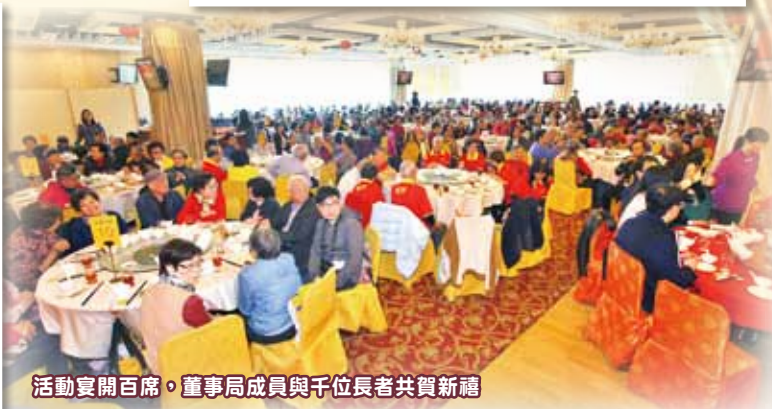
活動宴開百席，董事局成員與千位長者共賀新禧