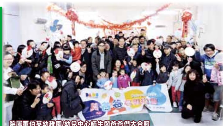
院屬董伯英幼稚園/幼兒中心師生與爸爸們大合照