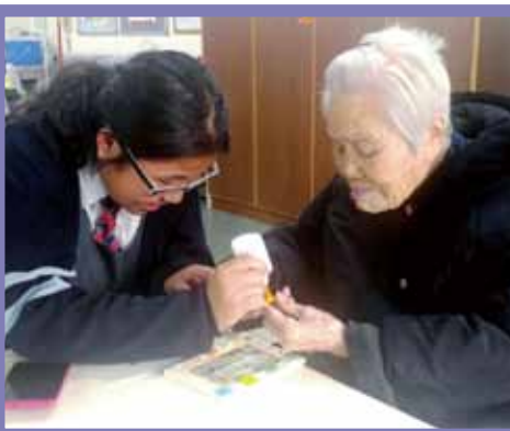
院屬林百欣中學學生協助長者製作馬賽克相架。