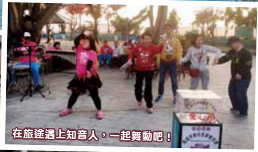
在旅途遇上知音人，一起舞蹈吧！