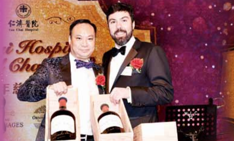
投得3支Double Magnums Chateau Lynch-Bages 2005的吳國榮總理不忘向捐出美酒的Mr. Jean-Charles Caze道謝