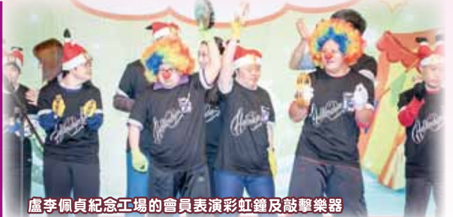
盧李佩貞紀念工場的會員表演彩虹鐘及敲擊樂器