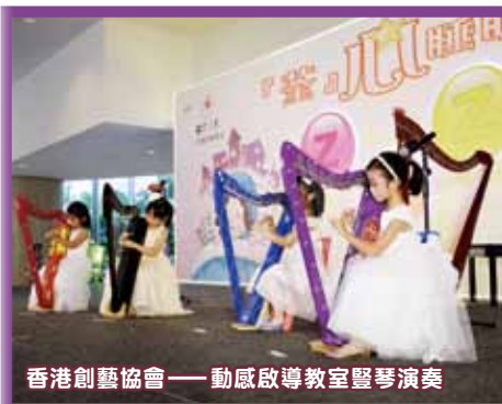
香港創藝協會——動感啟導教室豎琴演奏