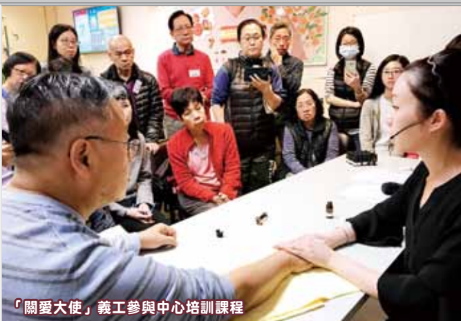
「關愛大使」義工參與中心培訓課程