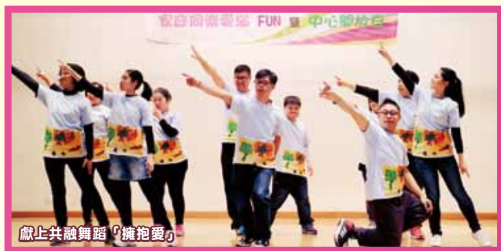
獻上共融舞蹈「擁抱愛」