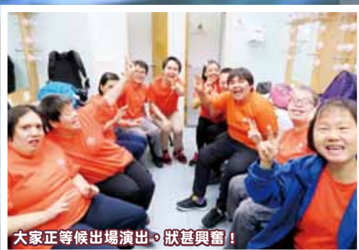
大家正等候出場演出，狀甚興奮！