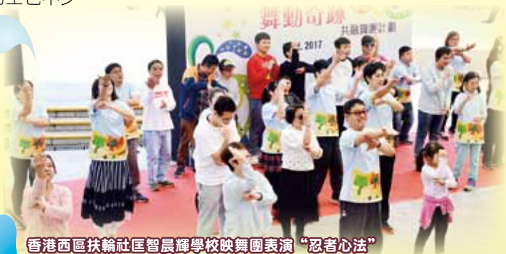
香港西區扶輪社匡晨輝學校映舞團表演「忍者心法」