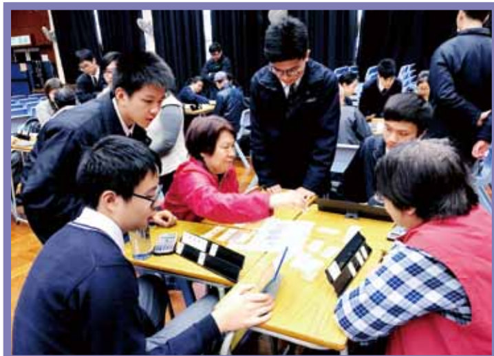
院屬第三中學學生教授長者認識魔力橋 (Rummikub) 數字牌遊戲，並舉行「長幼魔力橋大賽」。

此外，本院將於2017年5月15日上午在院屬林百欣中學舉行「仁濟跨代共融義工服務計劃」聯校展覽暨分享會。各校學生會將一年以來的探訪活動花絮及感受等，以展覽及攤位形式呈現，與其他師生及公眾分享。同場更會有長者、中學生及幼兒共演坐式太極操，讓大家一起感受長幼共融氣氛。