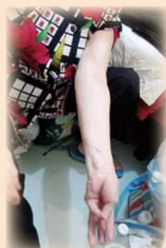
手腕和手臂兩處一直腫脹。張婆婆說整條左臂都感痠痛和無力。

可是，在2016年10月起，僱主不再向她發放每月數千元的病假薪金，加上一對子女亦各有家庭負擔，無力再給予經濟上的支援，她的生活隨即出現困難。