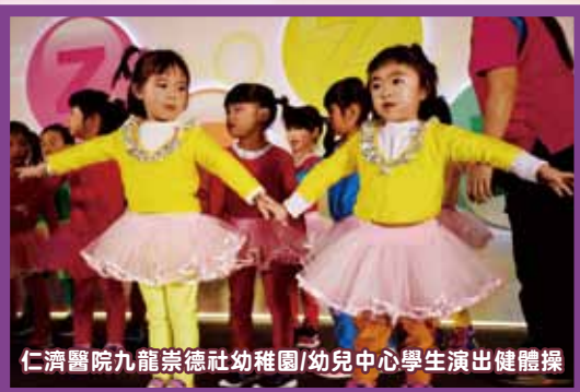
仁濟醫院九龍崇德社幼稚園/幼兒中心學生演出健體操

為將此健康訊息傳遞予更多公眾人士，並進一步為區內的兒童、青少年及其照顧者提供與睡眠有關的健康資訊。本院特舉辦上述計劃之壓軸活動「『荃』心睡眠」活動日。活動當天節目豐富，包括健康講座、健康諮詢、話劇、功夫、小朋友體操、豎琴演奏及魔術表演等。