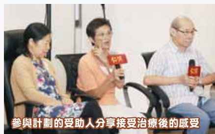
參與計劃的受助人分享接受治療後的感受

計劃推出後，收到不少市民查詢及申請，仁濟與「睛彩慈善基金」早前舉行中期發佈會，截至2016年5月底，計劃已協助了42位受助人進行治療，當中33個個案已經完成治療，其中不少病友因參與此計劃得以康復或被轉介作更適當的跟進。計劃受助人更親身分享他們獲治療後的感受。另外，發佈會亦邀請到著名藝人羅蘭女士及胡楓先生出席活動，一同分享護眼心得，並接受簡單眼部測試，透過他們的呼籲，希望提升市民大眾對黃斑病的認識。