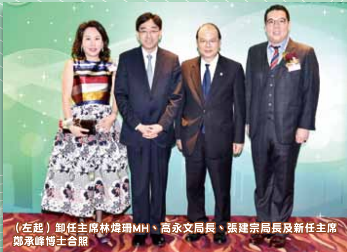
(左起) 卸任主席林煒珊MH、高永文局長、張建宗局長及新任主席鄭承峰博士合照