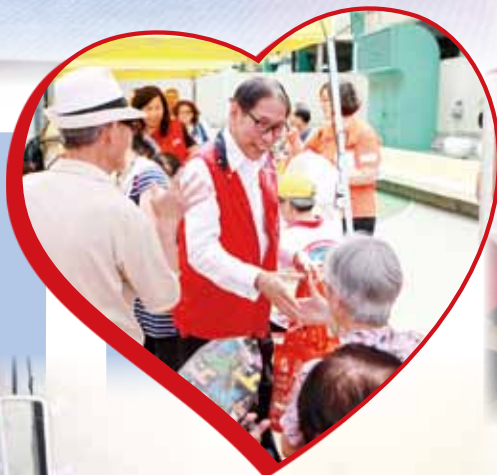
梁智鴻醫生向老友記送上愛心福袋