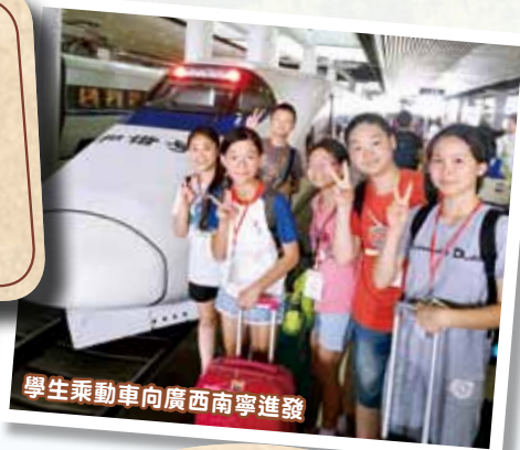
學生乘動車向廣西南寧進發

我很開心參加「一帶一路」旅學團，可以認識不同少數民族的特色與文化，獲益良多，非常留戀。