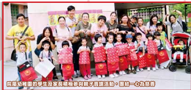
院屬幼稚園的學生及家長積極參與親子賣旗活動，團結一心為慈善