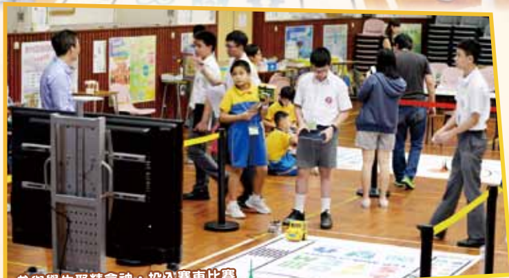
參與學生聚精會神，投入賽車比賽