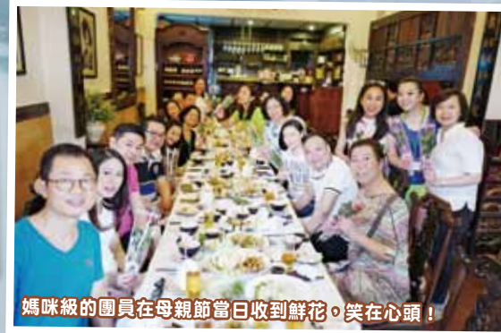
媽咪級的團員在母親節當日收到鮮花。笑在心頭！