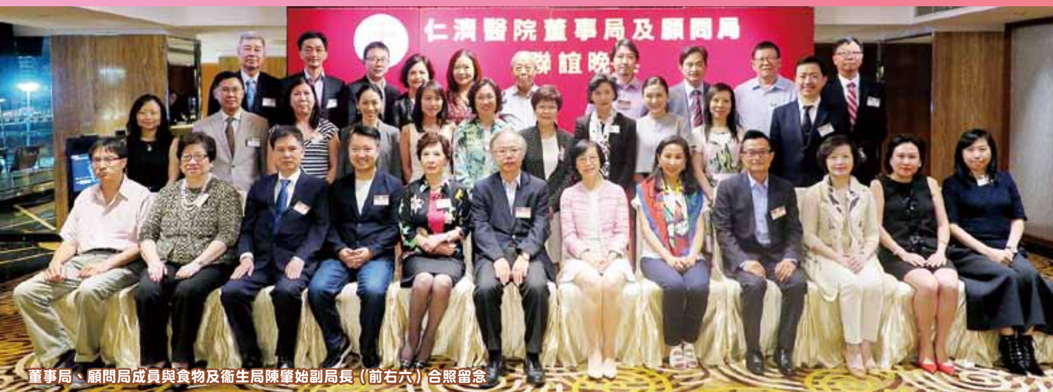
董事局、顧問局成員與食物及衛生局陳肇始副局長（前右六）合照留念

董 事局與顧問局每年均會舉行聯歡晚宴，藉此加強董事局與顧問局之間的聯繫。林焯珊永遠顧問當晚正式加入顧問局並出任第三副主席。食物及衛生局陳肇始副局長當晚亦有出席晚宴，與一眾顧問及總理交流服務社會的心得，並大力推廣器官捐贈計劃，眾人紛表支持，均願意加入捐贈行列。晚宴上，大家難得相聚，把握歡聚時刻，一起獻唱名曲，把酒言歡，氣氛愉快。