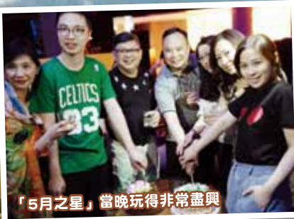
「5月之星」當晚玩得非常盡興