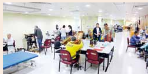
「長者日間醫院」提供更大活動空間及加添不少新電子儀器，令更多有需要的長者病人進行復康治療時增添不少樂趣