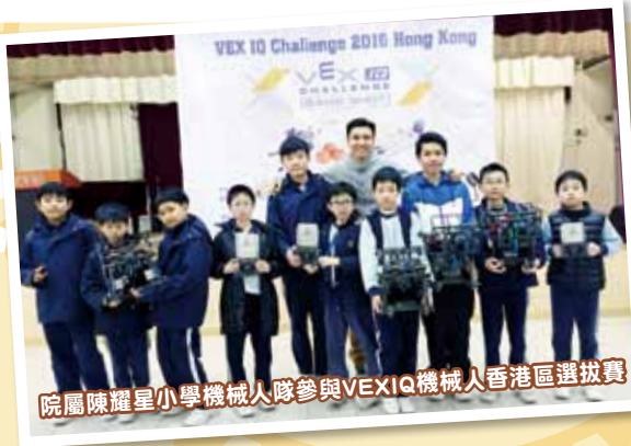
院屬陳耀星小學機械人隊參與VEXIQ機械人香港區選拔賽