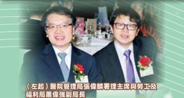
(左起) 醫院管理局張偉麟署理主席與勞工及福利局蕭偉強副局長