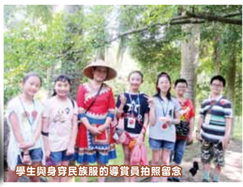
學生與身穿民族服的導賞員拍照留念

我覺得這個旅學團整體來說還不錯，而美中不足就是地方距離太遠，車程太久。令我最難忘的是參觀左石石林景區，那裏有位友善的黑壯族姑娘與我們談及她的家鄉，還邀請我們明年3月到她的家鄉一起唱山歌呢！