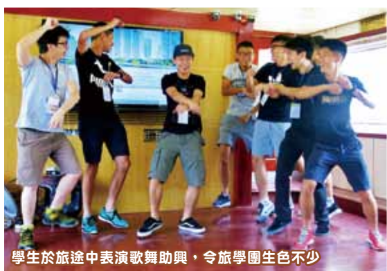
學生於旅途中表演歌舞助興，令旅學團生色不少

此次旅學團除了邀請著名學者廖井丹教授講解廣西與「一帶一路」的關係外，更讓我們到中越邊境友誼關參觀。站在關樓上，看著遠處越南的風景，我深深地體會到廣西與東亞國家的緊密關係。還有，廣西民族大學涵蓋了多種東亞小語種，培養許多小語種的精英，在「一帶一路」中佔著相當重要的位置。