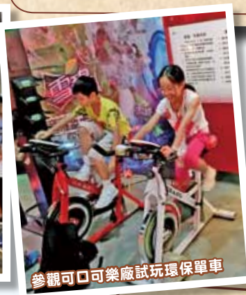
參觀可口可樂廠試玩環保單車