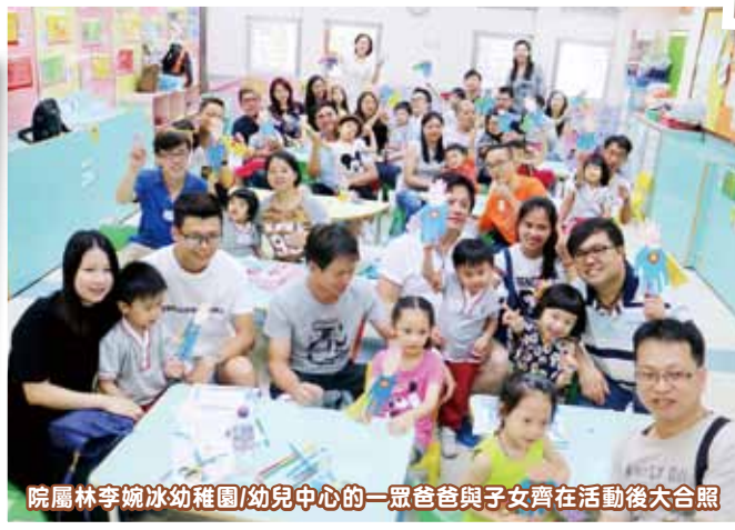
院屬林李婉冰幼稚園/幼兒中心的一眾爸爸與子女齊在活動後大合照