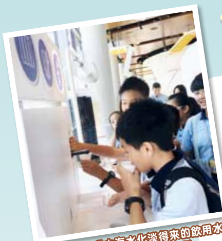
學生齊齊品嚐由海水化淡得來的飲用水，原來味道與一般自來水沒有分別

香港首個自給自足的污泥處理設施T·PARK「源·區」已於2016年5月中正式開幕，而其環境教育中心亦於6月29日開放予公眾人士及團體參觀。仁濟於7月2日上午安排了一節導賞團，讓屬校教師及校園小记者率先參觀T·PARK「源·區」。各參加者對T·PARK「源·區」內的先進環保系統及優美綠化景區大感新奇，加上專業導賞員的講解及實地視察，讓大家更了解「轉廢為能」的環保理念。