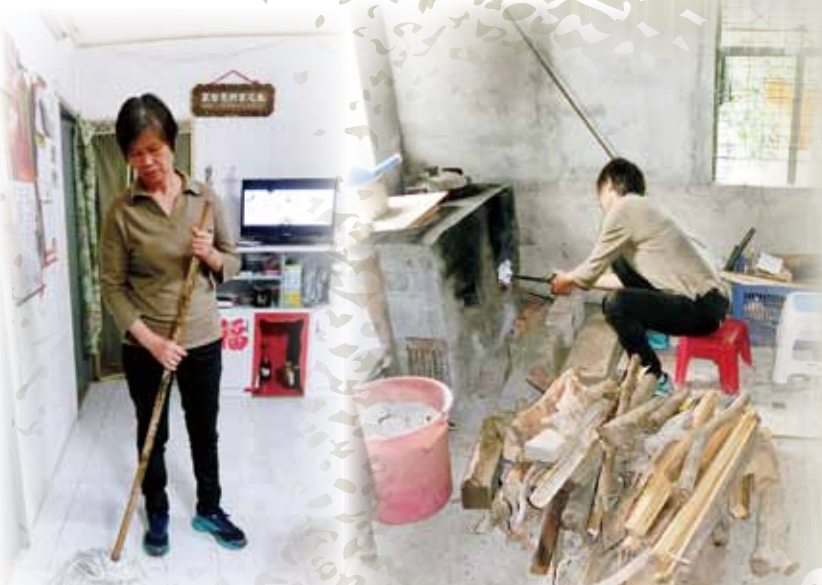
簡單的拖地動作，已令阿開腰痛難當。為了節省金錢，也不理得柴火煮食時的濃煙。

我本身是做清潔工的，到了第6年，萬萬沒想到自己會因地上的一塊紙皮而滑倒，更因而扭傷了腰，引致椎間盤突出。不說不知，受傷後的我，外表看起來好像沒有什麼毛病，但實情是無論走路或是坐臥，短短十多分鐘，我即會腰痛難當，徹夜難眠。在飽受傷痛的折磨和失去收入的擔憂下，我的情緒很波動，亦經常無故哭泣，需求診心理科。有幸得到「基金」給予我生活援助，暫時紓解了我們一家的困境。