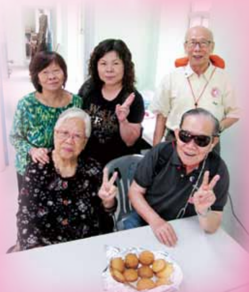
參加者一起製作香草曲奇，分享美味成果