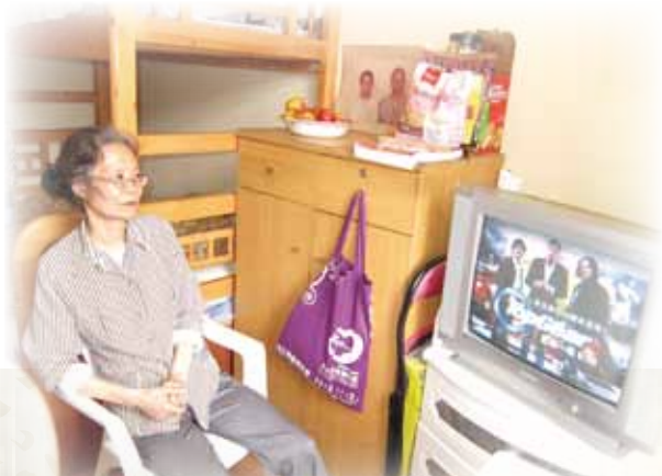
頸椎受傷令阿環舉步為艱，很少外出，看電視便是她的最大娛樂

健康問題令我困擾不已，僱主在今年初停止發放病假薪金，對沒甚積蓄的我，慶幸得到「基金」及時提供了生活和租金援助，助我應付這突如其來的經濟困局。