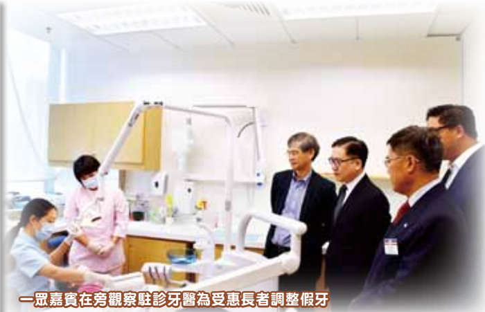
一眾嘉賓在旁觀察駐診牙醫為受惠長者調整假牙