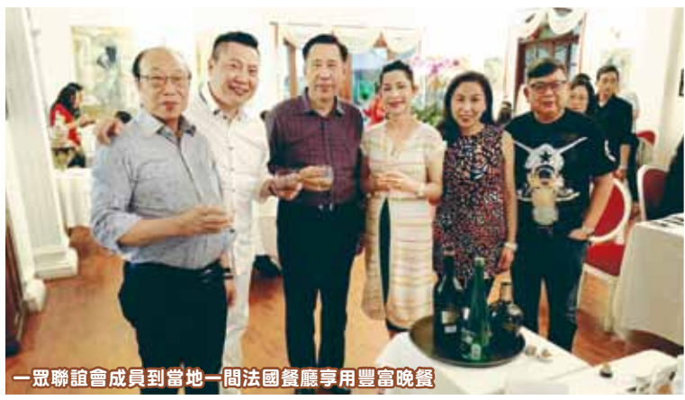
一眾聯誼會成員到當地一間法國餐廳享用豐富晚餐