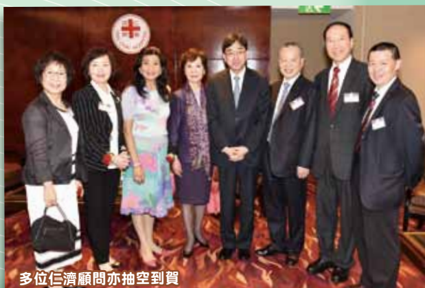
多位仁濟顧問亦抽空到賀