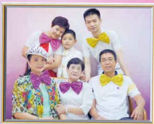
長者與家人悉心打扮。留下珍貴回憶

回顧籌辦這三個活動，長者都需要一些鼓勵和勇氣去參與，例如在活動報名時，有長者在未問家人之前就代回答沒有空參與，中心同事會再鼓勵長者嘗試主動去與家人分享活動。原來長者只要願意踏出一小步，主動邀請家人參與，家人都會很樂意參加，甚至亦有家人是專誠向公司請假出席活動。家人這一份關心和重視，對長者來說很重要，所以在此我們鼓勵長者勇於行多一步，向家人講出自己心中的說話，相信家人會十分樂意聆聽的。