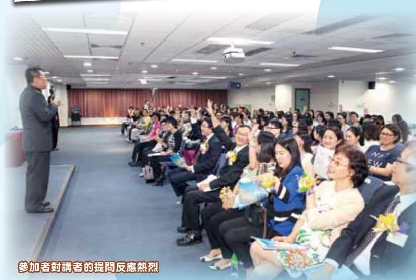
參加者對講者的提問反應熱烈