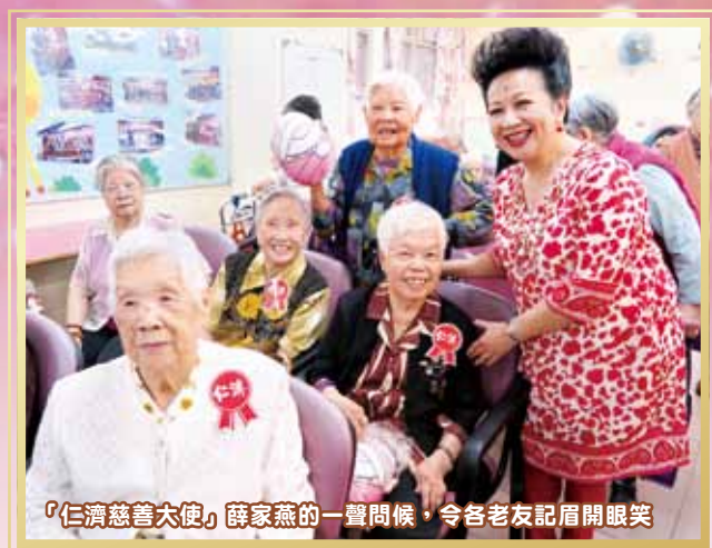
「仁濟慈善大使」薛家燕的一聲問候，令各老友記眉開眼笑