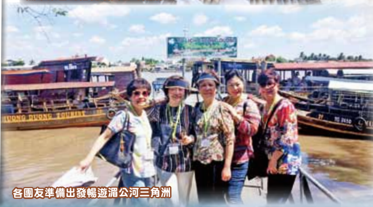
各團友準備出發暢遊湄公河三角洲