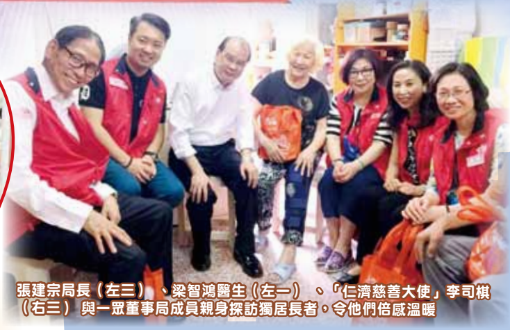
張建宗局長（左三）、梁智鴻醫生（左一）、「仁濟慈善大使」李司棋（右三）與一眾董事局成員親身探訪獨居長者，令他們倍感溫暖