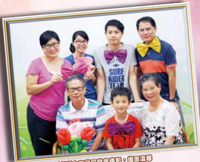
長者與兒媳及孫仔孫女三代同堂留倩影。場面溫馨