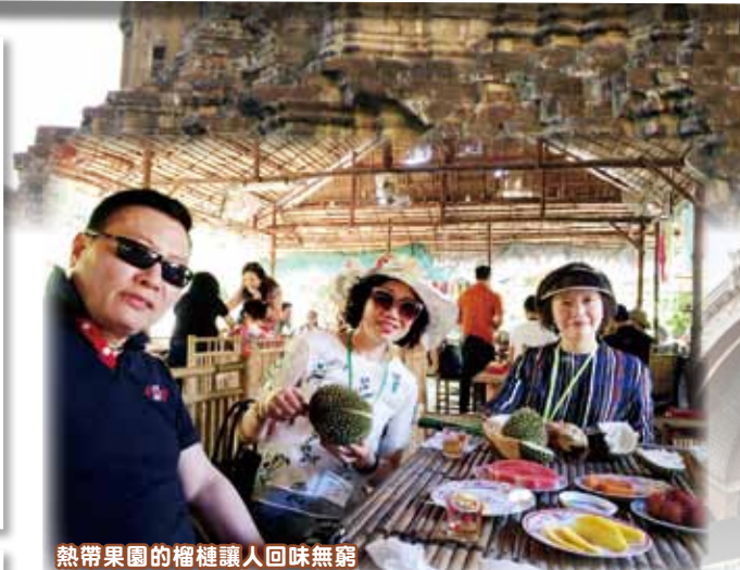
熱帶果園的榴槤讓人回味無窮