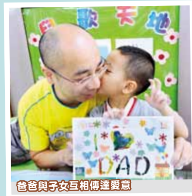
爸爸與子女互相傳達愛意