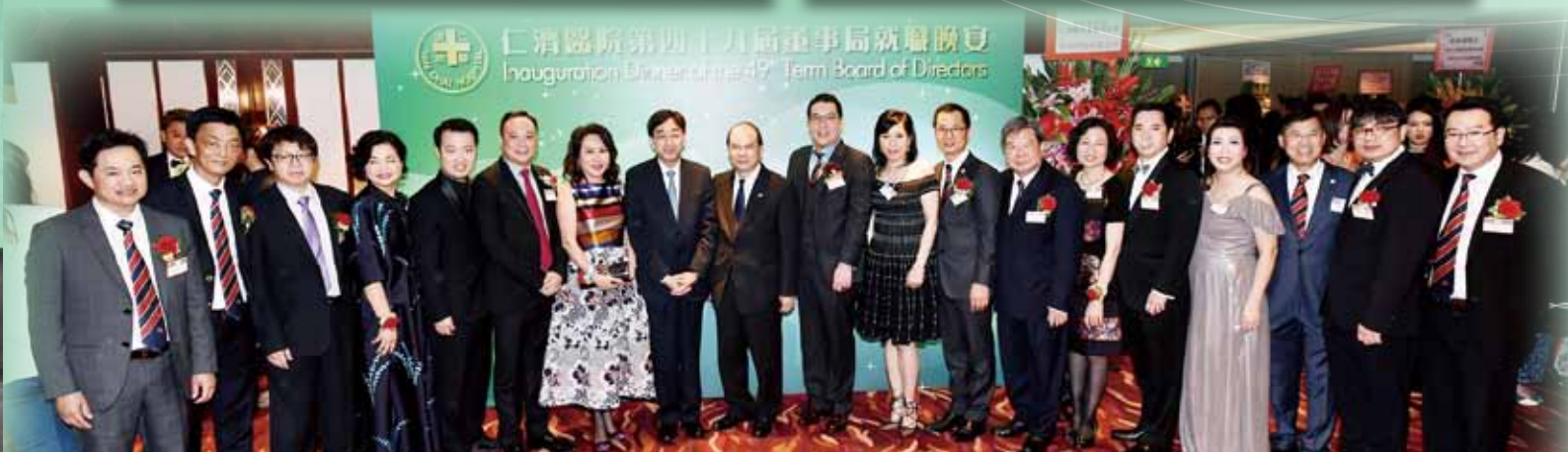
一眾董事局成員及顧問局委員與主禮嘉賓勞工及福利局張建宗局長(左九)、食物及衛生局高永文局長(左八)及勞工及福利局蕭偉強副局長(左三)合照