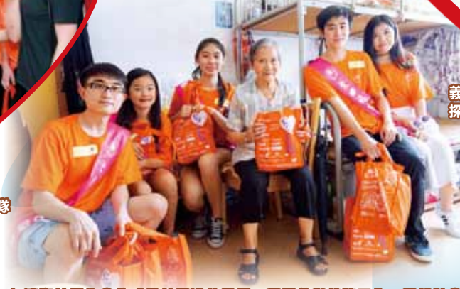
仁濟海外學生會的成員趁回港放暑假，積極參與義務工作，回饋社會