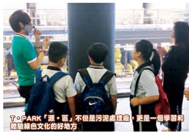
T·PARK「源·區」不但是污泥處理廠，更是一個學習和體驗綠色文化的好地方