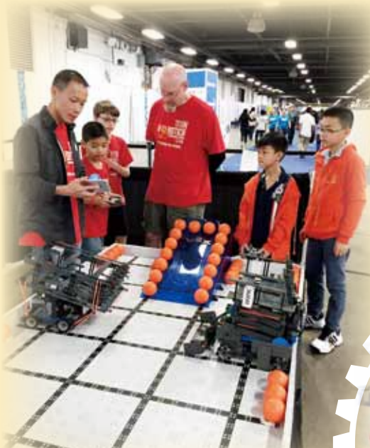
學生把握機會，與新加坡隊伍進行友誼賽

是次比賽一連多天，參賽學生需要透過控制自行設計及組裝的機械人進行多項指令執行的挑戰賽。經過三輪專家評審面試後，兩位同學在眾多隊伍之中脫穎而出，贏得創意大獎（Create Award），是歷屆首支香港代表隊於小學組別中獲得國際獎項！他們透過此次難得的機會不但拓闊科技視野，還認識了一班來自世界各地愛好科技的朋友，彼此切磋創作科技心得。今次比賽共有超過一千隊來自世界各國的隊伍參加，更獲健力士世界紀錄大全認證為「最多隊伍參與的機械人賽事」。