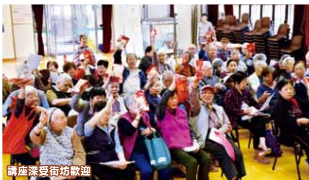
講座深受街坊歡迎