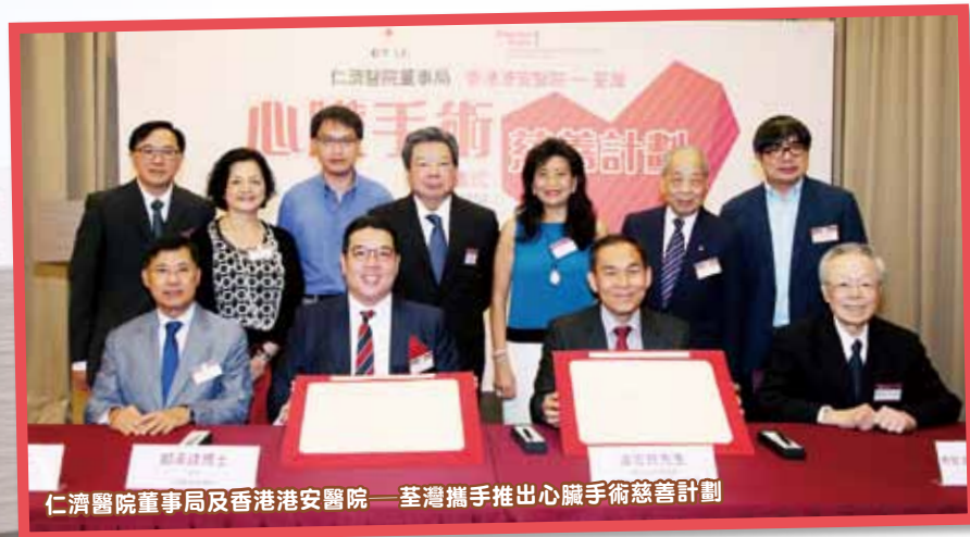
仁濟醫院董事局及香港港安醫院 — 荃灣攜手推出心臟手術慈善計劃