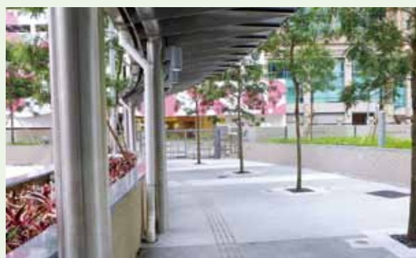
園景區及停車場的工程預計於2016年第四季完成