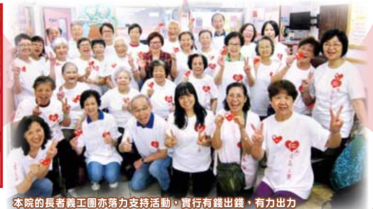
本院的長者義工團亦落力支持活動，實行有錢出錢，有力出力