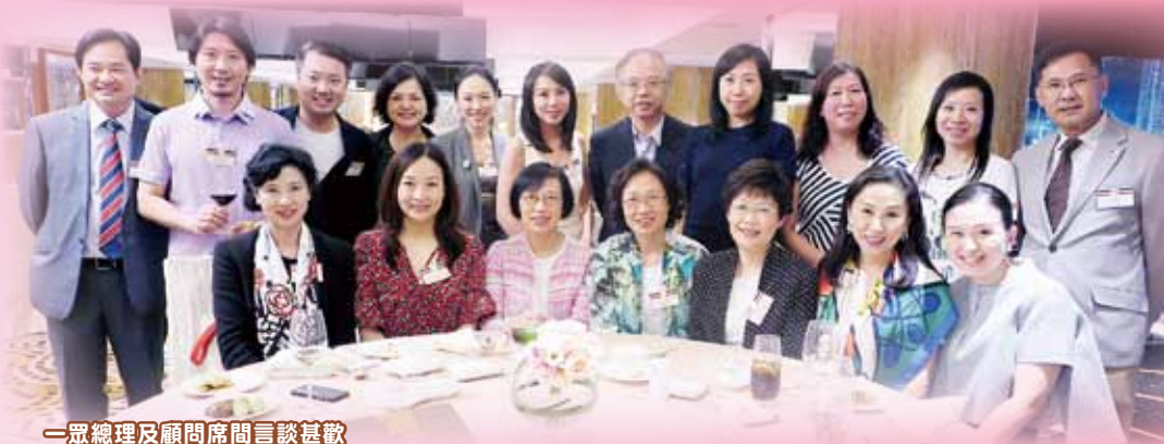
一眾總理及顧問席間言談甚歡