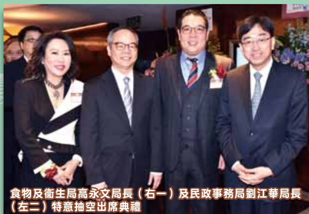
食物及衛生局高永文局長（右一）及民政事務局劉江華局長（左二）特意抽空出席典禮

新任主席鄭承峰博士亦發表其工作展望，承諾新一屆董事局必定竭盡所能，以務實的態度繼續發展仁濟各項善業。他期望在新一屆董事局的共同努力下，仁濟的服務能更上一層樓，為社會帶來裨益。