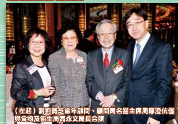
(左起) 劉劉寶芝當年顧問、顧問局名譽主席周厚澄伉儷與食物及衛生局高永文局長合照