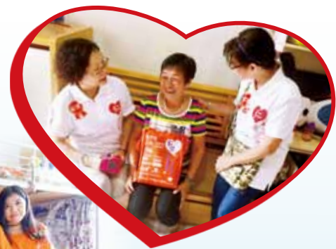
義工團中亦有長者義工，由老友記探訪老友記，互相問候