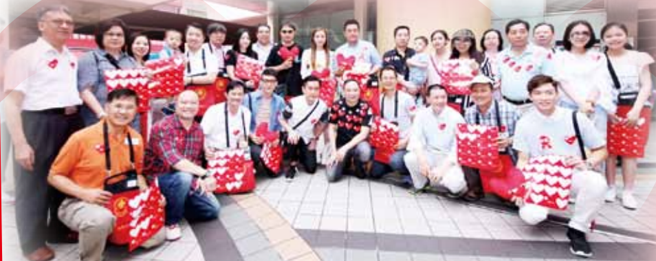
眾嘉賓及義工踴躍參與賣旗活動，並於賣旗活動後合照留念

賣 旗日當天，有超過5,000名來自全港各區學校、社福單位、政府部門、工商機構、宗教團體及義工機構的義工熱心參與活動，為「仁濟社會服務基金」籌得約170萬的善款。此外，董事局成員與「仁濟慈善大使」麥長青及一眾藝人包括范振鋒、李思欣、周志文及羅孝勇亦身體力行，親身走入荃灣區，一邊為義工們打氣、一邊參與賣旗，落力向市民募捐。廣大市民紛紛慷慨解囊，踴躍捐輸。