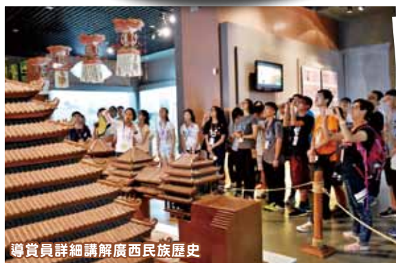
導賞員詳細講解廣西民族歷史

記得起始因為天氣炎熱，我每天只懂得抱怨和後悔。但短短四天三夜的行程，我有機會目睹壯麗的風景；從石景林欣賞自然景色，站在游船頂樓上飽覽山水及壁畫古蹟，了解廣西壯族細膩的文化；有幸欣賞到大自然的美，才懂得感恩旅學團令我有機會增廣見聞。