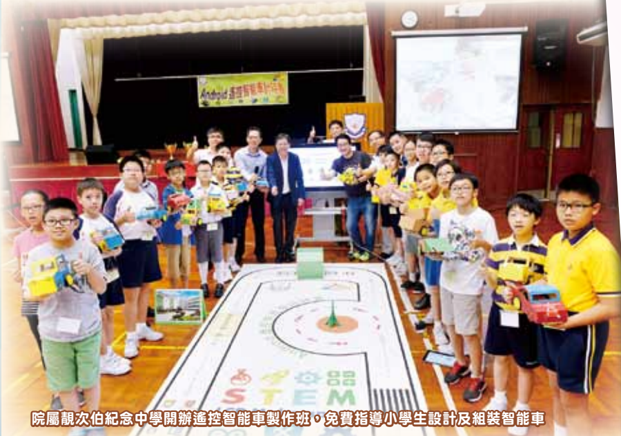
院屬靚次伯紀念中學開辦遙控智能車製作班，免費指導小學生設計及組裝智能車