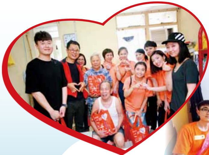
鄭斯堅總理（左三）帶領卡撒天嬌義工隊向長者送上親切的慰問，使長者倍感窩心