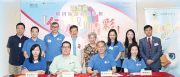
(前排左起) 仁濟醫院董事局黃美斯副主席、仁濟醫院董事局主席鄭承峰博士、睛彩慈善基金創會會長周伯展醫生太平紳士及睛彩慈善基金執行委員會主席楊鳳儀醫生及出席嘉賓於發佈會上合照