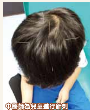
中醫師為兒童進行針刺

推拿治療是指醫者通過手法作用於人體的特定部位，以調節人體的生理、病理狀況來達到治療效果。臨床上推拿治療以嬰兒潤膚油或橄欖油作為治療介質，每次治療約20至30分鐘，除了複式手法較為複雜需要醫師執行以外，一般的手法都適合在患兒熟悉的地方進行，比如父母在家中進行。唯一要注意的是推拿和針藥一樣需先辨證選擇患兒適合的手法，並且隨證型、症狀調整推拿方式，否則可能弄巧反拙。