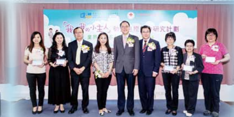
參與研究計劃的仁濟屬校與嘉賓們大合照