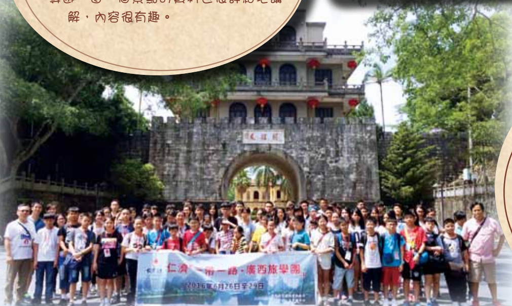
逾百仁濟中小學師生於2016年6月下旬前往廣西考察。在中越邊境友誼關前拍照留念

在這次交流團中，我學會了珍惜，學會了知足，也學會了獨立。我聽見在廣西裏有一名店主說他的收入很好，事實上他每天的收入只有十多元，但他已經很滿足。還有，在這次交流團中，我不能再依靠父母，要懂得照顧自己。我絕對不會忘記這次經歷！