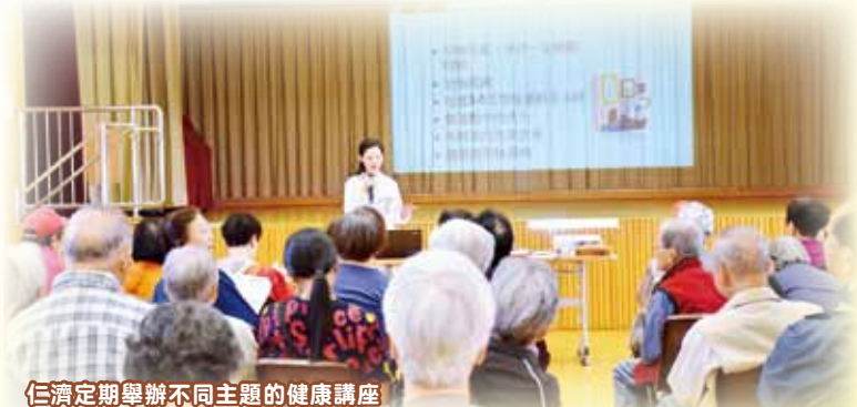
仁濟定期舉辦不同主題的健康講座