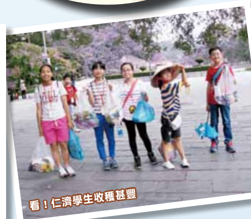
看！仁濟學生收穫甚豐