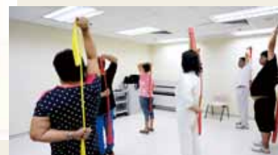
「綜合糖尿/內分泌及腎科服務」為糖尿及腎病患者提供多元化教育服務、培訓及治療