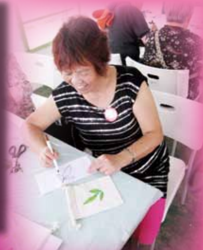
參加者聚精會神地製作環保托印