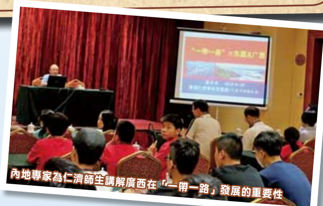
內地專家為仁濟師生講解廣西在「一帶一路」發展的重要性