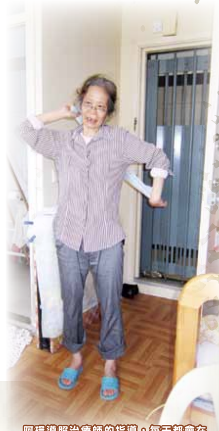
阿環遵照治療師的指導，每天都會在 家做運動，希望能加快康復