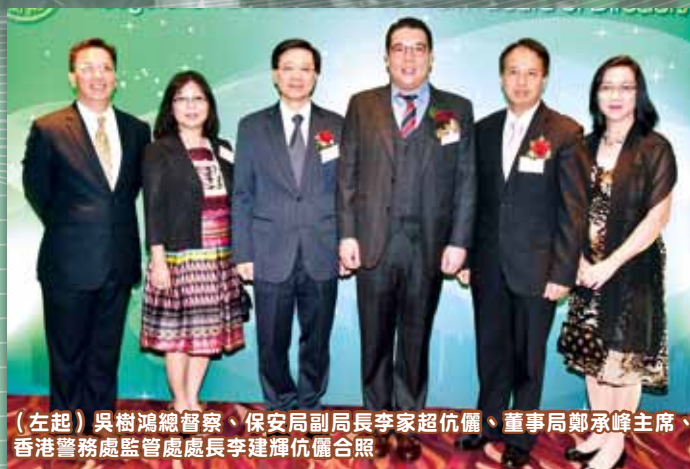
(左起) 吳樹鴻總督察、保安局副局長李家超伉儷、董事局鄭承峰主席、香港警務處監管處處長李建輝伉儷合照