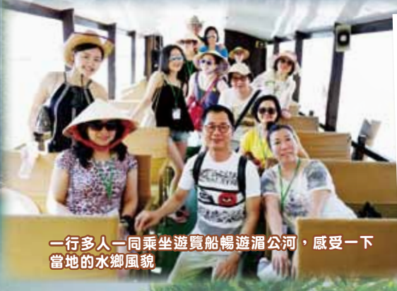
一行多人一同乘坐遊覽船暢遊湄公河，感受一下當地的水鄉風貌