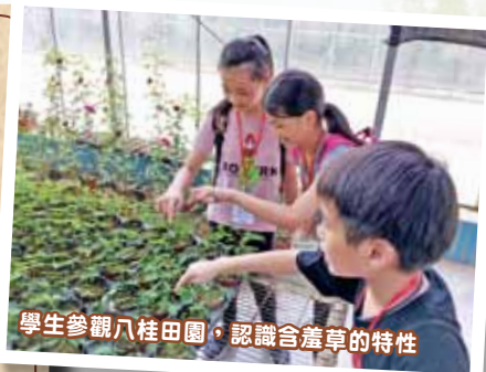
學生參觀八桂田園，認識蘆葦的特性

廣西是一個富民族色彩的地方。我記得在廣西民族博物館內，展示了壯族色彩豔麗的民族服飾，這些服飾都具有濃厚的地方色彩。另外，我們前往中越邊境參觀，透過聆聽導遊的講解，讓我了解到中國和越南的差別，同時亦明白到中國較越南發展得更快速的原因。