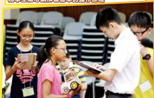
靚中學生擔任助教，指導小學生操作平板電腦及解答其查詢