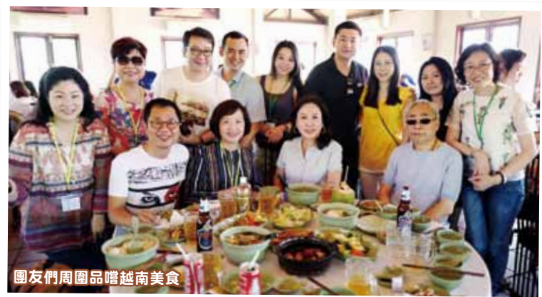
團友們周圍品嚐越南美食