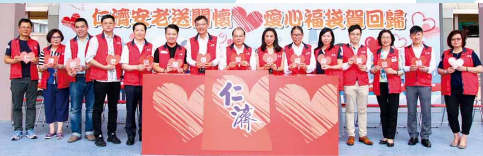
董事局成員及一眾嘉賓一同主持「愛心福袋」揭幕禮

今年，大會更特別安排了親子義工團參與活動，讓家長及小朋友共同領略關愛長者之情。探訪活動於一片溫馨笑聲中度過，在親切的問候下，每位老友記均笑逐顏開。