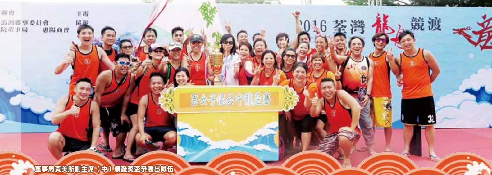
董事局黃美斯副主席（中）頒發獎盃予勝出隊伍