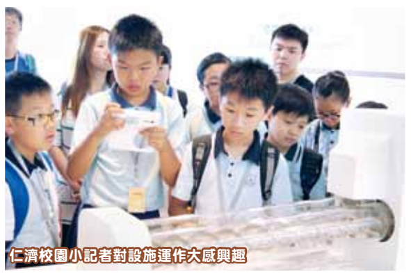
仁濟校園小记者對設施運作大感興趣