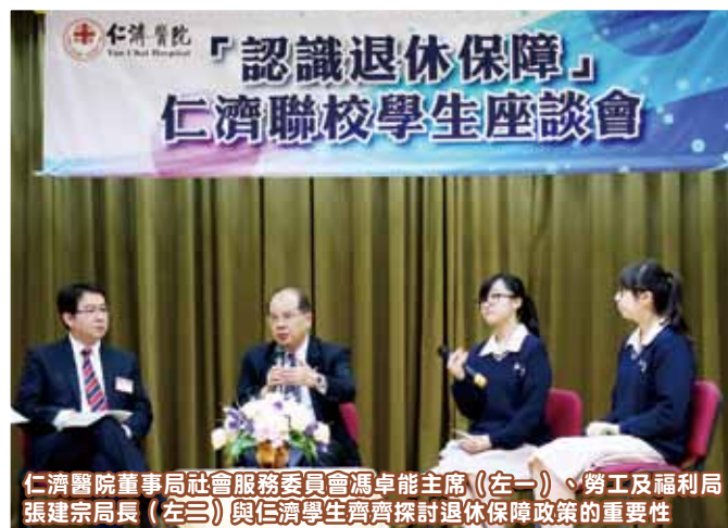
仁濟醫院董事局社會服務委員會馮卓能主席（左一）、勞工及福利局張建宗局長（左三）與仁濟學生齊齊探討退休保障政策的重要性