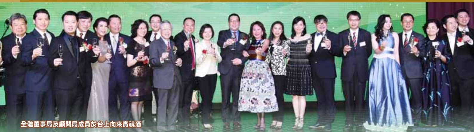
全體董事局及顧問局成員於台上向來賓祝酒