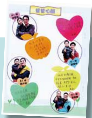
院屬方江輝幼稚園/幼兒中心為是次活動設計了一本紀念冊，分享各位爸爸的感言，供親子作紀念