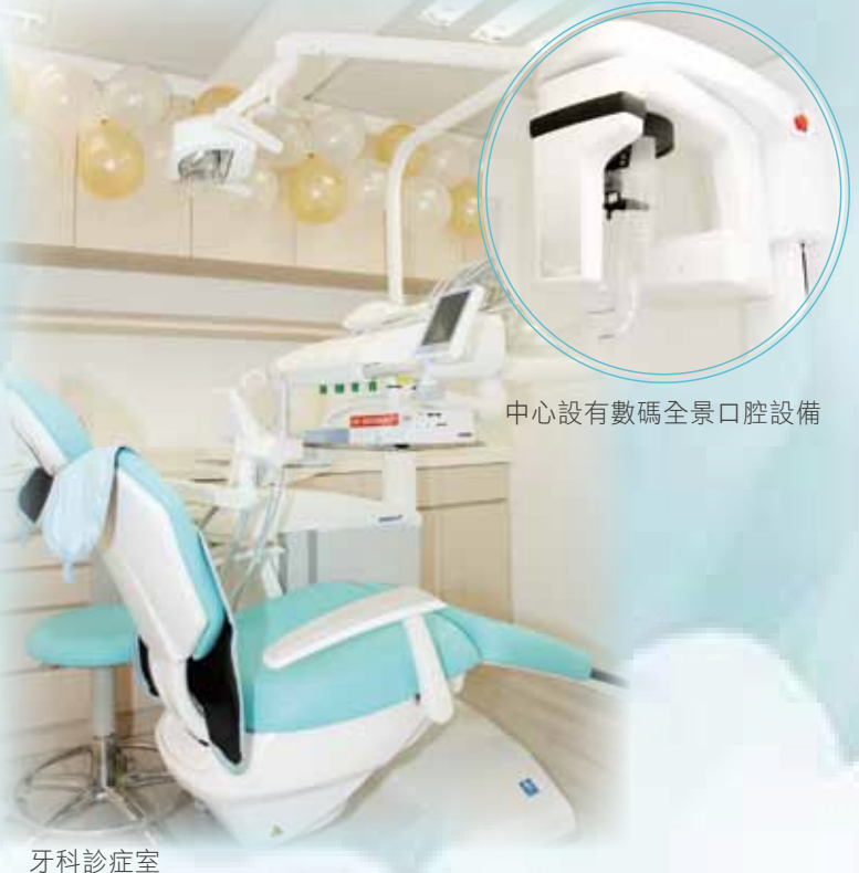
中心設有數碼全景口腔設備

中心內之牙科診症室設有數碼全景口腔設備及數碼X光掃描器，可提供更全面之牙科治療。中心亦已經申請成為關愛基金「長者牙科服務資助」項目認可之牙科診所及社會福利署綜合社會保障援助計劃認可之牙科服務機構，幫助社會上有需要之人士。