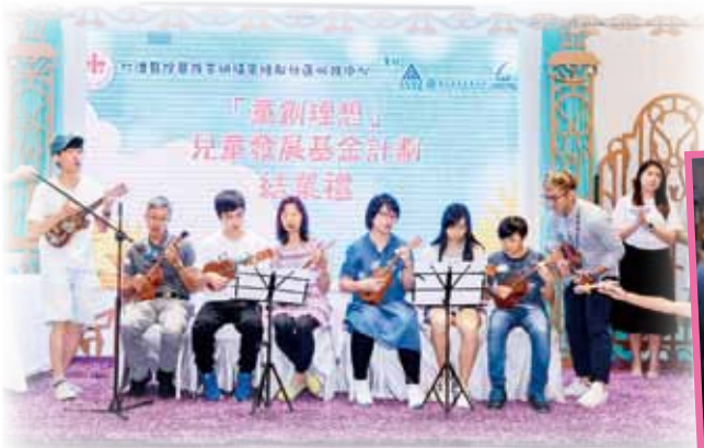
參加者及友師一起以夏威夷小結他合奏演唱