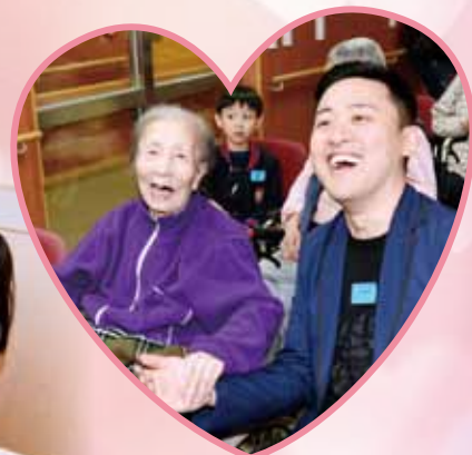
董事局總理們與長者 共渡歡樂時光