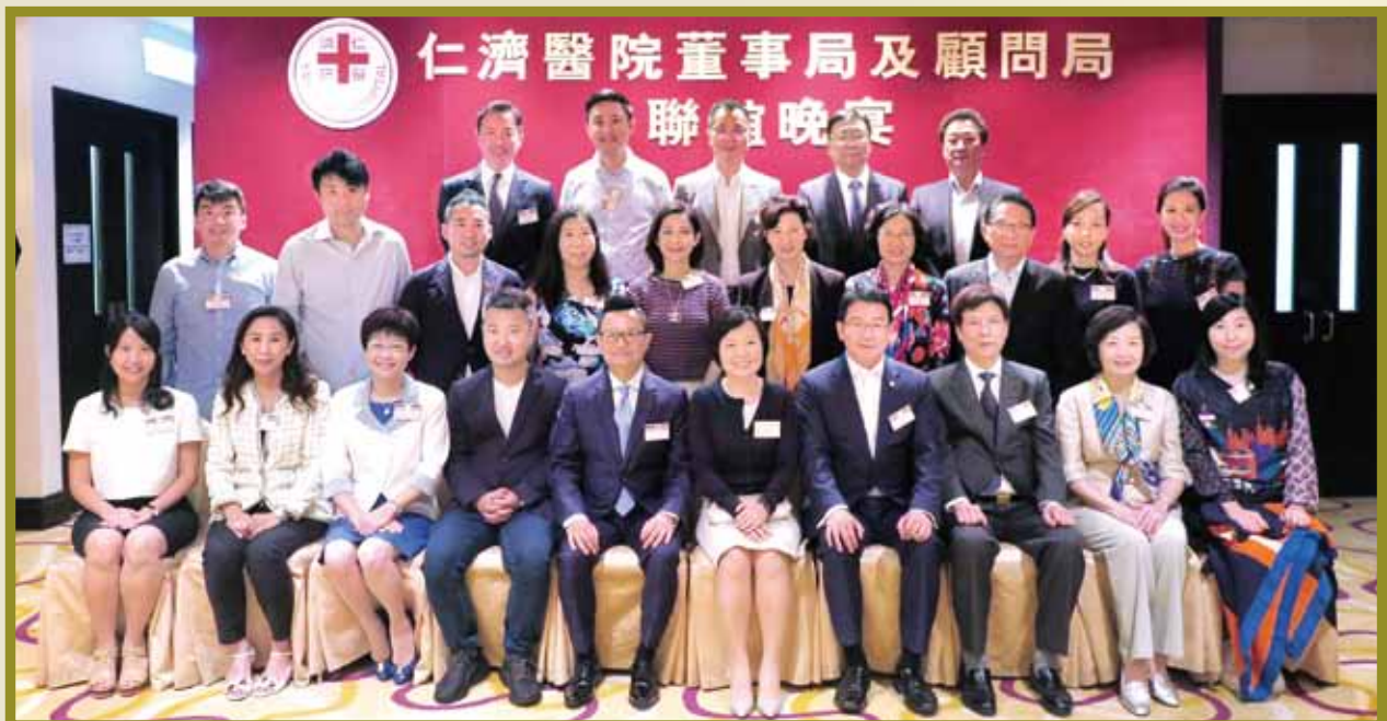
董事局、顧問局成員與教育局蔡若蓮副局長（前排右五）合照留念