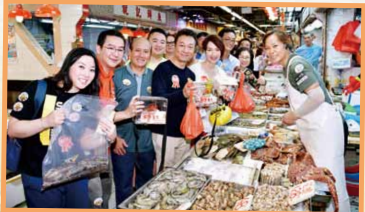
一眾董事局成員與「仁濟慈善大使」黎耀祥及謝雪心到荃灣區賣旗，得到商戶鼎力支持