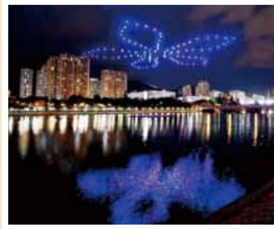
盛放的洋紫荊花緩緩綻放於夜空中