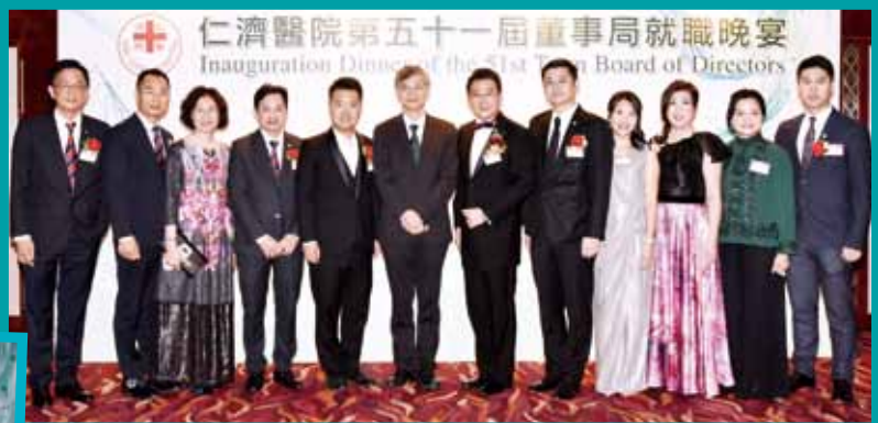
一眾出席董事局成員與羅致光局長（左六）合照