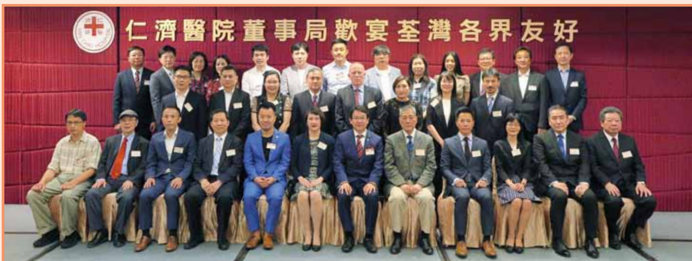
董事局與中聯辦、警務處、消防處、社會福利署、廉政公署及荃灣區撲滅罪行委員會各代表合照留念