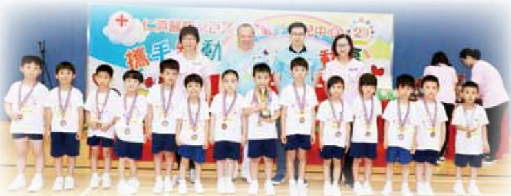
獲獎健兒與嘉賓合照