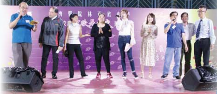
校友師生齊唱《獅子山下》