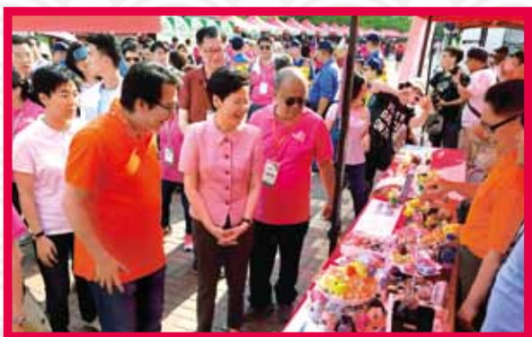
馮卓能主席向行政長官林鄭月娥介紹仁濟攤位

活動由荃灣區體育康樂聯會主辦及荃灣龍舟競渡統籌委員會籌辦，仁濟醫院董事局、荃灣鄉事委員會、馬灣鄉事委員會、荃灣商會及香港惠陽商會協辦。其中一場男女子混合決賽命名為「仁濟醫院男女子混合中龍金盃」，當日賽事緊張刺激，現場亦舉辦了嘉年華，仁濟醫院YC18餐飲、仁濟中醫及仁濟義工團亦有參與設置攤位，為大家打氣。