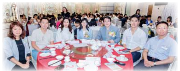
出席嘉賓於結業禮上合照留念