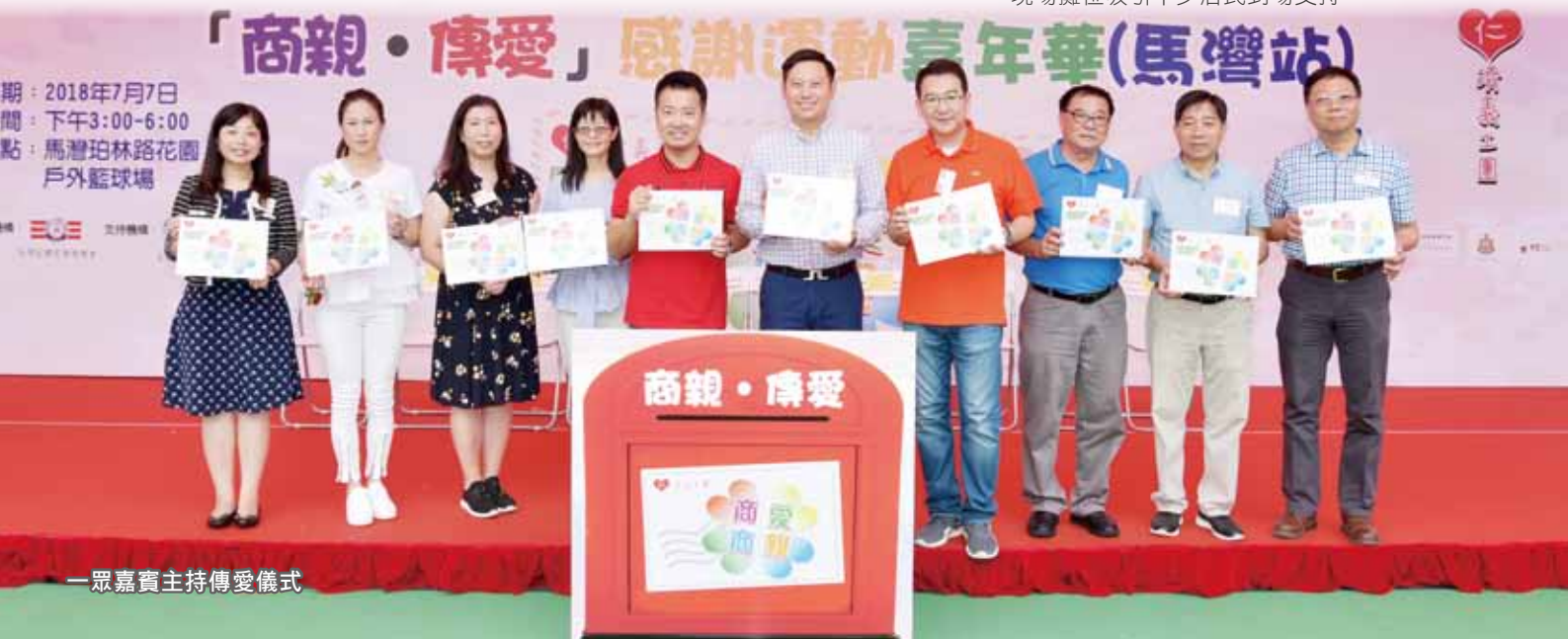
一眾嘉賓主持傳愛儀式