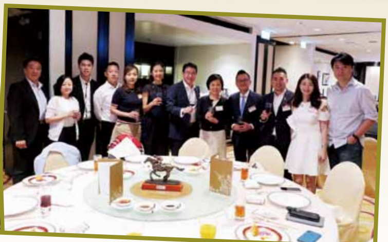
當晚大家細說過去點滴及現在種種，暢談甚歡