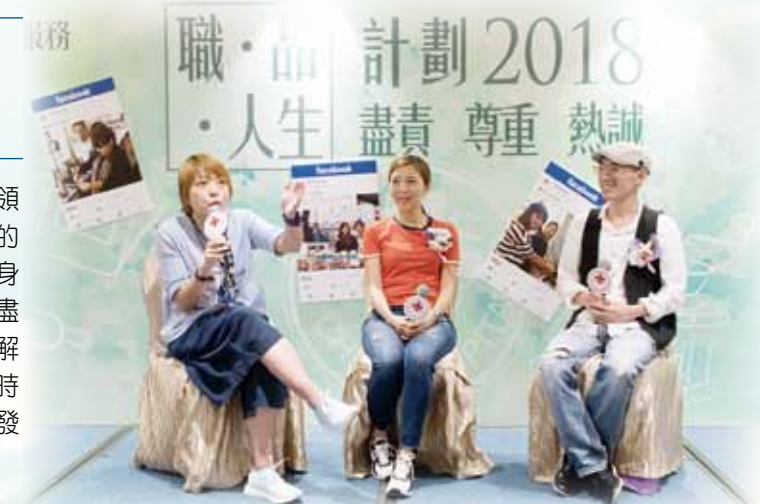
參加計劃的公司及機構分享感受