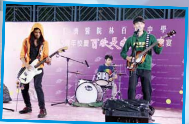
學生載歌載舞，共賀學校建校35周年