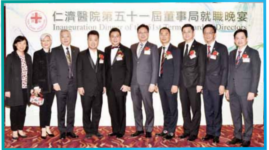
懲教署林國良署長（右五）蒞臨祝賀