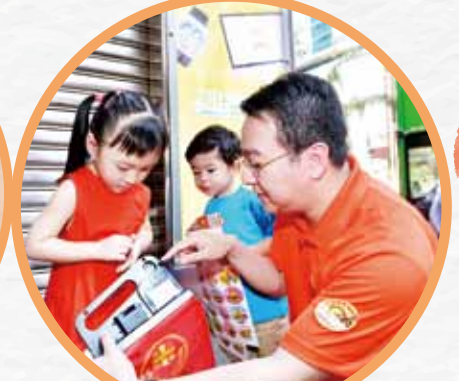
小朋友亦慷慨解囊