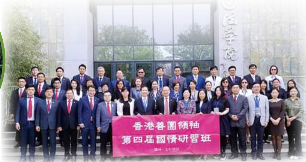
國情研習班學員在北京大學法學院門前合照留念

上述國情研習班由中聯辦新界工作部主辦，主要目的為使各善團領袖對國家社會經濟發展及政策法規有進一步的了解，及加深他們對憲法、《基本法》及慈善法等之認識，以發揮善團領袖在維護香港長期繁榮穩定的作用。研習班採用專題授課及參觀體驗等形式進行，並邀請了北京大學、清華大學及國防大學等知名教授授課，並安排學員參觀專案交流學習。