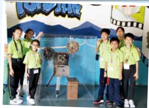
學生參觀通士達光影體驗館