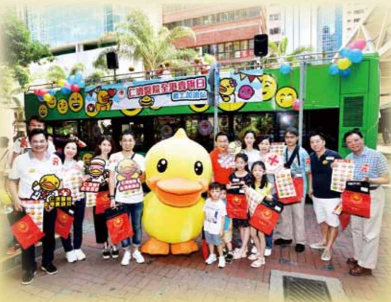
開蓬巴士遊走港九新界，為義工打氣