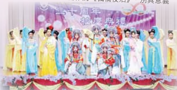
姊妹學校深圳市東湖中學為院屬第二中學校慶特別呈獻京劇表演