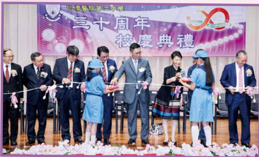
教育局楊潤雄局長與一眾嘉賓為學校多媒體創意工作室主持剪綵儀式

仁濟醫院第二中學創立於1987年，是本院第二間中學。學校於2018年5月18日舉辦30周年校慶典禮，除學生表演助慶外，教育局局長楊潤雄太平紳士亦親臨主禮，而分別位於內地及新西蘭的三間友好姊妹學校更專程派員到賀，令典禮蓬華生輝。典禮活動除向多年來服務學校的教職員頒發長期服務獎外，更為「席正林多媒體創意工作室」正式落成啟用剪綵。