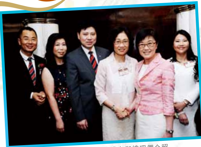
衛生署陳漢儀署長（右二）於典禮上與總理們合照