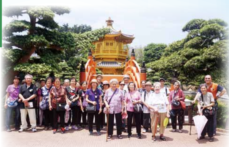
長者會員遊覽南蓮園池後雀躍地拍照留念