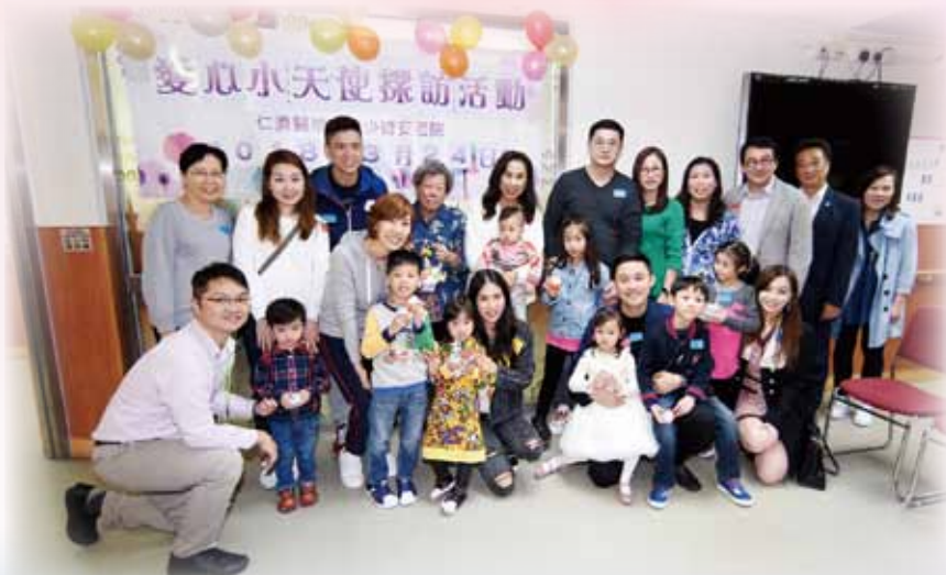
多位董事局成員支持活動，帶領小天使們參與探訪