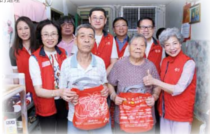
羅蘭與董事局成員送上愛心福袋，與他們分享健康生活的點滴