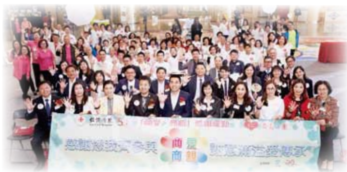
出席董事局成員與一眾嘉賓及義工於啟動禮上合照留念

大會邀請了三位獲社會福利署表揚的「2017年荃灣及葵青區傑出愛心商戶」，分享他們如何透過自身業務優勢關懷社區上有需要人士。現場除了設有仁濟中醫義診外，亦安排了一連串由愛心商戶、仁濟屬下社會服務單位及其他友好團體精心預備的才藝表演。