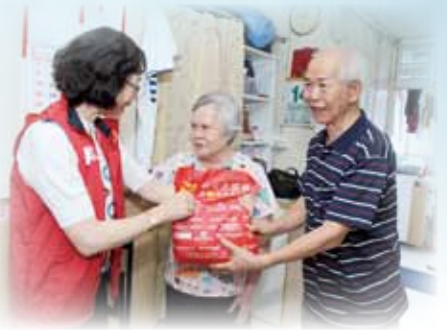
物輕情義重，比起福袋內的禮物，義工的探訪及關懷才最能令長者們感到溫暖