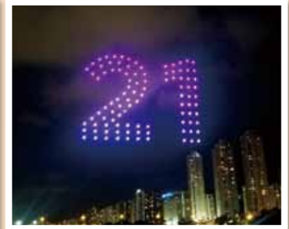
100架無人機特別砌出「21」圖案慶祝回歸21周年