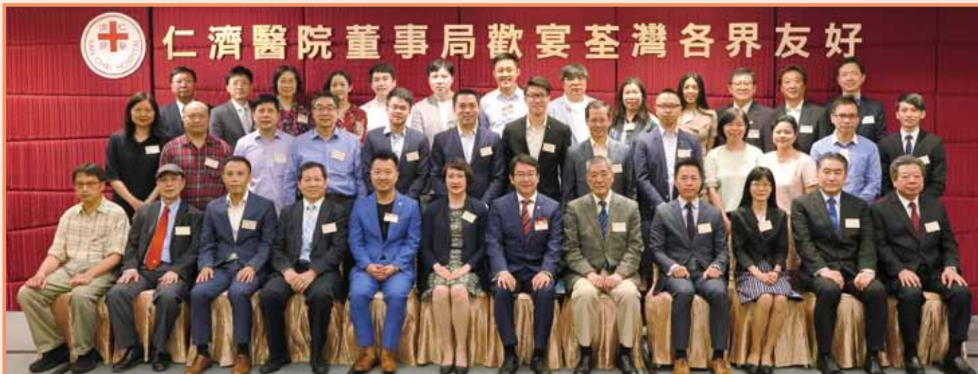
董事局與荃灣民政事務處及荃灣區議會各代表合照