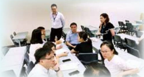
「仁濟聯校中層領導培訓課程」成功為院屬學校教師提供互相觀摩及交流平台