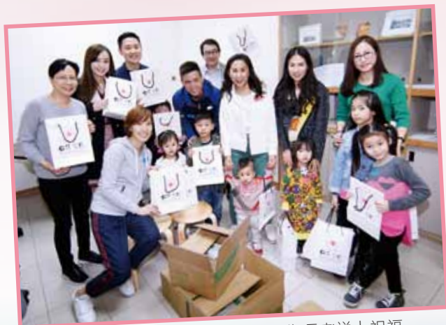
小天使們身體力行，包裝愛心福袋，為長者送上祝福