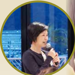
教育局蔡若蓮副局長 感謝仁濟為社會作育 英才出心出力

為了加強董事局與顧問局的聯繫，每年兩局均會舉行聯席會議及聯歡晚宴。當日會議上，雙方積極研討董事局各項服務的最新發展；晚宴亦邀得教育局蔡若蓮副局長出席，與一眾顧問總理交流心得，並寄望仁濟教育持續發展。晚宴上，大家難得相聚，當然好好把握歡聚時光，談天說地，不亦樂乎！