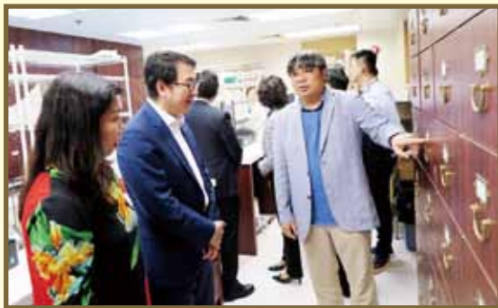
總理們了解中醫教研中心運作