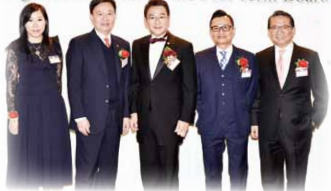
醫院管理局梁栢賢行政總裁（左二）與一眾仁濟董事局及顧問局成員合照