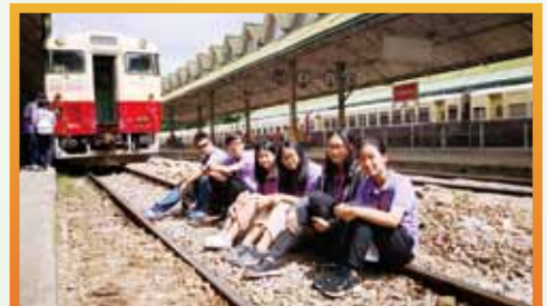
仰光中央車站建立於1877年，由當時英國殖民地政府興建