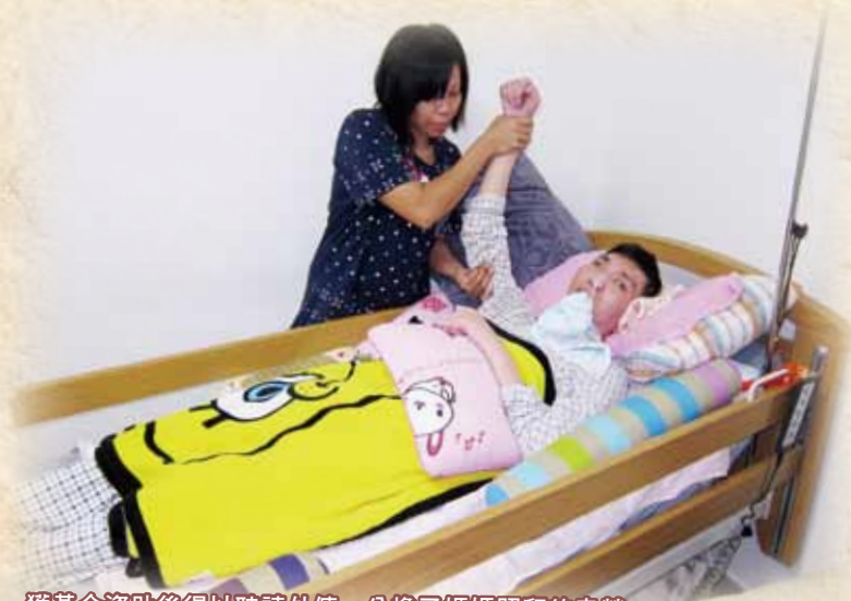
獲基金資助後得以聘請外傭，分擔了媽媽照顧的辛勞