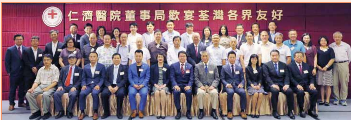
董事局與荃灣商會、荃灣鄉事委員會、馬灣鄉事委員會、圓玄學院、荃灣各界協會及新界社團聯會荃灣地區委員會各代表合照留念