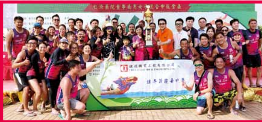
董事局成員頒發金盃予奪魁隊伍