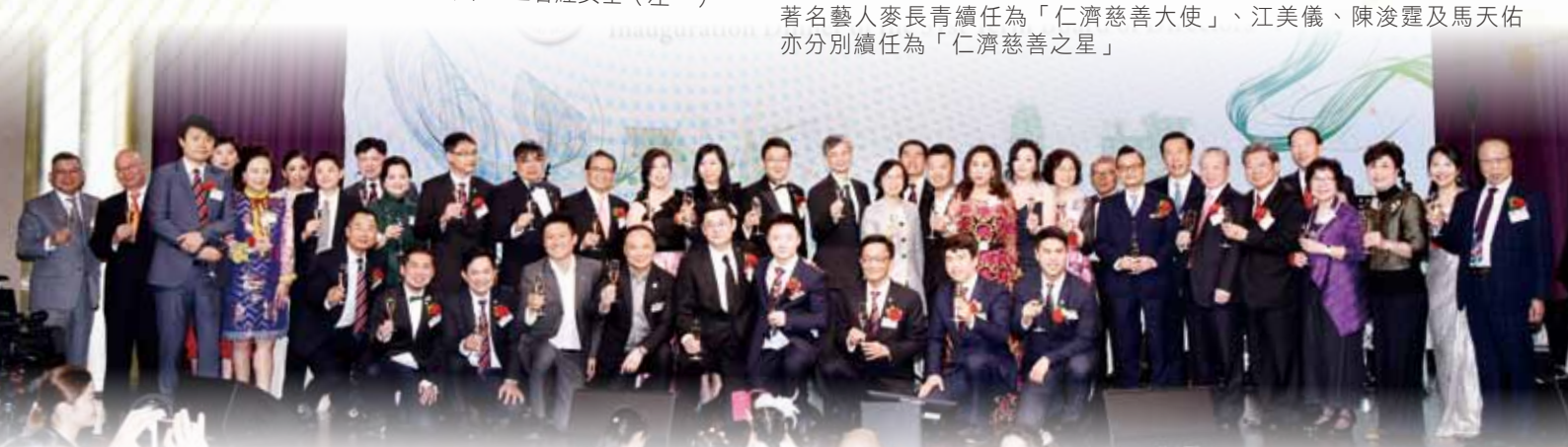
全體總理及顧問於台上向來賓祝酒