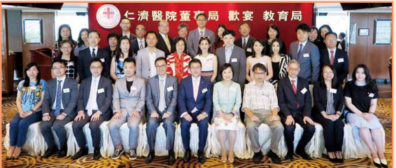
董事局與教育局楊潤雄局長（前排左五）、蔡若蓮副局長（前排右五）及一眾官員合照留念