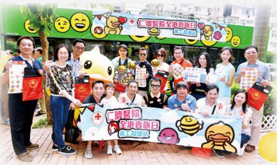
賣旗日由仁濟及著名卡通品牌——B.Duck攜手合作，B.Duck當日亦現身支持活動

活動當日，一眾董事局成員乘坐開蓬巴士到灣仔、尖沙咀及荃灣為義工打氣。「仁濟慈善大使」黎耀祥及著名藝人謝雪心亦加入荃灣站行列，更參與賣旗，落力向市民募捐，將善心傳遍每個角落，一起攜手回饋社會。