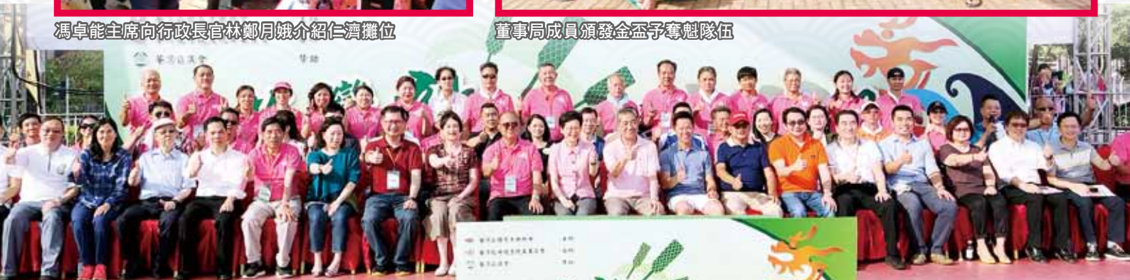
行政長官林鄭月娥與眾嘉賓對活動一致讚好