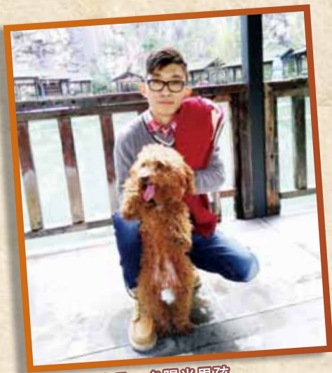
患病前偉龍是一名陽光男孩