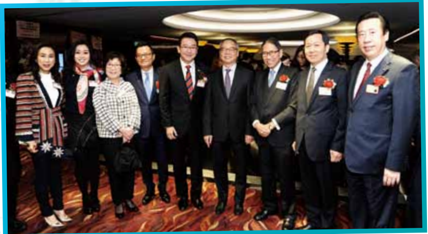
民政事務局劉江華局長（右四）、梁智鴻醫生（右三）、中聯辦新界工作部張肖鷹副部長（右二）及多位仁濟總理、顧問聚首一堂