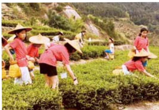
學生在華安土樓群學習及體驗農民採茶生活