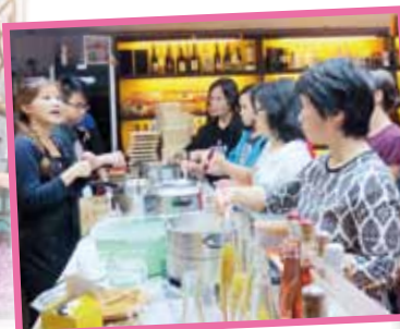
家長與學生一同參與豆腐製作工作坊、咖啡調配工作坊及參觀等活動