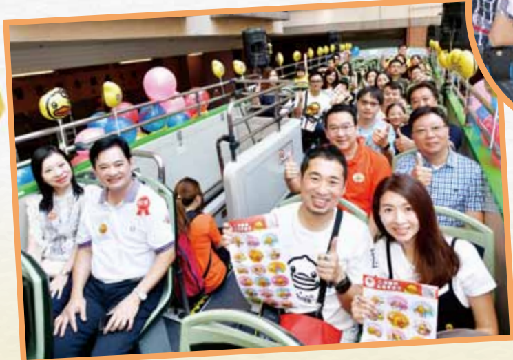
眾嘉賓清早乘坐開蓬巴士出發