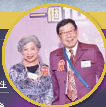
兩位充滿活力的長壽代表藝人胡楓及羅蘭到場分享養生之道

仁濟醫院社會服務部現時有9間安老院舍，包括護養院、護理安老院及安老院，為1,414名長者提供24小時全面照顧服務。服務的長者中，超過100歲的長者共有35位，90至99歲的長者更多達434位。