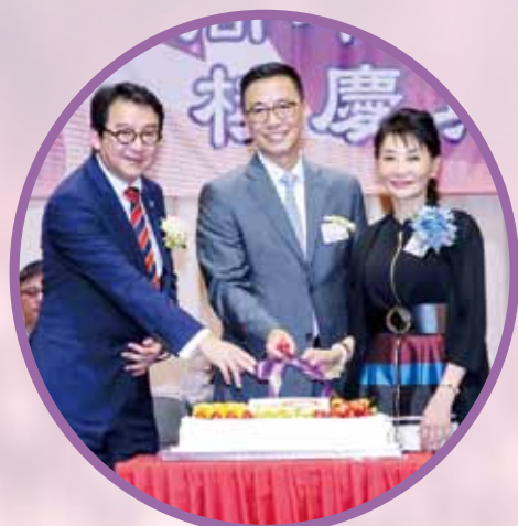
校慶典禮當天，馮卓能主席、院屬第二中學陳周薇薇校監與教育局楊潤雄局長主持切蛋糕儀式