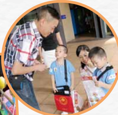
院屬幼稚園學生與家長積極參與活動