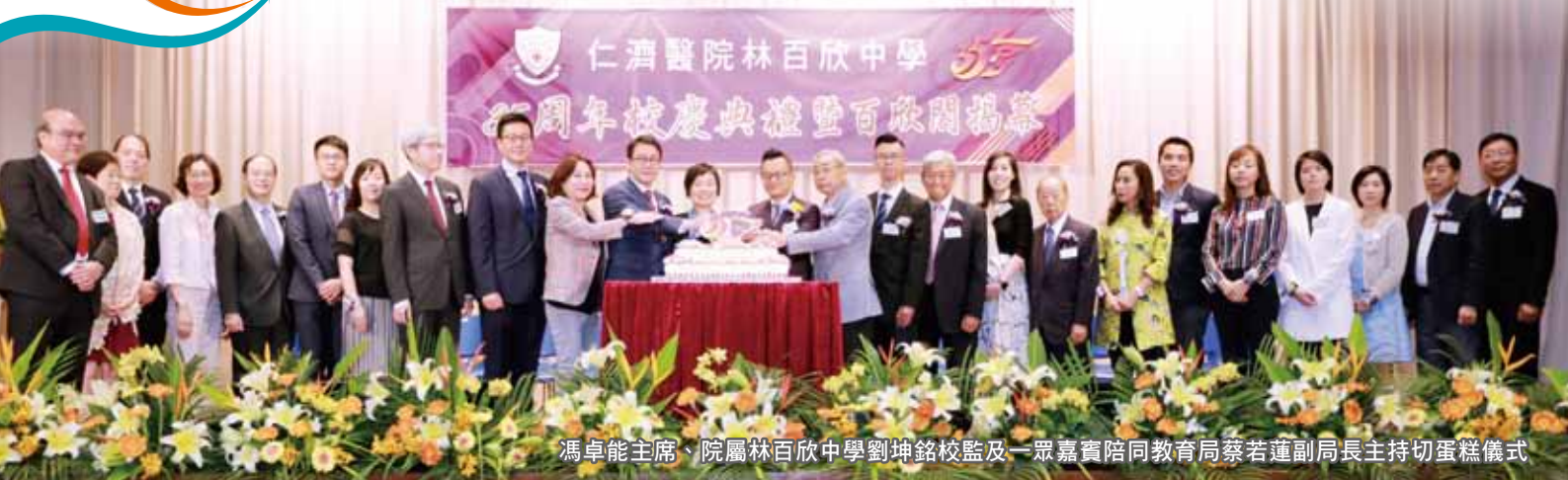
馮卓能主席、院屬林百欣中學劉坤銘校監及一眾嘉賓陪同教育局蔡若蓮副局長主持切蛋糕儀式