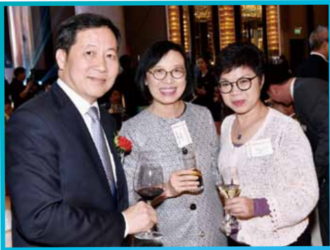
多位政、商界朋友紛紛出席支持