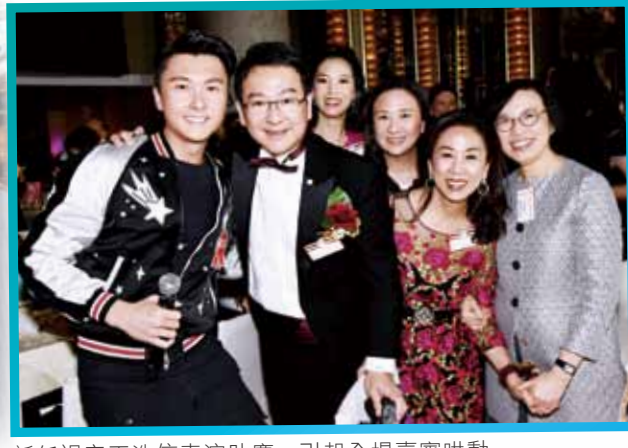
新任視帝王浩信表演助慶，引起全場嘉賓哄動