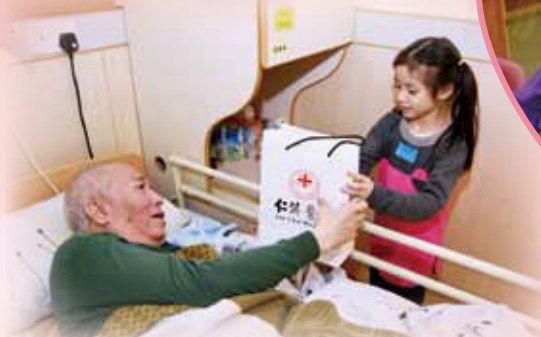
小天使為老友記送上祝福

由一眾董事局成員及其親友之年幼子女組成的「愛心小天使義工隊」再次到訪仁濟醫院屬下社會服務單位，透過親子探訪活動，從小灌輸孩子「施比受更為有福」的關愛理念，同時鼓勵他們多行善，多助人，將「仁心濟世」的精神充分發揮。當日，「愛心小天使義工隊」除了與長者玩遊戲外，更親自為長者包裝愛心福袋，為長者們送上一點點祝福。