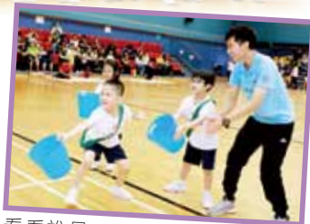
看看誰最眼明手快接紙球

2018年5月26日，院屬蔡百泰幼稚園/幼兒中心假荃灣西約體育館舉行親子運動日暨20周年校慶啟動禮，學校捐建人蔡百泰榮譽博士MH擔任主禮，連同嘉賓、教職員、友校及本校兒童和家長，逾380人出席。