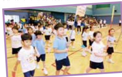
健兒浩浩蕩蕩列隊進場