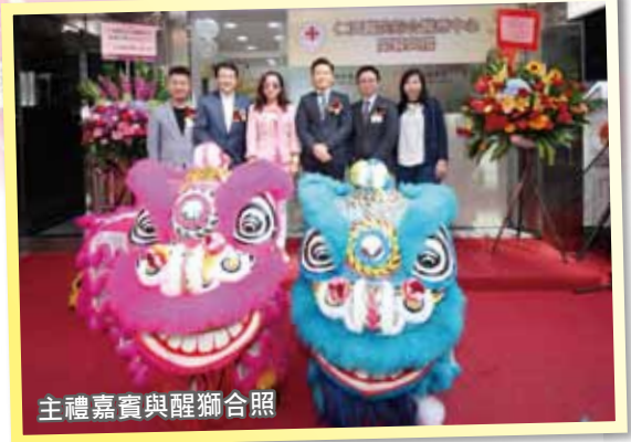
主禮嘉賓與醒獅合照

本院首間提供一站式中醫、西醫（全科及專科）及牙科服務的仁濟醫院綜合醫療中心已正式開幕，亦是仁濟醫院首次正式開辦西醫、全科及專科服務，以照顧市民不同需要。開幕當日邀得仁濟醫院第二中學龍獅隊舞獅助慶，吸引不少途人圍觀，場面熱鬧。