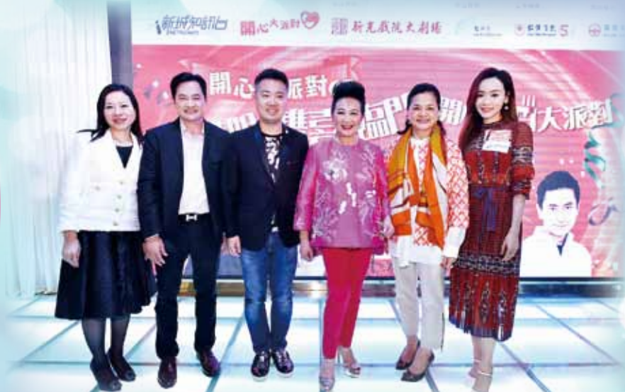
一眾仁濟董事局成員與家燕姐及藝人楊思琦小姐合照