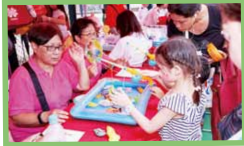
現場攤位吸引不少居民到場支持