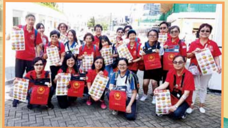
耆英們與青少年拍住上，齊齊去賣旗