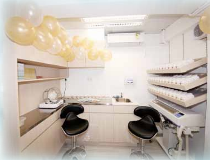
中心使用濃縮中藥顆粒沖劑