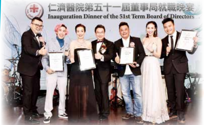
著名藝人麥長青續任為「仁濟慈善大使」、江美儀、陳浚霆及馬天佑亦分別續任為「仁濟慈善之星」