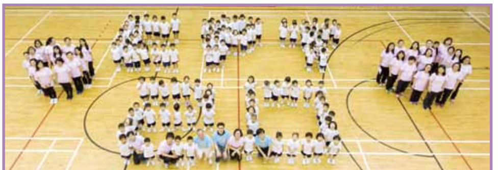
一眾嘉賓與全校兒童一同拍攝20周年校慶啟動禮造型合照