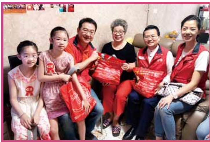
透過探訪及送贈愛心福袋，亦培養小朋友「敬老護老」的良好品德