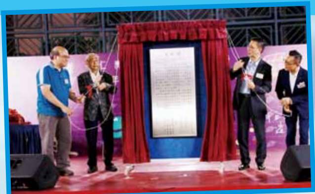
教育局楊潤雄局長主持院屬林百欣中學「百欣閣」揭幕儀式

學校於典禮翌日舉行校慶盆菜宴，筵開58席並邀請退休教職員、校友及家長，與現職教職員聚首一堂、閒話當年。教育局局長楊潤雄太平紳士更親臨到賀，並為學校新建的「百欣閣」進行簡單而隆重的揭幕儀式。