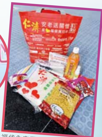
福袋內容豐富，食品及日用品一應俱全