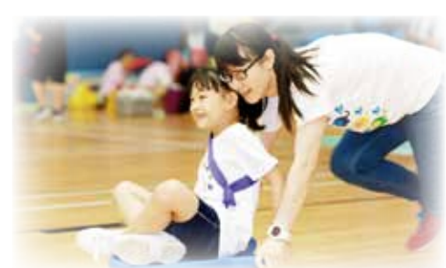
家長與兒童一起玩板車

院屬蔡百泰幼稚園/幼兒中心於1998年創辦，為慶祝20周年校慶，學校將舉行一連串活動，如：標語創作、海報設計、舊歌新詞、祝壽賀禮及賀卡設計等。此外，學校將於2018年12月舉行校慶典禮，廣邀校友、在讀生及家長參與，共賀校慶。