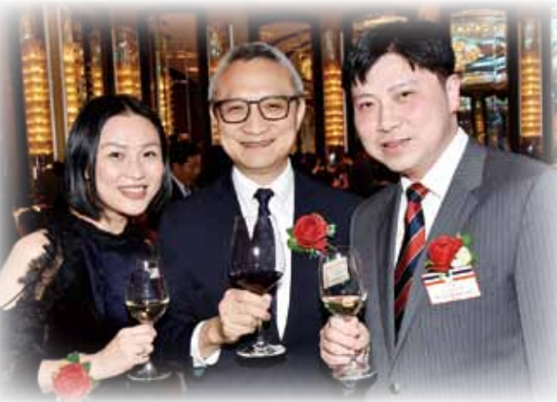
食物及衛生局徐德義副局長（中）親臨晚宴