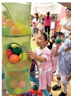
▲ 幼兒探索嶄新的校園設施，展現好奇