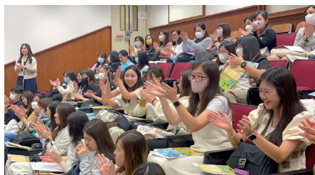
▲ 同工打成一片，使導向日洋溢著熱鬧和諧的氣氛