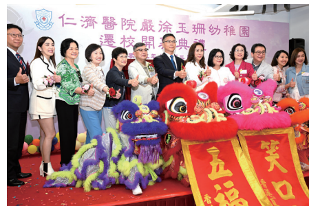
▲ 醒獅齊賀嚴幼朝氣蓬勃，桃李滿門，再創輝煌