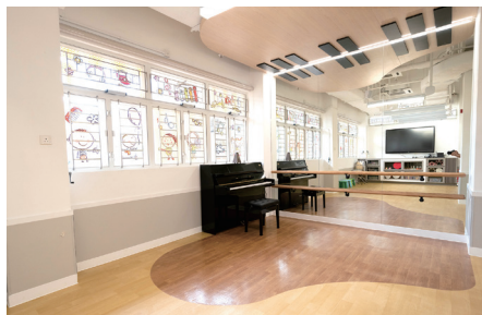
▲ 音樂室設計具藝術創意，音樂氣氛濃厚