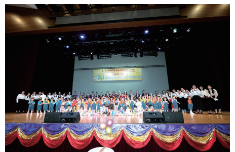
▲ 主禮團與幼兒一起合唱校慶主題曲「喜樂在百泰」，祝賀學校生辰快樂