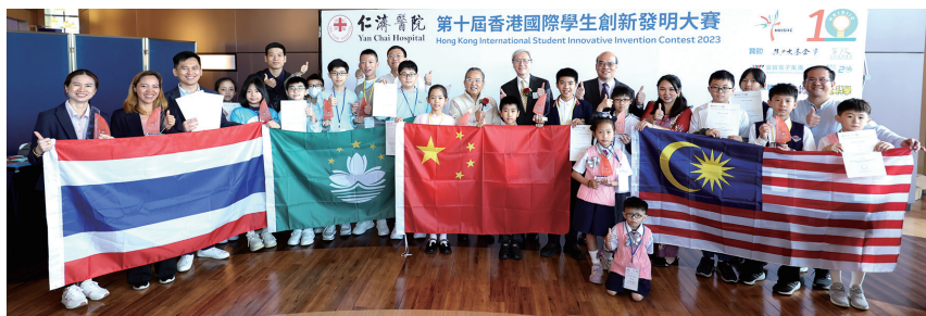
▲ 榮獲「香港特別獎」的國際隊伍合照留念

同學在學校感到不適或撞傷時，只需開啟LCCS A.I.急救箱的應用程式，並說出徵狀或利用人工智能鏡頭對準傷者患處，應用程式會以語音指示同學處理的步驟，急救箱對應的箱子亦會隨之打開，提供所需急救用品。