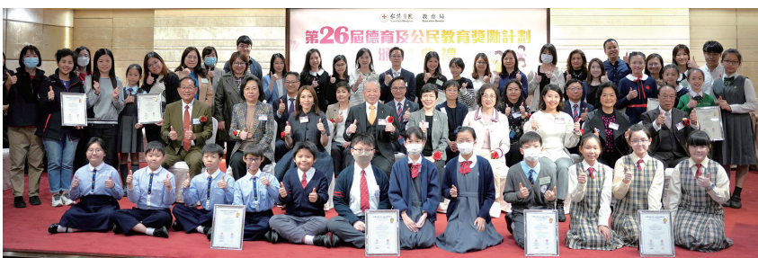
▲ 小學組得獎師生代表與主禮團成員拍照留念