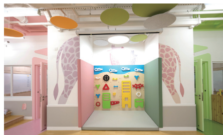
▲ 體能發展空間，創設趣味攀爬牆