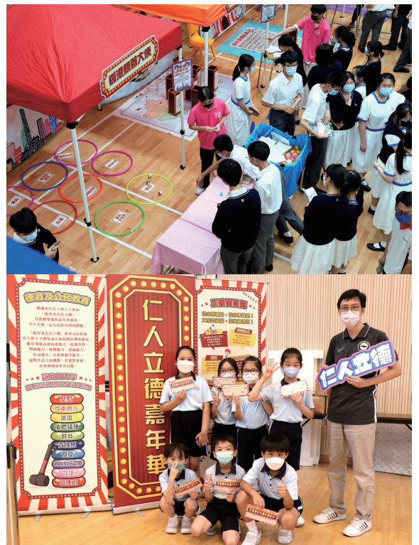
▲ 在校內舉辦嘉年華會認識重要的價值觀和態度