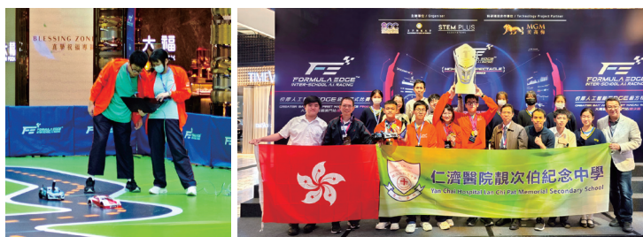
▲ 學生於比賽場地收集路面數據以建立人工智能模型

院屬靚次伯紀念中學（下稱「靚中」）STEAM隊伍參與「校際人工智能 EDGE 級方程式比賽」，學生需自行設計及組裝比賽車，並編寫程式和收集相片數據，建立人工智能模型讓比賽車沿賽道自動駕駛。靚中於上述賽事取得佳績，勇奪大灣區首屆澳門站總決賽亞軍和香港組別冠軍，並獲得第三屆香港站總季軍和香港組別季軍，及其他多個獎項，令人鼓舞。