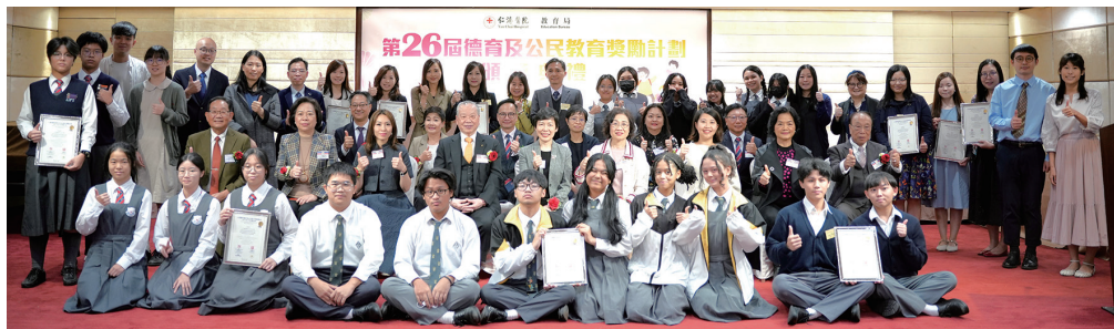
▲ 中學組得獎師生代表與主禮團成員拍照留念