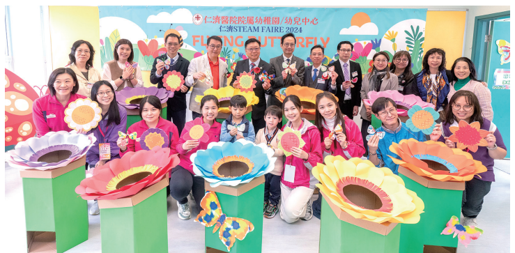
▲當日一眾嘉賓和幼稚園校長及師生打成一片，使校園洋溢著熱鬧及歡樂氣氛