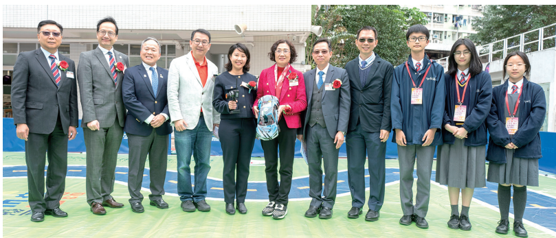
▲學生義工向嘉賓介紹人工智能遙控車的簡單結構，與嘉賓一同分享創科樂趣