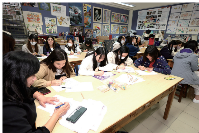
▲ 幼師們投入參與工作坊