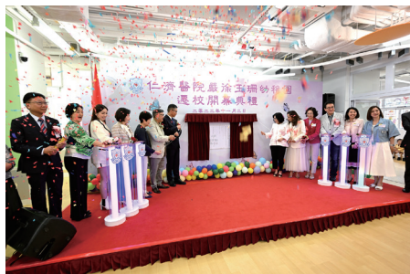
▲ 新校舍進行揭幕、亮燈及鳴炮儀式

為配合屯門區發展帶來的教育需要，仁濟醫院嚴徐玉珊幼稚園成功申請遷入和田邨新校址，繼續為適齡學童提供優質的教育服務。在2023年10月5日承蒙香港特別行政區行政長官夫人李林麗嬋女士、中央人民政府駐香港特別行政區聯絡辦公室新界工作部李功勛副部長，聯同仁濟醫院董事局孫蔡吐媚主席為嚴徐玉珊幼稚園主持「遷校開幕典禮」，場面盛大，喜氣洋溢，並得到多位嘉賓到場支持。