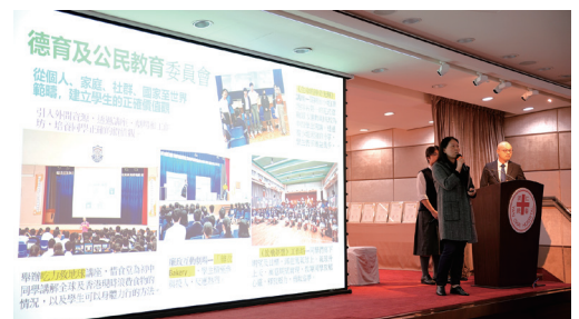
▲ 中學組獲最高分學校分享計劃內容