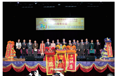
▲ 主禮團於校慶典禮揭幕表演後，與醒獅隊合照

仁濟醫院蔡百泰幼稚園／幼兒中心自1998年創校至今已25周年，一直秉持「以愛為本、以德育人」的理念，在荃灣區培育了千多名幼兒快樂成長。學校於2023年3月開始舉行一連串慶祝活動，包括校慶啟動禮、親子LOGO設計及繪畫創作比賽等。2024年1月20日，學校於新界鄉議局大樓舉行「百泰育苗廿五載・千童笑臉迎未來」25周年校慶典禮，承蒙日本國駐香港總領事岡田健一大使、香港大學經管學院名譽教授及前嶺南大學校長陳坤耀教授GBS，CBE，JP蒞臨主禮，復蒙仁濟醫院董事局孫蔡吐媚主席、副主席兼校監朱德榮MH及學校捐建人蔡百泰榮譽博士親臨到賀，並獲各界賢達、友好親臨與四百多位學生及家長見證學校二十五載育幼里程。