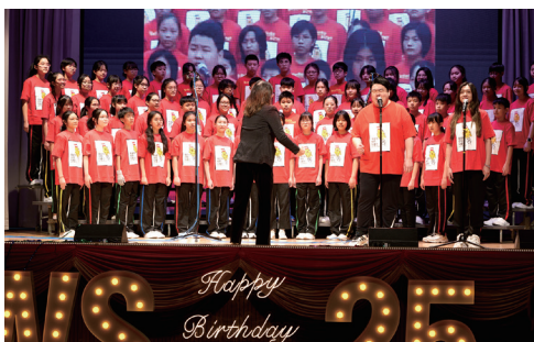
▲ 20年前的精英合唱團主音與在學的師弟妹重現當年「麥當奴世界兒童日」大合唱