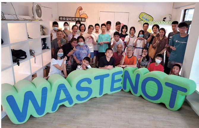
▲ 家長及學生參觀「粒粒皆辛館」，了解全球糧食問題及珍惜食物