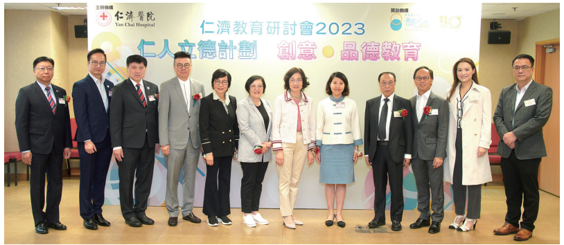
▲ 主禮團成員拍照留念

此外，當天同場舉行仁濟中小學優秀教師頒獎典禮，31個院屬中小學提名單位（教師／教師團隊）表現卓越，對學校貢獻良多，榮獲優秀教師獎。