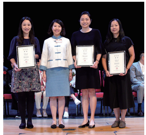
▲ 張文嘉副主席（左二）頒發優秀教師獎予院屬學校教師