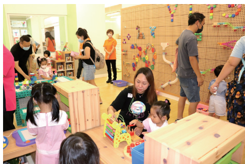
▲ 家長與幼兒到校參觀新校舍

家長對新校舍充滿信心，全體的2023/24學年幼兒班、低班學生均留校升讀，學校亦收生滿額，足證嚴幼辦學成績優異，家長對搬遷校舍全面支持。