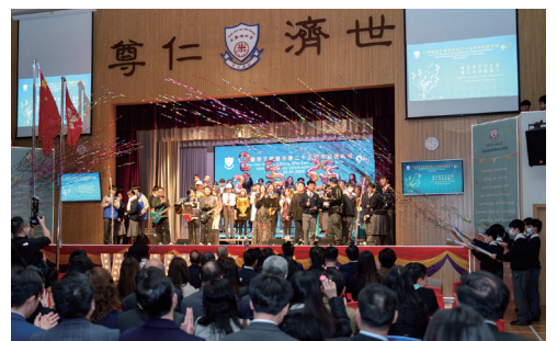
▲ 校友及一眾師生合力演出，校慶典禮圓滿成功