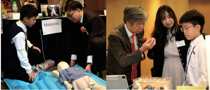
▲ 小發明家即場介紹發明作品，並細心解答評審的提問

仁濟醫院董事局主辦之「第十屆香港國際學生創新發明大賽」旨在提供創科學習交流平台，培育小學生的創意思維。是次大賽吸引62間來自本地、中國內地、馬來西亞、南韓、泰國及澳門的小學參賽，參賽作品共280件。經初賽評審，最後選出80件本地及國際隊伍發明作品進入總評。