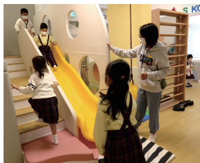
▲ 學童一同體驗滑梯屋的樂趣