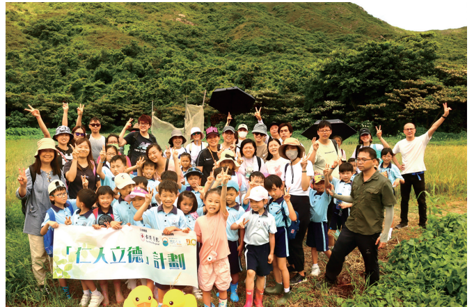
▲ 家長及學生透過農耕活動，體驗堅毅付出及增加親子關係

為配合教育局公布九種首要的價值觀和態度，本院特別設計院本德育培育計劃「仁人立德」計劃，突破傳統單向式講授方式，以互動及體驗式的活動推動價值觀教育，幫助學生建立堅毅、尊重他人、國民身份認同、公民責任和意識、守法等核心價值。本計劃更獲得華人永遠墳場管理委員會年度捐款計劃贊助167萬元支持。院屬11間中小學先後舉辦了20多項活動及課程，當中亦包括教師培訓及親子活動，讓教師以創意方式推行品德教育，亦讓家長深入了解品德培育的價值。