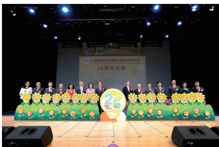
▲ 嘉賓將寫有「傳統美德」字句的花朵插進花槽，寓意攜手共同育幼苗