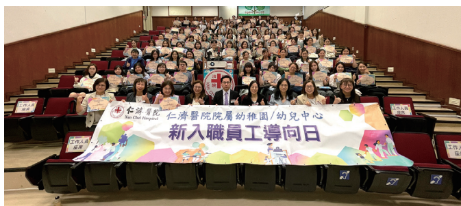
▲ 新入職同工與董事局教育部及校長拍照留念

本院轄下幼稚園／幼兒中心近100名員工參加是次活動，透過豐富的資訊分享及參觀院屬艾王忠椒育嬰園，有助教師更深入了解如何照顧預備班及低班的幼兒，促進彼此間交流，讓新入職員工盡快融入工作環境，掌握職位知識和技能，同時建立團隊精神，起著導向性的作用。