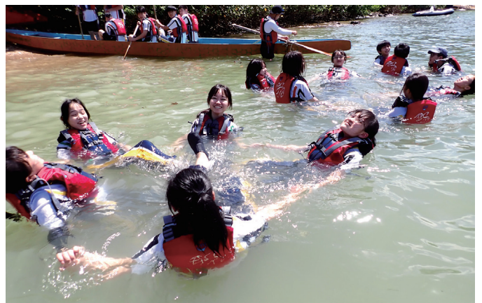
▲ 透過海上活動和陸上歷奇等，訓練學生的正向思維和提升溝通及決策能力