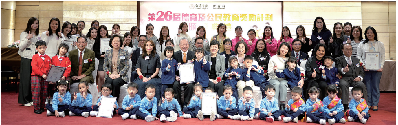
▲ 幼稚園組得獎師生代表與主禮團成員拍照留念

由仁濟董事局主辦、教育局協辦之「第26屆德育及公民教育獎勵計劃」旨在協助全港學校推動品德及公民教育，加強學生的品格薰陶與公民責任培訓。今屆計劃共收到104份計劃書，由教育界先進及仁濟董事局代表組成之評審委員會，於2023年11月16日進行評審工作，並按呈交計劃書數目比例，選出分別為幼稚園15項、小學31項及中學14項，合共60項入選獎勵計劃，每項獲頒獎金5,000港元。