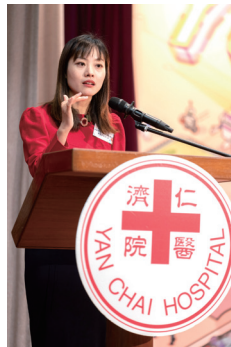
▲大會邀得創新科技及工業局副局長張曼莉女士JP蒞臨主禮

是次嘉年華主題「智能科技 智慧生活」，由各屬校師生設置33種智慧創意的特色活動，包括A.I.擴散模型生成圖片展覽、A.I.繪圖 x 鐳射切割作品展、A.I.人工智能車示範、A.I.奧運會等，與公眾分享屬校的STEAM教學成果。此外，活動還設有STEAM教育計劃展、攤位遊戲、趣味創科工作坊、比賽等，吸引媒體代表、校長、師生和家長等出席，超過1,500人濟濟一堂，場面熱鬧。