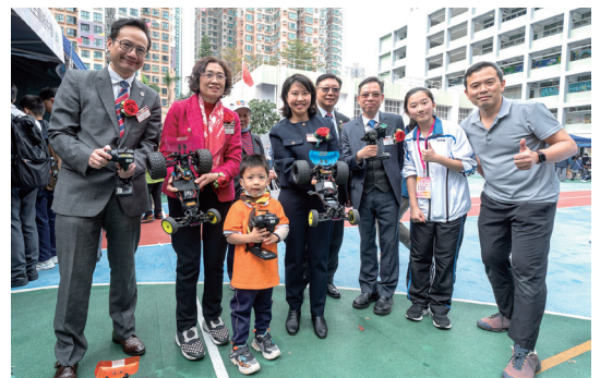
▲學生義工向嘉賓講解操作遙控車的技巧