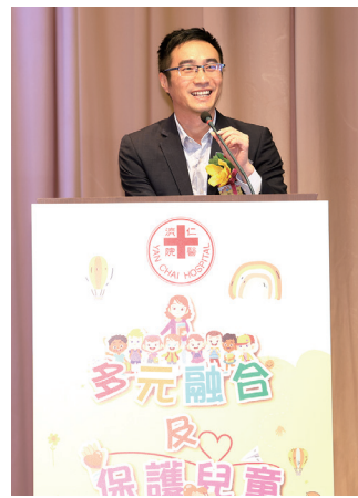
▲ 鄭于樺處長致辭分享親身經歷

仁濟醫院院屬幼稚園／幼兒中心教育研討會為本院年度性培訓活動，致力促進教師的專業發展。本年度得中央人民政府駐香港特別行政區聯絡辦公室新界工作部宣教處處長鄭于樺先生親臨主禮。鄭處長致辭分享兒子在幼兒教育啟迪下成長的自身感受，深明幼師們任重道遠，鼓勵大家努力教導下一代，成為國家棟樑。本年度研習主題為「多元融合及保護兒童策略」，當日上午邀請香港教育大學幼兒發展與特殊教育講座鍾杰華教授作專題講座，下午共安排四個工作坊，包括「處理保護兒童技巧」、「幼稚園日常工作與保護兒童」、「學習及情緒支援」及「兒童氣質與因材施教」，全面地為教職員提供保護兒童的支援策略。