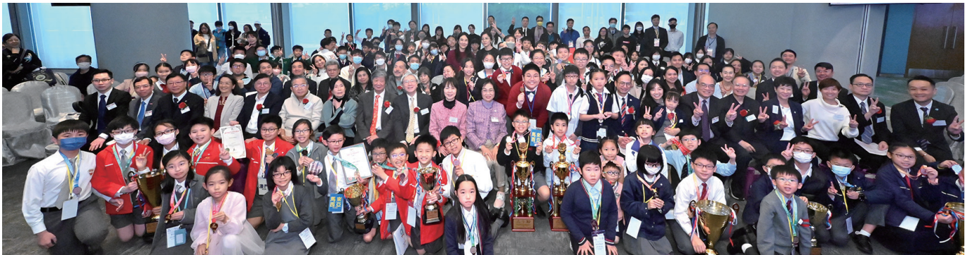
▲ 大賽得獎學生、教師與一眾嘉賓拍攝大合照，場面熱鬧