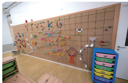
▲ 大型STEM Wall建構創意天地