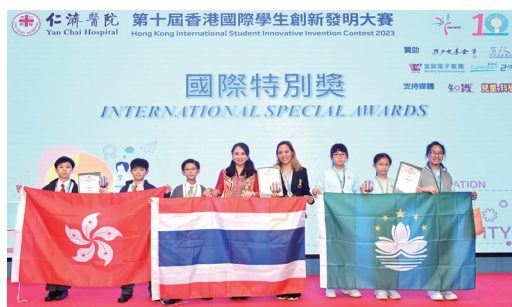
▲ 國際隊伍領隊頒發「國際特別獎」予獲獎學校