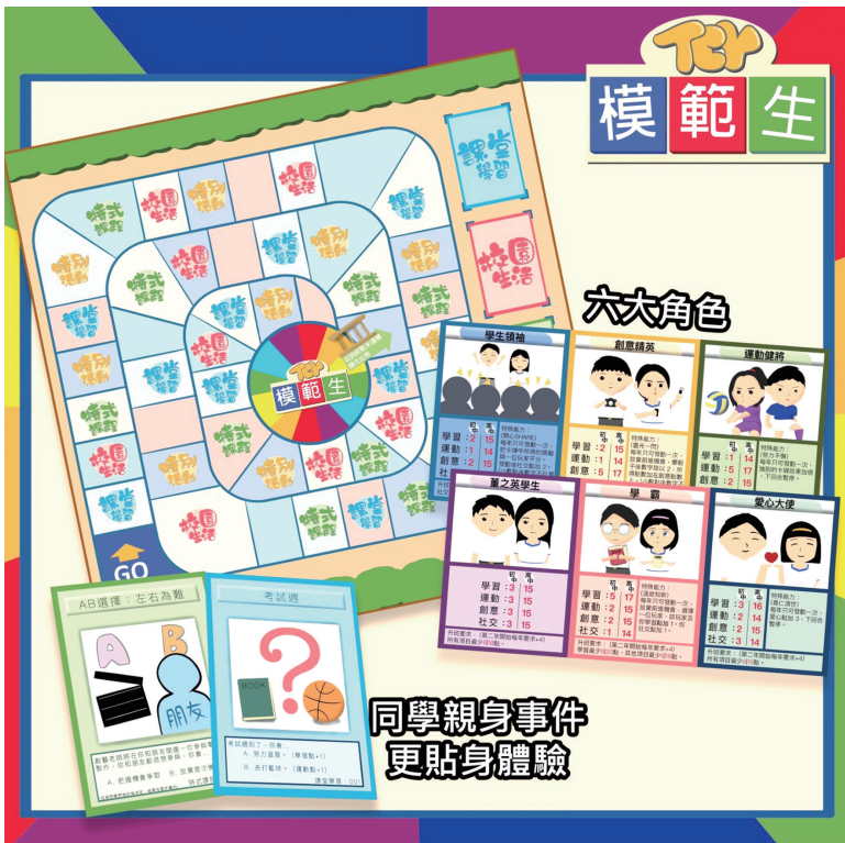
▲ 學校設計校本桌遊讓學生在不同情景中作出適當抉擇