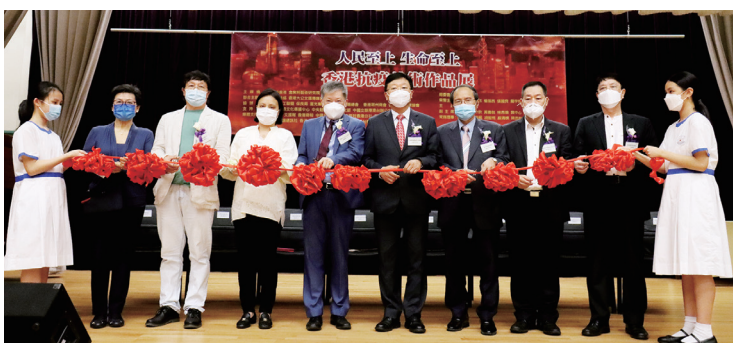
● 主禮團嘉賓為校園巡展進行剪綵開幕儀式

「人民至上 生命至上」香港抗疫美術作品展由藝術香港、金紫荊藝術研究院、香港美協、香港大公文匯傳媒集團聯合主辦，並有二十多家媒體及社團機構協辦。本院獲邀舉辦到校巡展，院屬靚次伯紀念中學及林百欣中學先後在6月至8月期間舉行，讓師生在校內近距離欣賞抗疫畫作。每幅作品均展現香港各界勇於擔當和不畏艱辛的抗疫精神，讓學生感受藝術家是如何用藝術的方式表達對抗疫英雄的敬意。