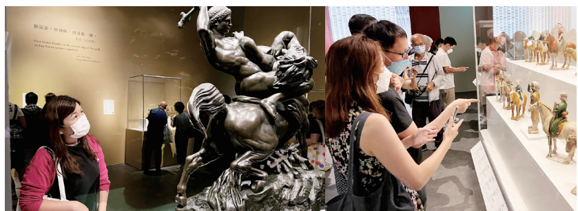
● 教師駐足欣賞展廳內的珍藏