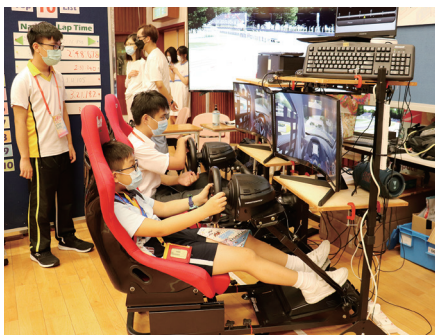
● 學生義工向參加者介紹遙控車簡單結構，讓參加者進行模擬賽車及熟習賽道，進行小型比賽