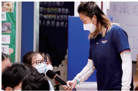
● 學生積極回應提問