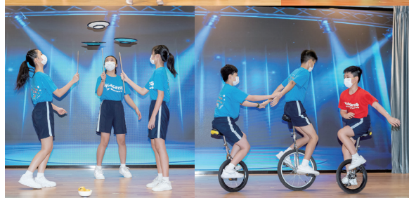
● 學生進行一連串的精彩表演，盡展潛能