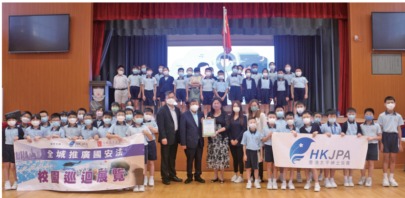
● 院屬陳耀星小學參加國安教育校園巡迴展覽

院屬6間中小學在2021/22學年參加了由荃灣區公民教育委員會及荃灣青年會主辦、香港太平紳士協會協辦的「國安法巡迴展覽」。各校在校內設置多塊由大會提供的展板，並舉辦有獎問答比賽，透過遊戲方式，增加學生對國家安全不同領域的認識。