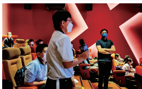
● 學生於分享會中主動提問