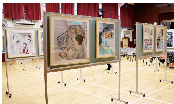
● 現場展出多幅抗疫美術作品