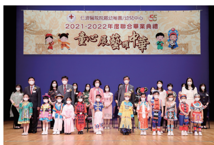
● 院屬幼稚園／幼兒中心致力從文化藝術角度切入，讓幼兒認識中國文化，營造一個令人難忘的畢業典禮。

本院分別為屬下2間幼稚園及10間幼稚園／幼兒中心於2022年6月24日假新界屯門大會堂舉行聯合畢業典禮，本學年共有409名畢業生。大會邀請香港教育大學學術及首席副校長李子建教授太平紳士蒞臨主禮，為畢業生送上祝福。本年度聯合畢業典禮以「童心展藝耀中華」為主題，讓幼兒認識中國文化藝術，加強幼兒對國家的認同。除了頒發畢業證書外，還頒發仁濟獎學金、仁濟學生卓越表現獎，表揚獲得優良成績的學生；另外，為推動教師追求卓越，大會也頒發優秀教師獎，表揚優秀教師及回饋教師的貢獻。