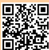
● 虛擬學生成果展覽會

院屬羅陳楚思中學二十周年校慶，透過不同的慶祝活動，讓師生參與校慶活動及展現學習成果。由校慶師生及親子「Strive for the future 虛擬跑」展開序幕，繼而有校慶壁畫、筆記比賽、學習KOL比賽、親子閱讀短片比賽，虛擬學生成果展覽會等一連串慶祝活動。最後，以畢業禮暨校慶表演作結，當天先由學生、校長和老師共同參演的校慶微電影作序幕，並播放二十週年的回顧片段，勾起師生們二十年的美好回憶。