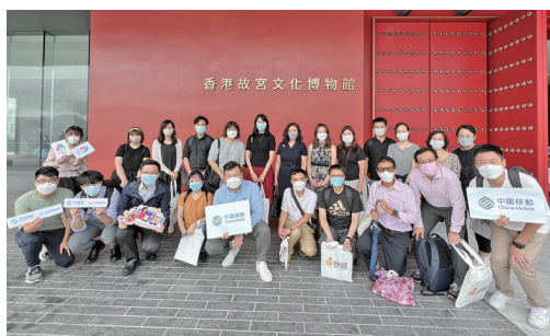
● 院屬中小學校長及教職員於博物館外拍照留念

本院獲中國移動贊助，28名院屬中小學校長及教職員於2022年8月12日到訪香港故宮文化博物館。透過參觀別具特色的展廳及欣賞珍貴文物，讓教職員以嶄新視角探索中國藝術及文化。