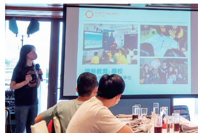
● 保育講座宣揚愛護海洋的重要性