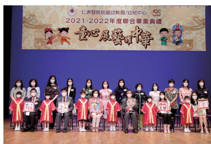
● 畢業生代表致送紀念品予主禮嘉賓李子建教授太平紳士（前排右五）及一眾嘉賓。作品以「中華文化」為題，由學生親手製作而成，象徵著多姿多彩的校園生活。