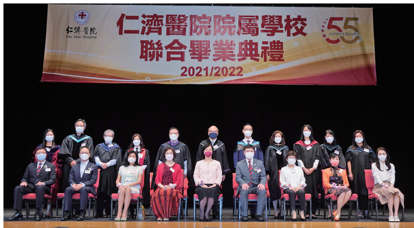
● 主禮團成員與院屬中小學校長拍照留念

在典禮上，大會除頒發畢業證書外，還頒發最傑出學生獎、文憑試優異成績表現獎、仁濟學生卓越及優異表現獎，以表揚在學術及非學術方面獲得優良成績的學生。