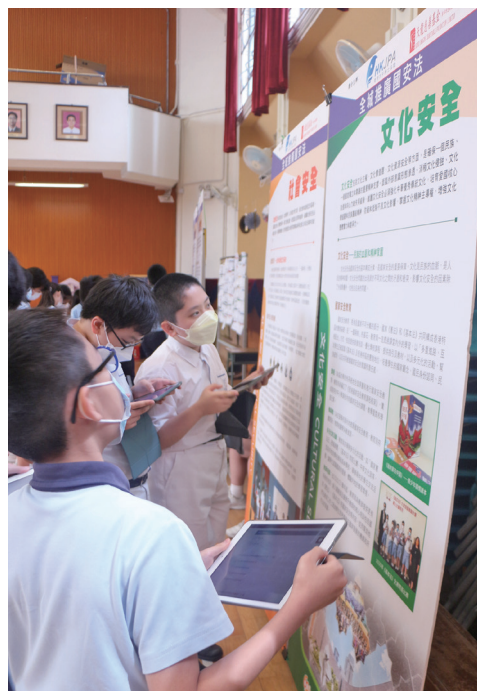
● 同學們細心在展板中找出答案