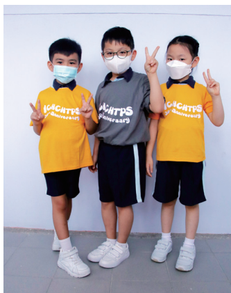
● 學生穿上校慶版T-shirt，格外醒神