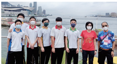
● 學生與教師首次近距離觀賞帆船賽

23名來自院屬第二中學、靚次伯紀念中學、王華湘中學及蔡衍濤小學的學生獲香港遊艇會慈善基金邀請，於2022年6月11日前往香港遊艇會觀賞「香港特別行政區25周年回歸帆船賽」（下稱「帆船賽」）。當天，一眾師生近距離觀賞帆船賽，感到份外興奮。觀賞賽事後，學生參與由香港環保慈善團體——「無塑海洋」主持之海洋保育講座。「無塑海洋」代表分享塑膠廢物對海洋生態的禍害，藉此引起學生對海洋保育的關注，鼓勵他們身體力行參與沙灘清潔等保育活動，從生活中「減塑」。