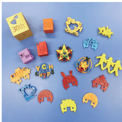
● 學生利用3D打印技術製作30周年文具及擺設