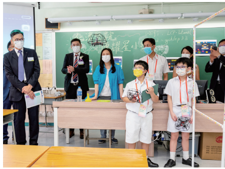
● 學生義工向嘉賓講解及示範如何操作無人機