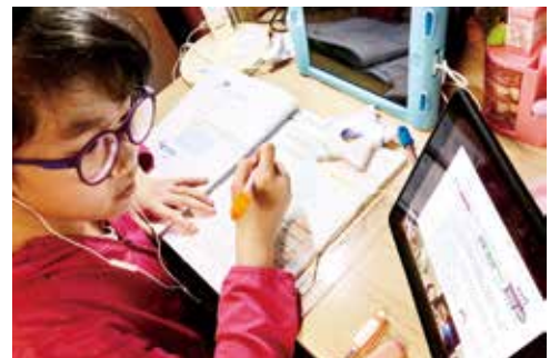
● 學生認真專注地參與數學科網上課堂，學習解題技巧