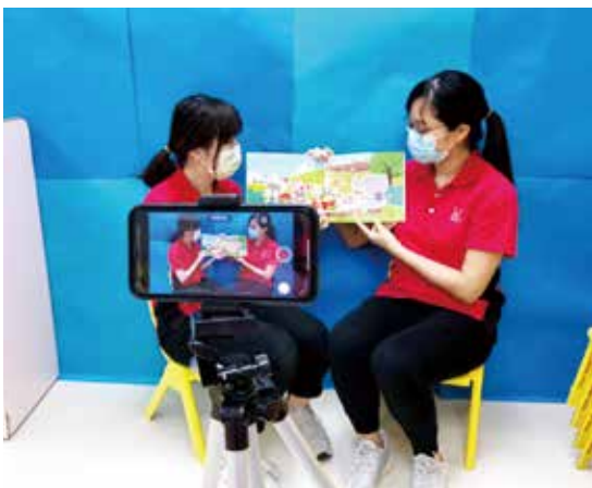
● 林李婉冰幼稚園 / 幼兒中心教師以錄像方式，用故事引導學生從不同角度思考