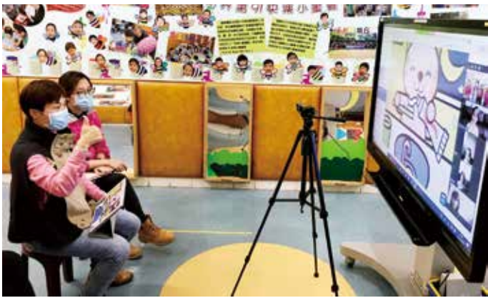
● 永隆幼稚園 / 幼兒中心教學團隊與學生進行視像英語溝通訓練