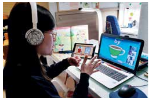
● 教師透過視像軟件進行網上授課，與學生實時互動