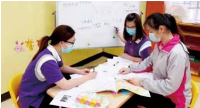
● 蔡百泰幼稚園 / 幼兒中心教師正在整理網上教學內容