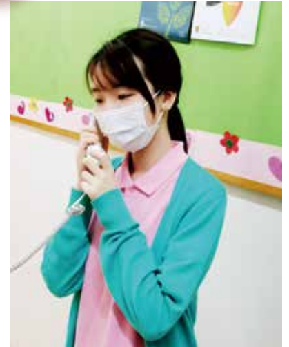
● 明德幼稚園教師定時致電學生和家長，了解他們在家最新狀況和學習進度