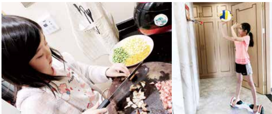
● 蔡小學生每天分配時間完成網上自學功課，亦會在家中以不同形式尋找生活的樂趣