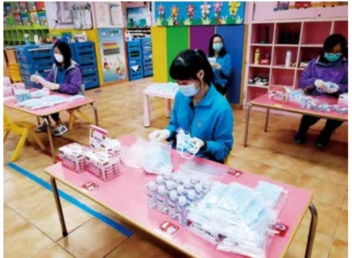
● 九龍崇德社幼稚園 / 幼兒中心關顧學生和新生，製作防疫包