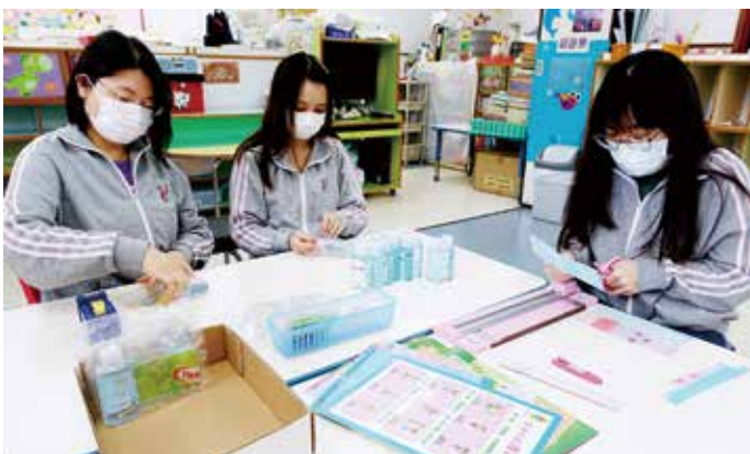
● 裘錦秋幼稚園 / 幼兒中心教師製作「環保口罩套」及搓手液防疫包送予學生