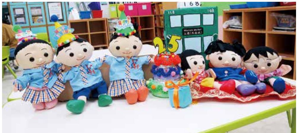
● 郭子樑幼稚園 / 幼兒中心教師自製手偶創作故事，為在家學習增加趣味