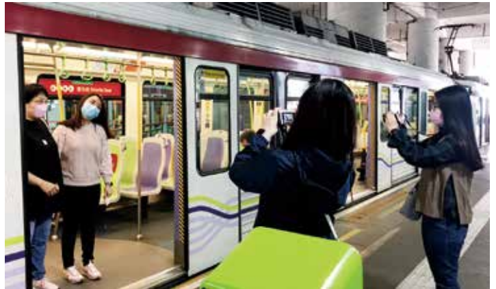
● 嚴徐玉珊幼稚園教師進行幼兒班主題「交通工具」的外景拍攝

院屬 12 間幼稚園及幼兒中心的教職員，面對疫情及停課，發揮無窮創意，與幼兒及家長共同抗疫，包括製作及分派口罩、口罩袋、搓手液防疫包等，身教幼兒守望相助，發放正能量。與此同時，各校教師均自家製教學影片，有些更與學生進行視像互動學習活動，為學生提供在家持續學習的內容，以正向的態度與家長和學生攜手走過「疫」境。