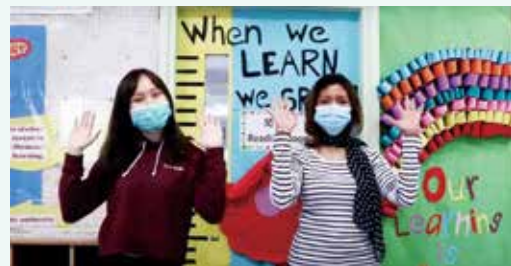
● 教師們粉墨登場拍攝「Baby Shark Hand Wash Challenge」