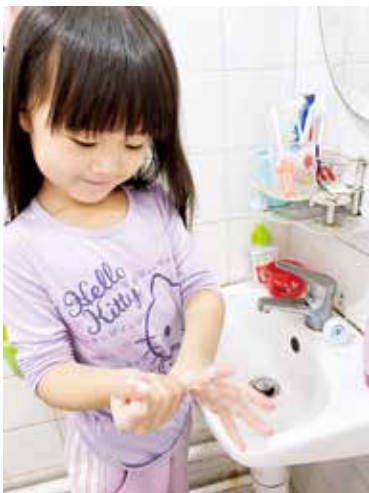
● 友愛幼稚園 / 幼兒中心的學生在家實踐正確的洗手方法