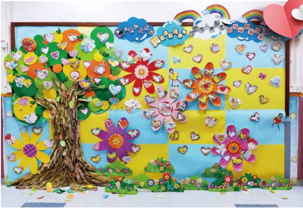
● 董伯英幼稚園 / 幼兒中心家長與學生利用不同物料製作心意卡，構成一幅「仁人齊心同防疫」的主題壁報