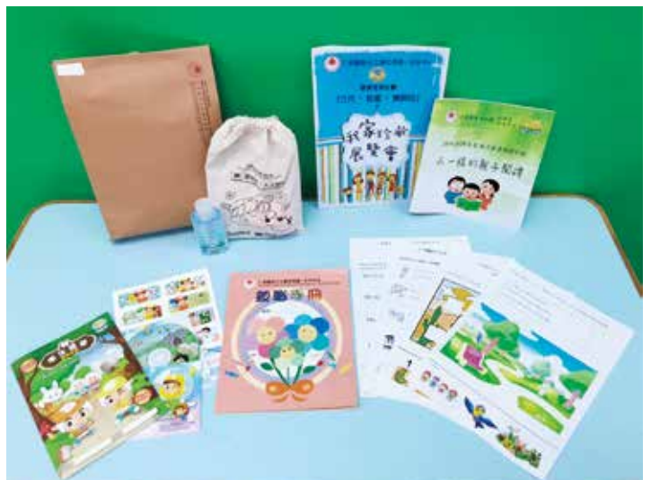
● 方江輝幼稚園 / 幼兒中心以郵遞或家長自取方式派發學習材料及防疫用品，並派發親職文章，為家長提供親職教養支援