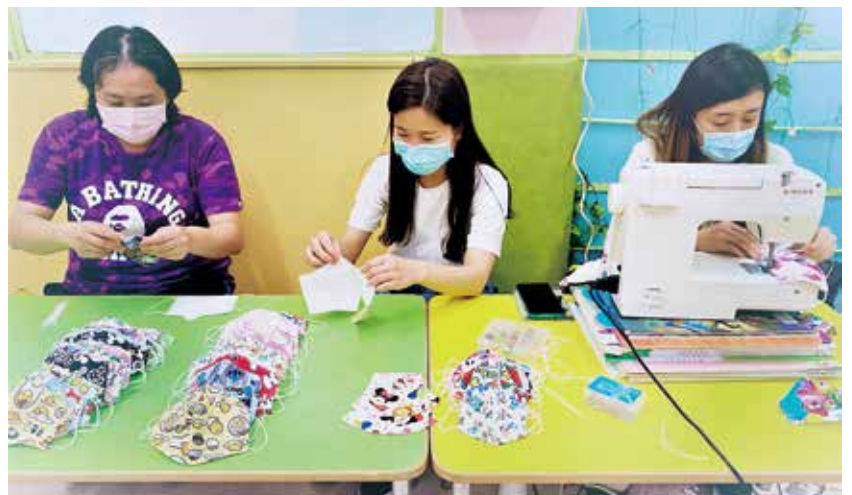
● 山景幼稚園 / 幼兒中心教師齊心製作「愛心布口罩」送予學生