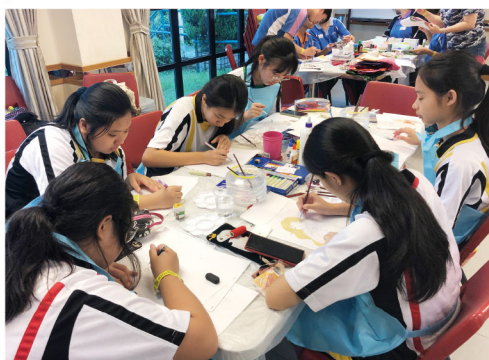
▶ 學生投入進行繪畫創作