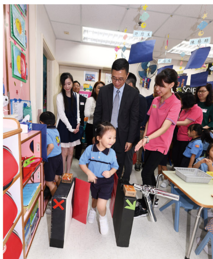
▶ 幼兒引領楊潤雄局長進入港鐵站模擬遊戲區

繪畫是幼兒表達自己心靈的最好工具。一冊小小的繪本從故事的構思、角色的擬定，書中的插畫創作，都是由幼兒主導完成，教師只是從旁協助。在創作的過程中，激發了幼兒的想像力和創造力，亦能提升他們的語言表達及藝術欣賞的能力。