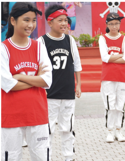
▶ HipHop隊的精彩演出，贏得遊客的熱烈掌聲