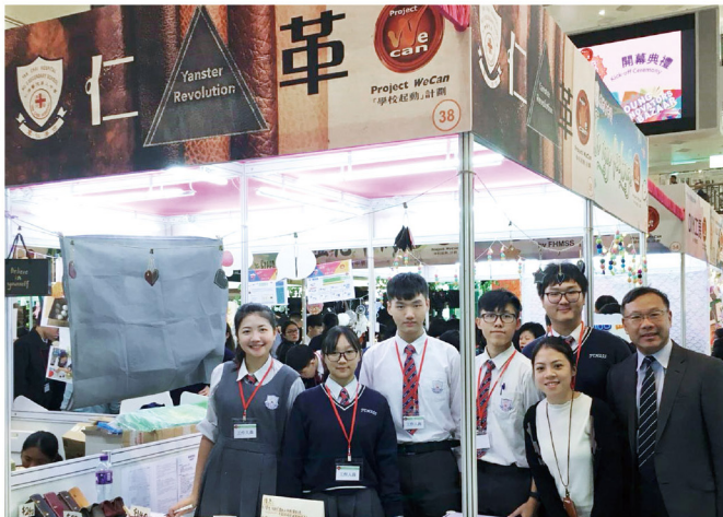
學生參與「學校起動」計劃，透過與配對企業緊密合作，從中啟發他們規劃人生，為日後升學及就業作好準備

他一同勇往直前。「二中的教師十分團結，凡事以學校為出發點。我們擁有共同的理念，為每位學生創設不同的機會及平台，讓他們發揮潛能，建立自信……」余校長一邊說，一邊露出一抹淺淺的微笑。