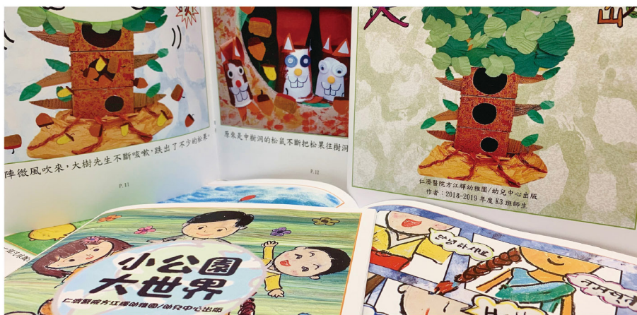
▶ 每一頁繪本都是幼兒用心之作，高班幼兒更為部分繪本創作兒歌，創意無限