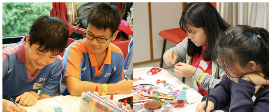
▶ 學生運用不同的顏色和物料完成畫作，表達心中所想