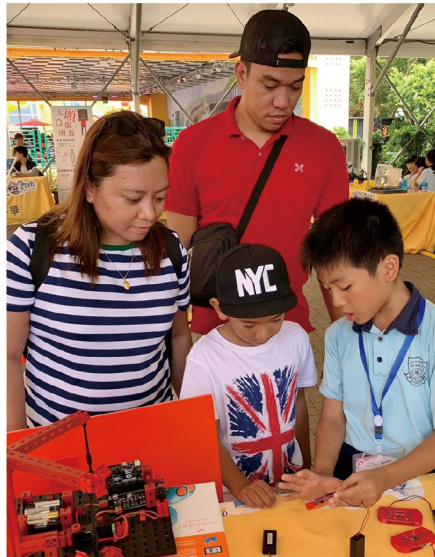
▶ 遊客對學生研發的智能家居編程作品甚感興趣