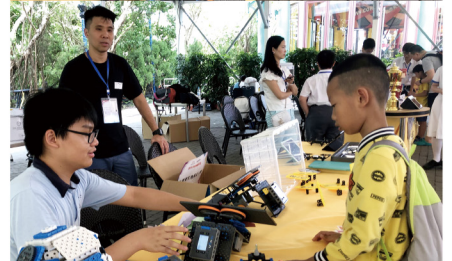
▶ 學生製作不同種類的機械人活動，供遊客試玩