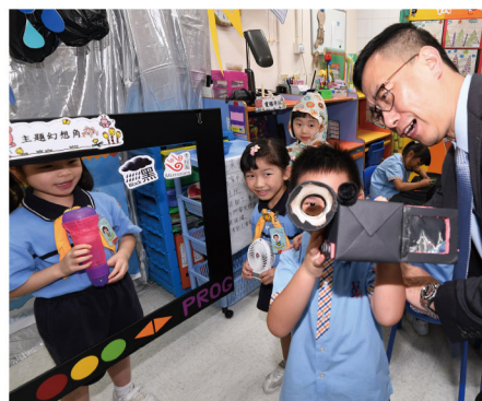
▶ 楊潤雄局長與扮演報導天氣小記者及攝影師的幼兒，打成一片，笑聲滿載

學校將生活情景融入遊戲課程。教師常與幼兒一起創設遊戲區，如「餐廳」、「天文台」及「港鐵站」等，並提供多元化教材，讓幼兒發揮想像力，進行角色扮演，並從參與中獲得深刻的生活體驗，增強他們社交、溝通及解難能力。