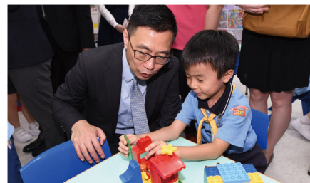
▶ 教育局楊潤雄局長、仁濟醫院董事局王賢訊主席及一眾嘉賓參觀校園，與幼兒聊天互動，樂也融融

2019年7月16日，教育局局長楊潤雄太平紳士到訪仁濟醫院方江輝幼稚園/幼兒中心，了解院屬幼稚園的最新發展，以及幼兒從遊戲中學習的情況。董事局成員陪同楊局長聽取校方簡介學校的特色及參觀校園，從中觀察幼兒自主遊戲時的情況，並與幼兒互動交談。此外，校方亦向楊局長及一眾嘉賓分享藝術繪本創作計劃的成功經驗。