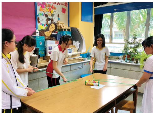
▶ 學生進行解難遊戲，促進彼此的合作和溝通

在2019年6月17至27日期間，社會服務部的專業社工先後到參與計劃的5間院屬中學舉行訓練工作坊。透過遊戲及處境模擬活動，增進學生自主、解難及社交等能力，並教授學生與長者訪談時打開話題及聆聽的技巧。