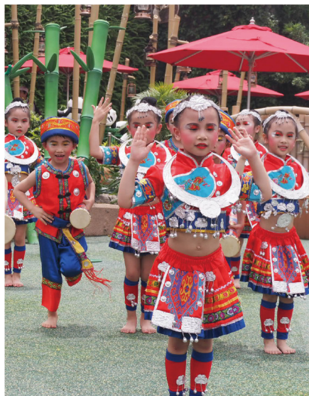
▶ 仁濟幼兒戴著銀鈴，手持長鼓，載歌載舞，將歡樂送予在場觀眾