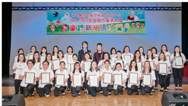
▶ 香港城市大學副校長(發展及對外關係)李國安教授、仁濟醫院董事局王賢訊主席與30名優秀教師拍照留念

仁濟董事局設立「優秀教師獎勵計劃」，旨在推動院屬幼稚園/幼兒中心教師在良性競爭下追求卓越，並宣揚尊師重道的精神。2019年度院屬幼稚園/幼兒中心優秀教師得獎名單如下：