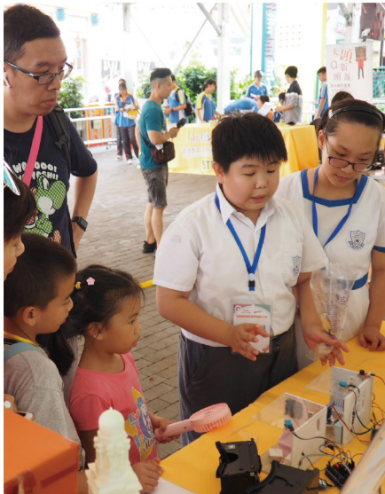
▶ 學生簡介STEM作品的設計理念