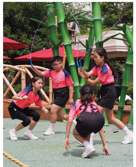
▶ 花式跳繩隊使出渾身解數，盡顯活力及團隊合作精神