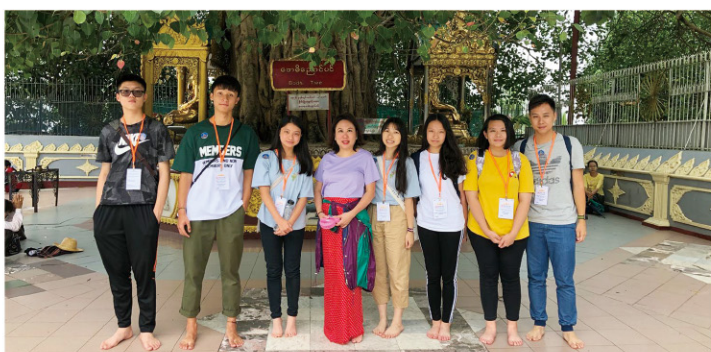
學生赤腳入寺，在菩提樹下留影，體驗緬甸人對佛教的尊敬