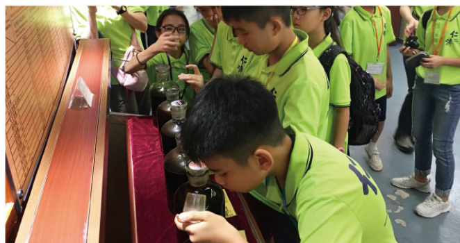
參觀古龍醬文化園，了解醬油的生產過程