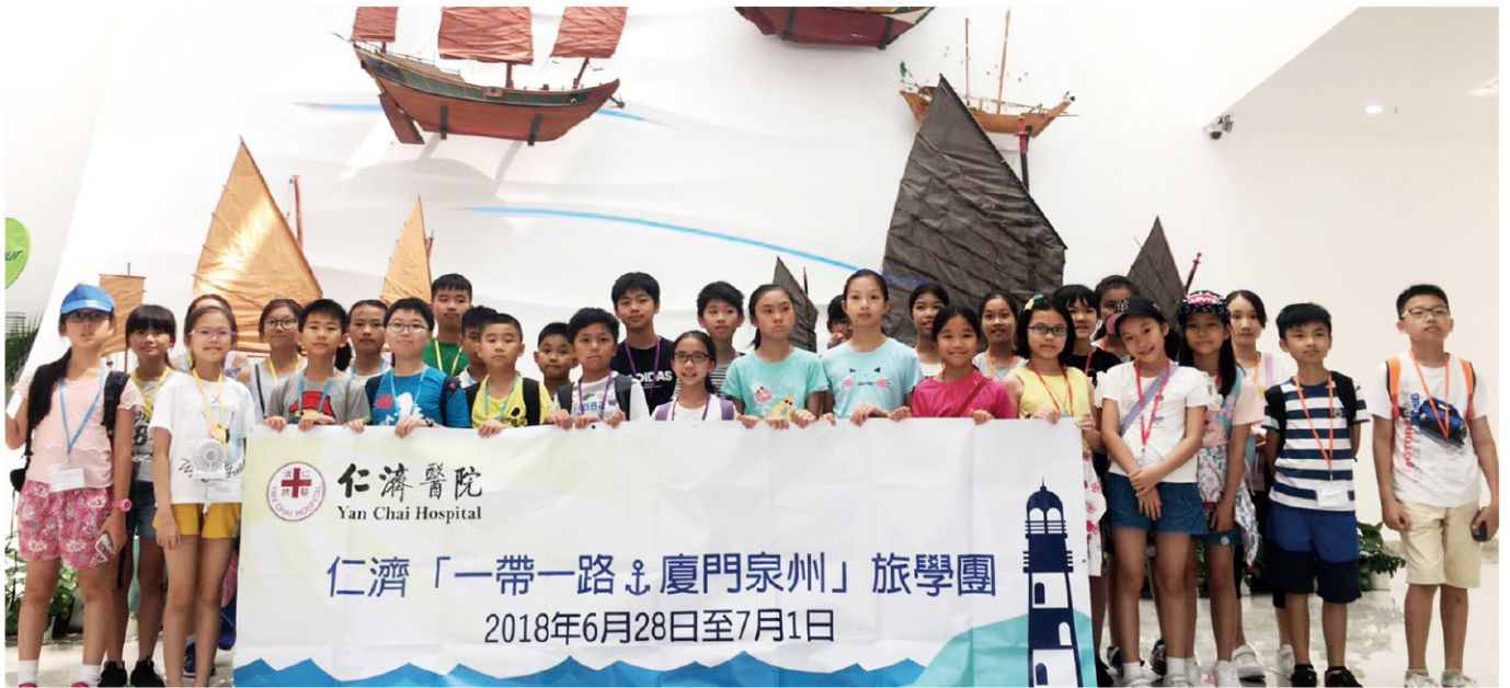
仁濟小學生到廈門及泉州，實地考察海上絲綢之路的起源