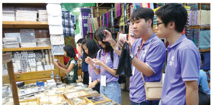
逛市集體驗當地民生