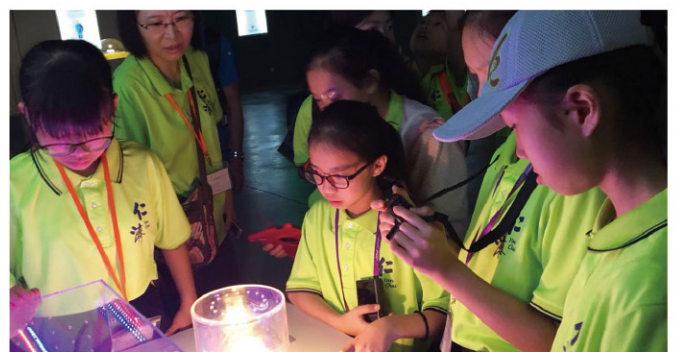
學生被通士達光影體驗館的互動光學項目所吸引