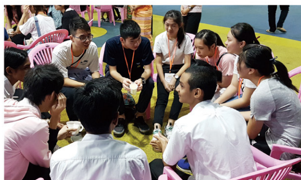
仁濟學生參觀緬甸國際學校，與當地學生建立珍貴的友誼