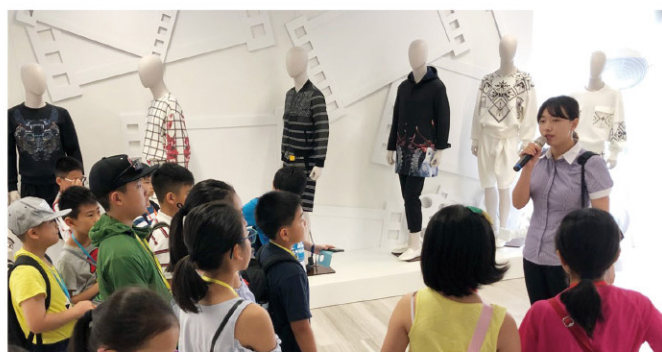
參觀七匹狼中國男裝博物館，認識傳統男裝發展及先進生產技術